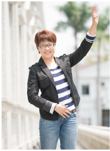
NO.12 高市議壇第十二期 / 議員講堂