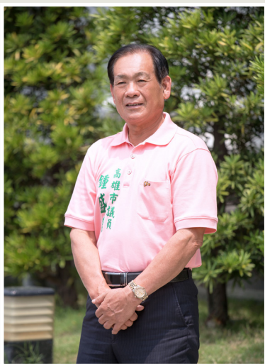
NO.12 高市議壇第十二期 / 議員講堂

註：根據南區水資源管理局的說明，伏流水是指流動或儲存於河床下方砂礫石層中的水源，利用輻射井中往外延伸的輻射管，收集潔淨水源，一路引取進入集水廊道，到達淨水廠，成為原水處理。