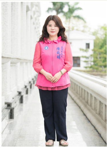
NO.12 高市議壇第十二期 / 議員講堂