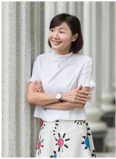
NO.12 高市議壇第十二期 / 議員講堂