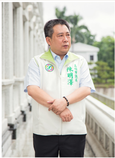
NO.12 高市議壇第十二期 / 議員講堂