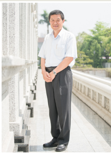
NO.12 高市議壇第十二期 / 議員講堂

他期待這次修正辦法的公聽會，除了能夠降低啟動法律強制作為的門檻之外，更要推動各種防制作為，包括空氣品質惡化時大眾運輸免費，進出港區、工業區的柴油車加裝濾煙器，大林發電廠將燃煤更新為燃氣，禁用生煤、一、二期柴油車以及二行程機車全面汰換要有時間表，全面動讓空氣品質確實改善的有感政策，才是王道，而市府也要在此時表達明確的立場，和市民站在一起。