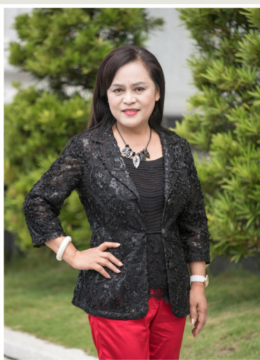
NO.12 高市議壇第十二期 / 議員講堂

伊斯坦大·貝雅夫·正福議員認為，這些補助款都是人民的納稅錢，以議員的立場而言，有必要提出行政革新的建議，因此他要求原民會多了解區公所如何運用經費，以免損及鄉親的權益。