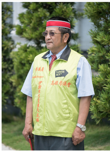
NO.12 高市議壇第十二期 / 議員講堂