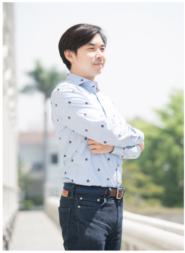
NO.12 高市議壇第十二期 / 議員講堂