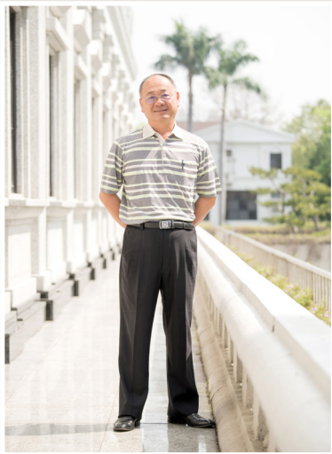
NO.12 高市議壇第十二期 / 議員講堂