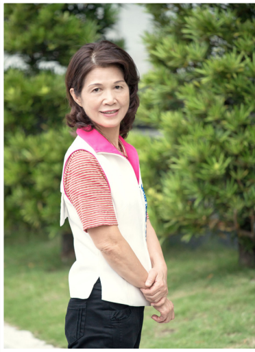
NO.12 高市議壇第十二期 / 議員講堂