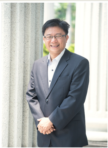
NO.12 高市議壇第十二期 / 議員講堂

在土地課稅的議題上，李議員也關心未來地價稅調漲的標準。他表示，105年地價稅漲幅平均高達32.52%，使得市民叫苦連天，所以他建請市府研究調降地價稅，並主張炒地皮者與一般民眾之課稅標準應有所分別，以符合社會追求居住正義與土地正義要求。