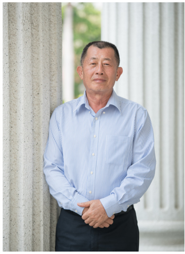
NO.12 高市議壇第十二期 / 議員講堂