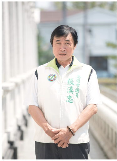
NO.12 高市議壇第十二期 / 議員講堂