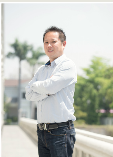
NO.12 高市議壇第十二期 / 議員講堂

黃議員表示，PM2.5是空氣污染中直徑小於2.5微米的懸浮微粒，可以深入人的肺部，並直接進入血管中隨著血液循環全身，對人體造成的影響不容忽視；連世界衛生組織也發表聲明指出，PM2.5是引起缺血性心臟病、心肌梗塞及癌症等非傳染性疾病的危險因子。他期盼市府多種植深根樹種以因應空汙及極端氣候，並推動可行性之防範措施，逐步從社區、學校落實到整個大高雄，以保障高雄市民的健康。