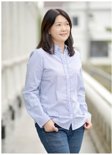
NO.12 高市議壇第十二期 / 議員講堂