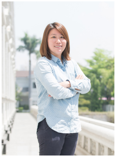
NO.12 高市議壇第十二期 / 議員講堂