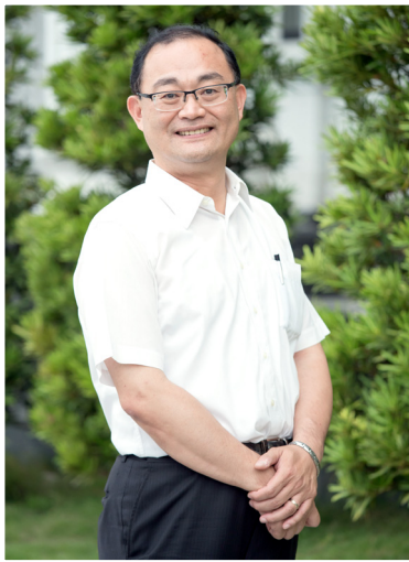
NO.12 高市議壇第十二期 / 議員講堂