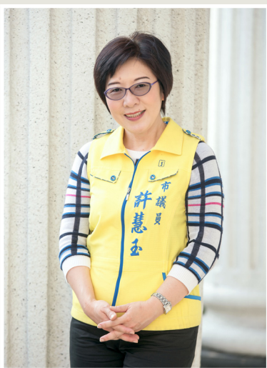
NO.12 高市議壇第十二期 / 議員講堂

周議員於第四次定期大會市政總質詢時再次強調，民意一再訴求國1中山高速公路仁武和左營兩側排水和匝道興建工程開發案，一定要用整體開發區段徵收的方式辦理。如果到最後決定用徵收補償，勢必引起極大的抗議聲浪；更何況在過去舉辦的公聽會當中，府、會、學者、地方民眾都無雜音，也是一個三贏的方案，對工程順利推動最有利。周議員希望市府面對中央不同的主張，能堅守立場，讓「國10東向銜接國1北上匝道」工程，可以順利推動，早日解決鼎金系統交通壅塞的問題。