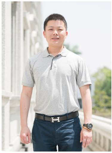
NO.12 高市議壇第十二期 / 議員講堂