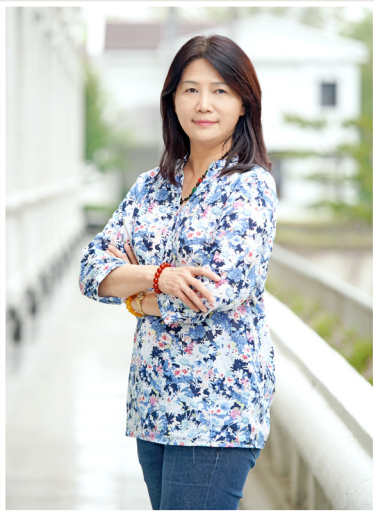
NO.11 高市議壇第十一期 / 議員講堂