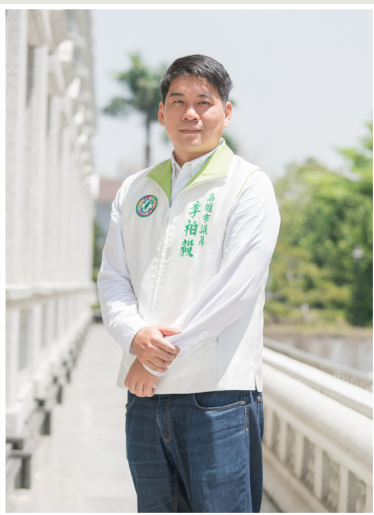
NO.11 高市議壇第十一期 / 議員講堂

園區目前200家廠商約100家有廢水產出，經發局要求各廠排放到污水要達到規定現值標準，才能排放至污水處理管中。但陸議員擔心如果委託的廠商除了園區內，又可以到園區外面收取廢水，區外的廠商沒有做先期的廢水處理，而是將污水直接排放至污水廠的管線，直接由污水廠的處理，這是不符合規定的。她要求經發局負起主管機關之責，發揮監督的角色。