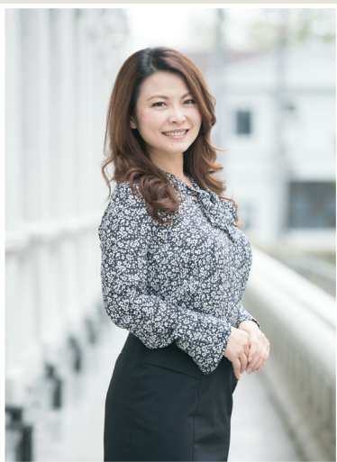
NO.11 高市議壇第十一期 / 議員講堂

他期待市府能善用過往經驗，以及各國成功案例，打造高雄成為全台灣第一個發展電動汽車共享的城市。