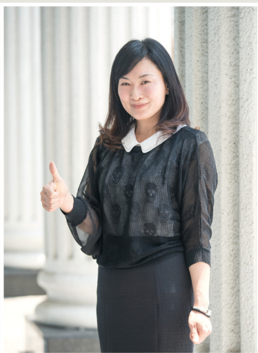
NO.11 高市議壇第十一期 / 議員講堂

曾議員也為大坪頂熱帶植物園區感到可惜，過去她也曾提出園區內缺失要求養工處改善，然而多年下來，具有教育功能的園區，不僅教育局，觀光局和養工處等都沒有妥善規劃提高曝光，使其成為一個觀光景點，然當地兩位里長非常用心，他們希望可以將此園區規劃成為高雄的陽明山後花園，盼望市府可以花心思多加了解地方想法，一起行銷園區的特色。