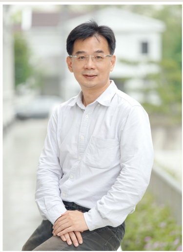
NO.11 高市議壇第十一期 / 議員講堂

黃議員表示，攤販一天能賺1,000元已經很不容易，2張各2萬元的罰單讓他們如何能生活。更重要的是，其他攤販看在眼裏，還會有意願配合政府政策嗎？違規需要處罰才能導正不當，但是處罰可以有很多種，現今景氣不佳，許多家庭都只能靠微薄的收入維持生活，希望各局處在對市民開罰同時，能夠以同理心對待，先以勸導或不傷市民荷包的方式進行，如果不行再處以罰款。