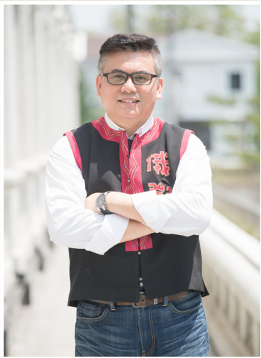
NO.11 高市議壇第十一期 / 議員講堂