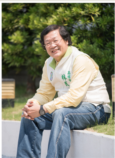
NO.11 高市議壇第十一期 / 議員講堂

黃議員認為，目前四個職棒球隊，中信兄弟以台中洲際棒球場為主場，Lamigo則選擇桃園，統一長期租用台南棒球場為主場。富邦金控雖然有意以新莊為主場，但礙於世大運無法使用等因素，高雄市仍有機會爭取富邦金控選擇澄清湖棒球場為主場，希望市政府能夠積極爭取，讓高雄仍能擁有屬於自己的主場球隊。