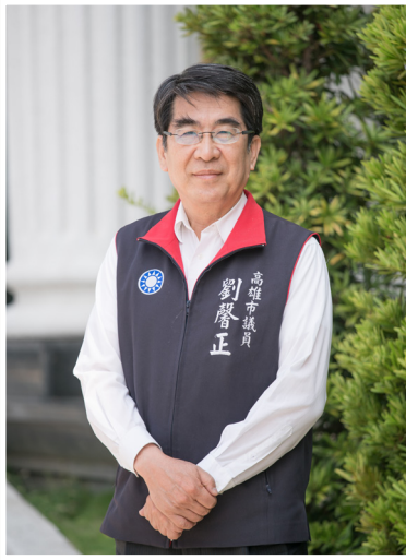
NO.11 高市議壇第十一期 / 議員講堂