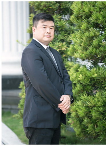
NO.11 高市議壇第十一期 / 議員講堂