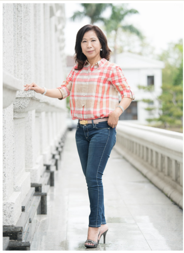
NO.11 高市議壇第十一期 / 議員講堂