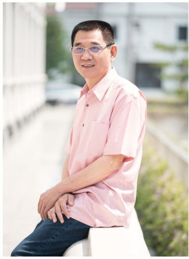
NO.11 高市議壇第十一期 / 議員講堂