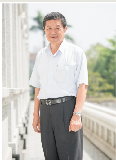
NO.11 高市議壇第十一期 / 議員講堂

這些場所將管制室內空氣污染物，大多為二氧化碳、一氧化碳、甲醛、PM10及細菌等項目，依照場所的特性而各自有所不同，市府所屬包括大專院校、圖書館、醫療機構所在場所、社會福利機構所在場所、政府機關辦公場所、鐵路運輸業車站、民用航空站、大眾捷運系統運輸業車站、展覽室及會議廳、商場等10類型都應先作表率。