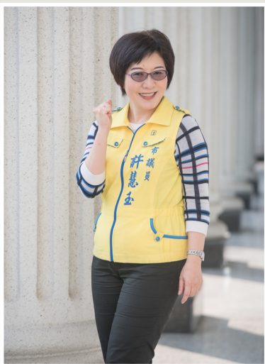
NO.11 高市議壇第十一期 / 議員講堂

周議員也感慨，現在被稱為高雄市的伴手禮均不太理想，高雄並沒有像台中有太陽餅、新竹有米粉及貢丸。本市欠缺具有特色的伴手禮，真的很可惜。他認為並不是高雄沒有特產，各地或多或少有推出伴手禮，然而均缺乏深度文化的包裝，因此無法讓人留下深刻的印象。