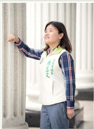
NO.11 高市議壇第十一期 / 議員講堂

在台灣，不管是經營小吃店，還是當醫生、老師、軍人等任何正當職業，都應該有權利受到公平的對待與祝福，而現在政府頻頻塑造軍公教為阻礙改革的一群，但是各地的公聽會卻又限制軍公教進場發表意見。黃議員表示，民進黨應該讓更多有關軍公教的人士入場，並且充分表達意見，進而整合出讓各方滿意的方案，而不是讓其他行業關在裡面審判軍公教，如果這種不公不義的年金改革還要持續下去，倒不如就此罷手，解散年金改革委員會，重新修補被撕裂族群情感，對社會反而有好處。