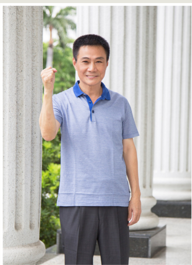
NO.11 高市議壇第十一期 / 議員講堂

其他五都的現行作法是限制家長只能報名一所幼兒園，其中台北市更有學區的雙重限制，今年高雄市教育局也有意跟進採取報名園數僅限一所的做法。對於新擬定的措施周議員呼籲教育局可以再多考量家長的需求，雖然全面開放不切實際，但只限一間也有所不便。周議員指出，現在幼稚園的小朋友，有的並不是跟著父母同住而是由爺爺奶奶照顧，即使跟著父母同住，家長的首要考量也有可能是離工作地點近的而不是住家附近。因此建議教育局可以把報名的園數增加至2-3家，讓家長能有更多的選擇和機會。