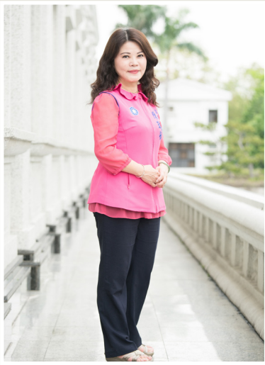
NO.11 高市議壇第十一期 / 議員講堂