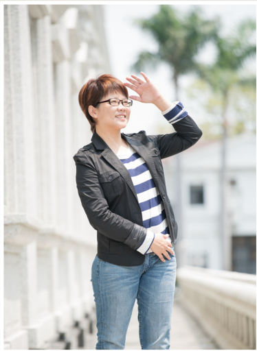
NO.11 高市議壇第十一期 / 議員講堂