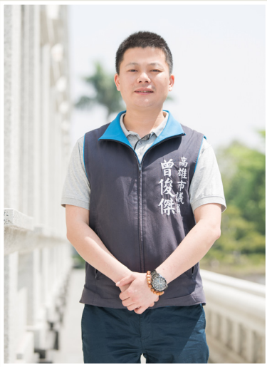
NO.11 高市議壇第十一期 / 議員講堂