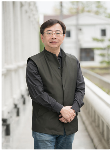
NO.11 高市議壇第十一期 / 議員講堂