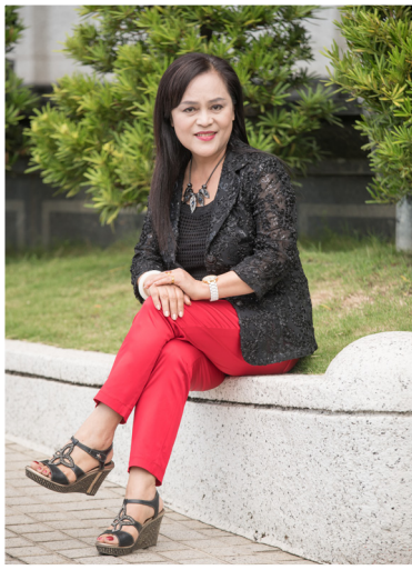
NO.11 高市議壇第十一期 / 議員講堂