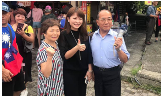
陳美雅議員盼市府透過機制鼓勵高齡者投入社會參與，豐富退休後的生活。

再者，陳議員也主張廣設社區長青學苑，勤走基層的她聽到許多的長輩表示長青學苑不容易進去，他們喜歡學習，市府也應該鼓勵活到老學到老的精神，因此增設長青學苑有其必要性，讓更多高齡者都能接觸新知，使生活更多采多姿。