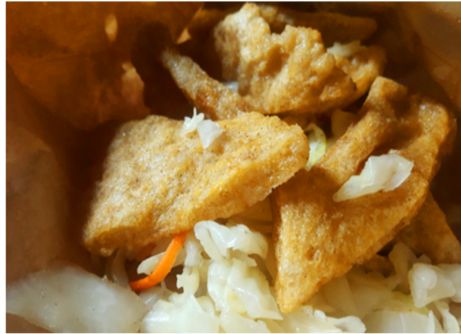
清蒸臭豆腐與炸黑輪片，皆是駁二夜市高人氣且高CP值的代表小吃。