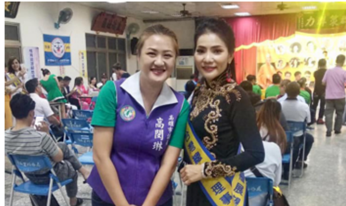
高閔琳議員認為新住民的多元文化應受重視，政治人物勿以對他們的歧視言論損及城市形象。

高議員呼籲，市府行政單位同時也擔任起韓市長或是市府檯面人物的幕僚角色，必須協助局處首長清楚認知性別歧視、種族歧視有損城市形象，而這類相關的講座、座談也可以邀請各單位首長前來參加，議會也會全力支持。她期盼不論哪個政黨執政都是朝向高雄市進步、幸福和宜居的目標邁進。