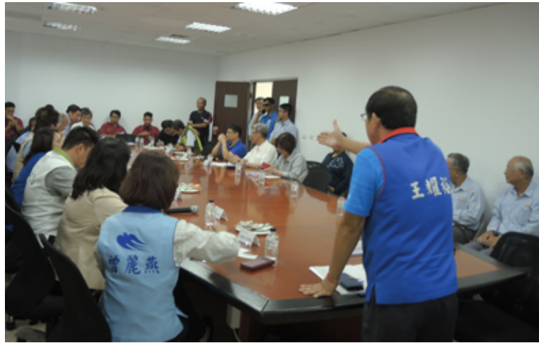
工安小組成員們全力為高雄市工廠的安全應變，進行把關。