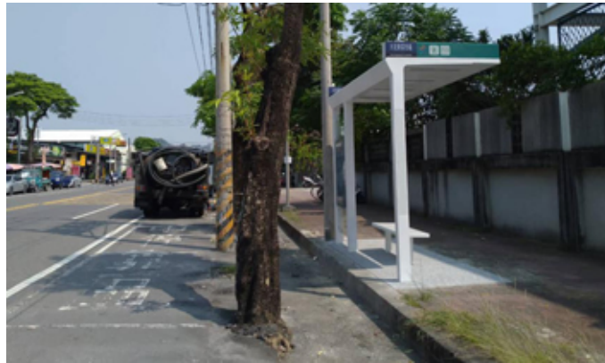
去年許慧玉議員議員預期的大社果菜市場公車站候車亭，終於於今年9月完工啟用。

另外，今年9月26日位於大社果菜市場公車站的懸臂式候車涼亭終於完工。許議員表示，該座涼亭是去年11月偕同當地居民一起向市府爭取，經大社國中同意無償提供土地讓交通局設置而完成。有了這座涼亭大大增加大社鄉親通勤等候時的舒適性，不過大社、烏松幅員廣闊，很多學生和長輩出入都有賴公車通行，加上南部氣候炎熱，很多地方都有相同的需求未被關注，雖然交通局目前財源有限，但還是建議可以先進行調查盤整，等日後有足夠的財源或與民間擴大合作，逐一將地方需求完成，讓更多的鄉親感受大眾運輸的便利舒適。