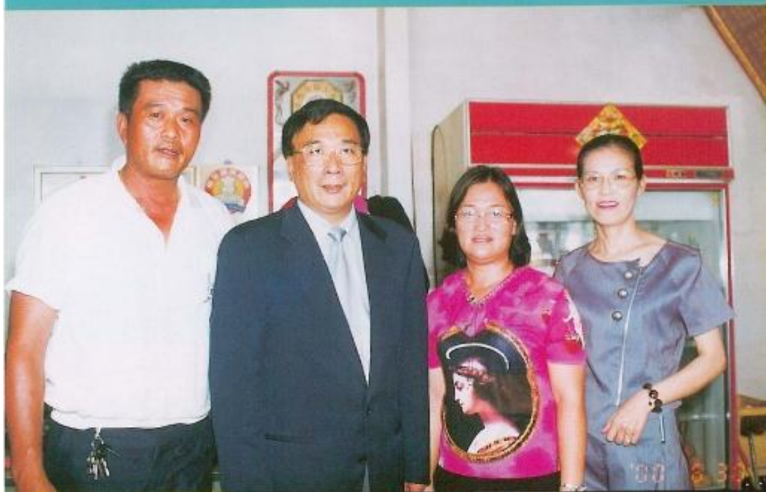
◀ 議長許福森(左二)下鄉至甲仙鄉探訪民情。