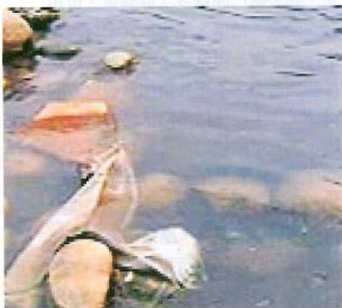
▲ 旗山溪遭不肖業者傾到大量有毒物質，致溪水嚴重污染。

經過此次事件，相信許多人仍心有餘悸，但空談仍不足以成事。設若，中央能從此正視南方心聲，痛下決心補助巨額經費整治高屏溪。設若，地方政府發揮魄力與公權力，同時從上、下游並駕齊驅，直搗不肖廠商。更重要的，吾等百萬縣民更應起身主動，時時刻刻視「水權」爲人權，人人都是環保尖兵、環保警察，讓污染者無絲毫生存空間，如此一來方能真正杜絕污染源，共創無污染、無恐懼，平安、健康的美好家園。