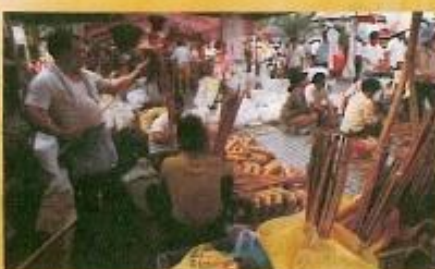
▲ 一年三次的籃筐會是岡山遠近馳名的趕集盛會。