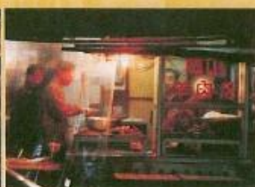
▲ 羊肉料理是老饕至岡山必嚐的美食。