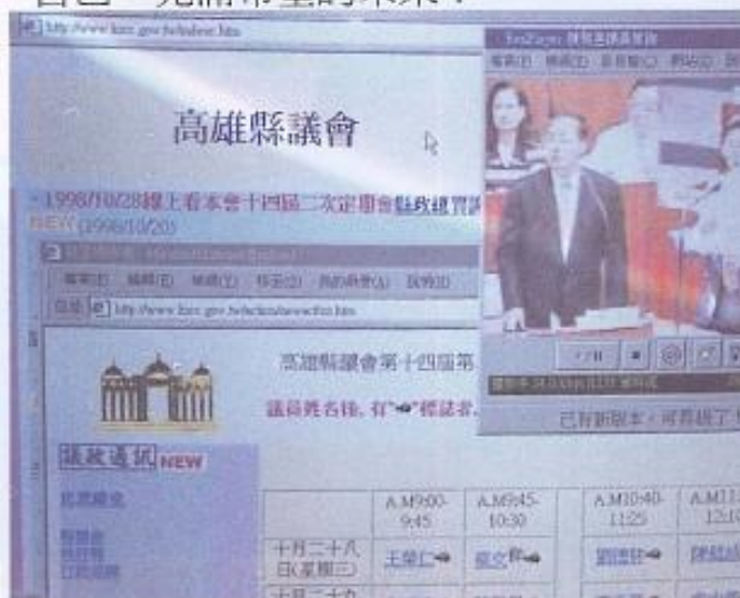
▲民衆藉由網路可以獲得議會的相關資訊線上觀看質詢過程。

公元兩千年是資訊爆炸的時代，電腦勢必成為生活上必備的工具。還未接觸電腦的民衆，可要加緊腳步，為新世紀的來臨做好準備，迎向屬於自己、充滿希望的未來！