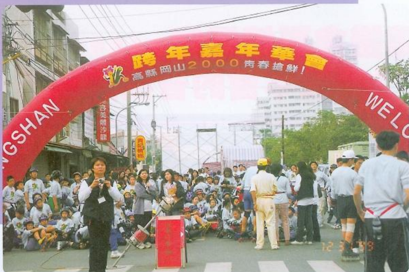
▲「高縣—岡山2000·青春搶鮮」跨年嘉年華會吸引大批民眾參加。