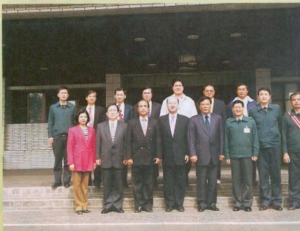
▲議長、副議長與團管區謝副司令合照留念。

每年春節的時候，總是離鄉背井的遊子返家團聚的重要時節，但是軍中的弟兄，肩負著捍衛國家的使命，必須堅守自己的工作崗位，一刻也不能懈怠地守衛國土，以致無法如同其他人般歡歡喜喜的和家人團聚。尤其是年節時刻，國家安全更是不能忽視，國軍弟兄的重要性更是重大。本會感謝所有官兵弟兄為我們所做的犧牲及努力，更期盼大家一起為他們加油、打氣，為台灣的未來帶入更美好的境界！