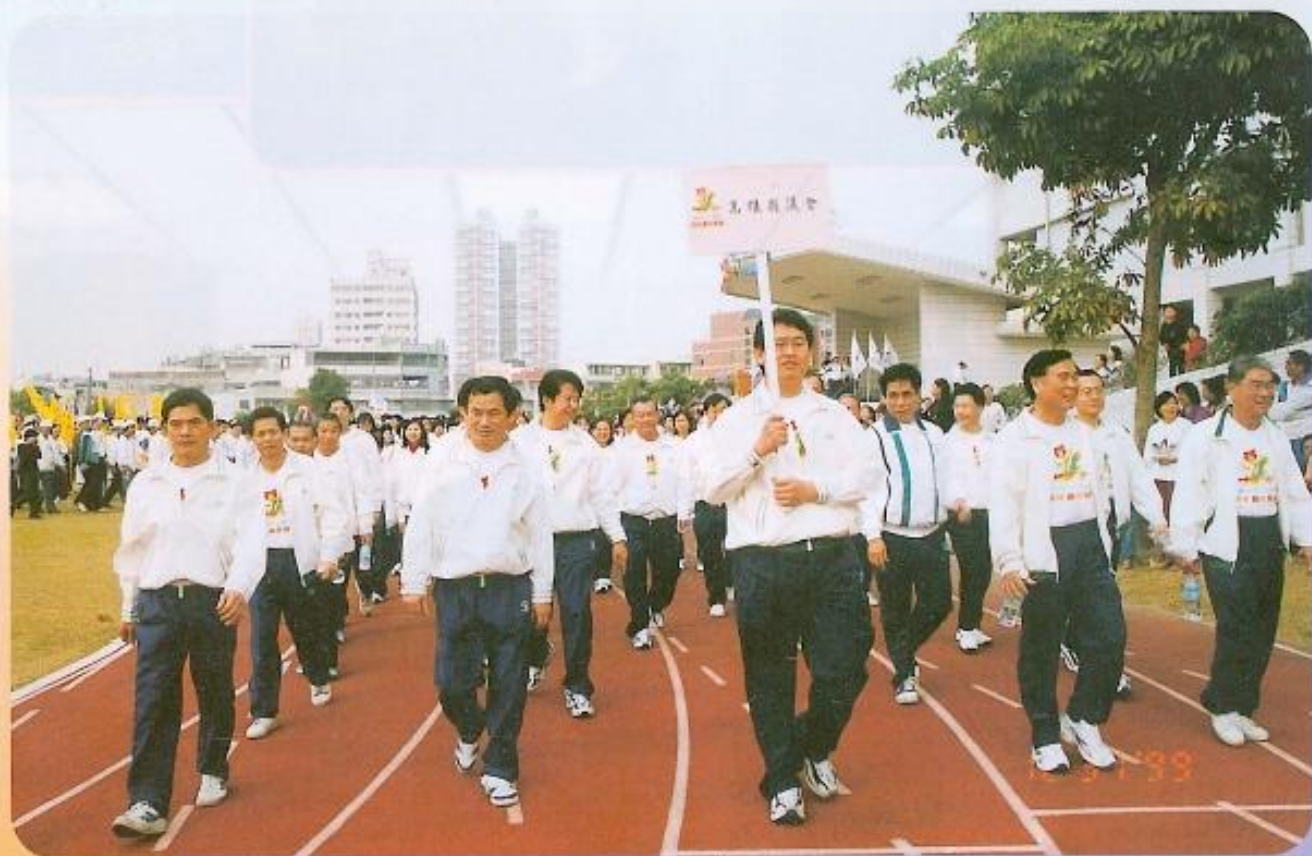
▲本會職員以團結一致的步伐參加遊行。