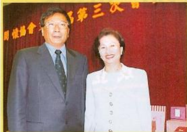
▲ 行政院蕭院長夫人朱倣賢女士拜會 議長許福森。