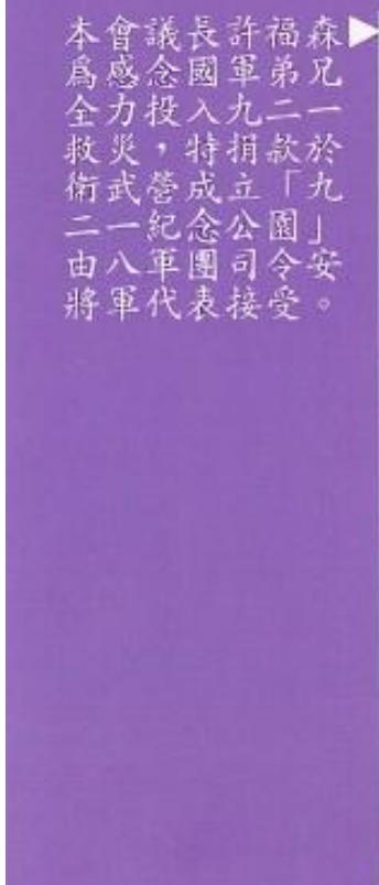
▶ 森兄一於九「安」 福弟二款「園」受 許軍九捐立公司接 長國入特成念團表 議念投，營紀軍代 會感力災武一八軍 本為全救術二由將