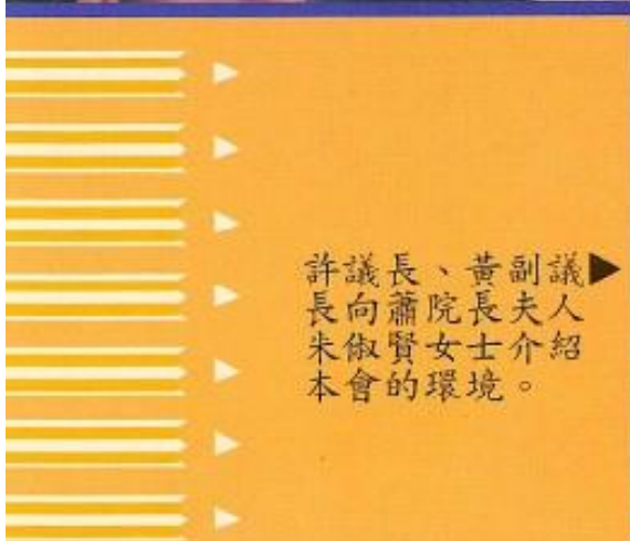
▶ 議人介紹 副夫介 黃長士 、院女環 長蕭賢的 議向傲會 許長朱本