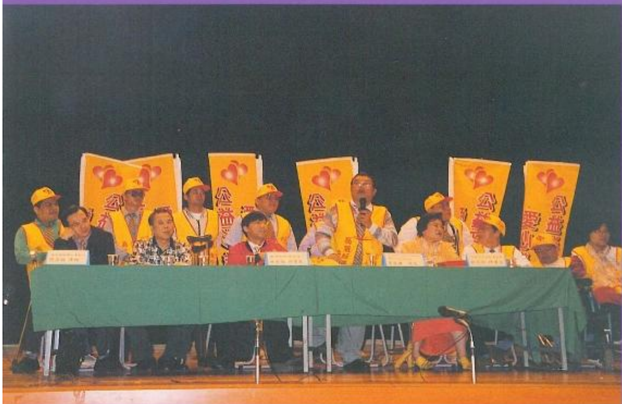
式、議、成、正、會、組、券、本、機、彩、發、行、中、央、發、行、員、「、愛、對、平、