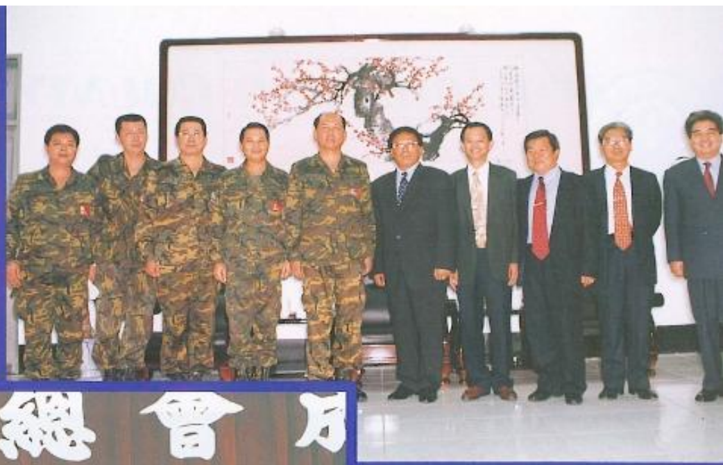
黃會車、議員八、議及陸、森、錢、福、許、長、議、兆、各、團。