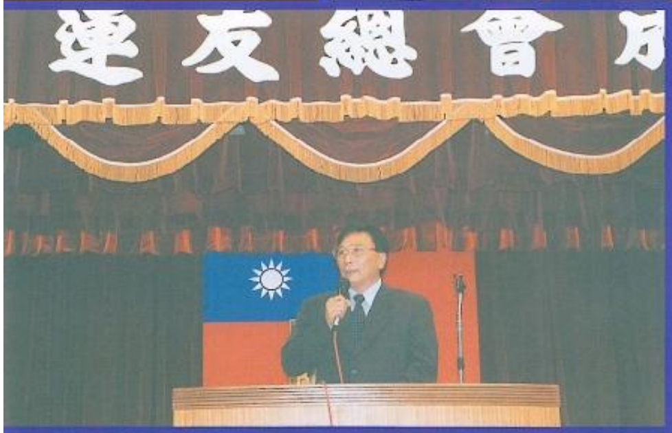
森、福、許、長、連、友、總、本、會、任、會、長、榮、會。