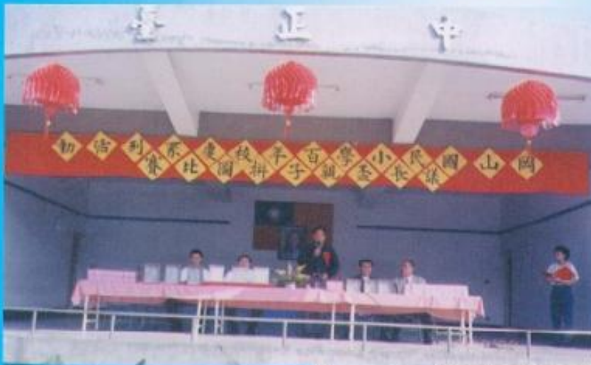
▲岡山國小百年校慶系列 活動—議長盃親子拼圖 比賽。