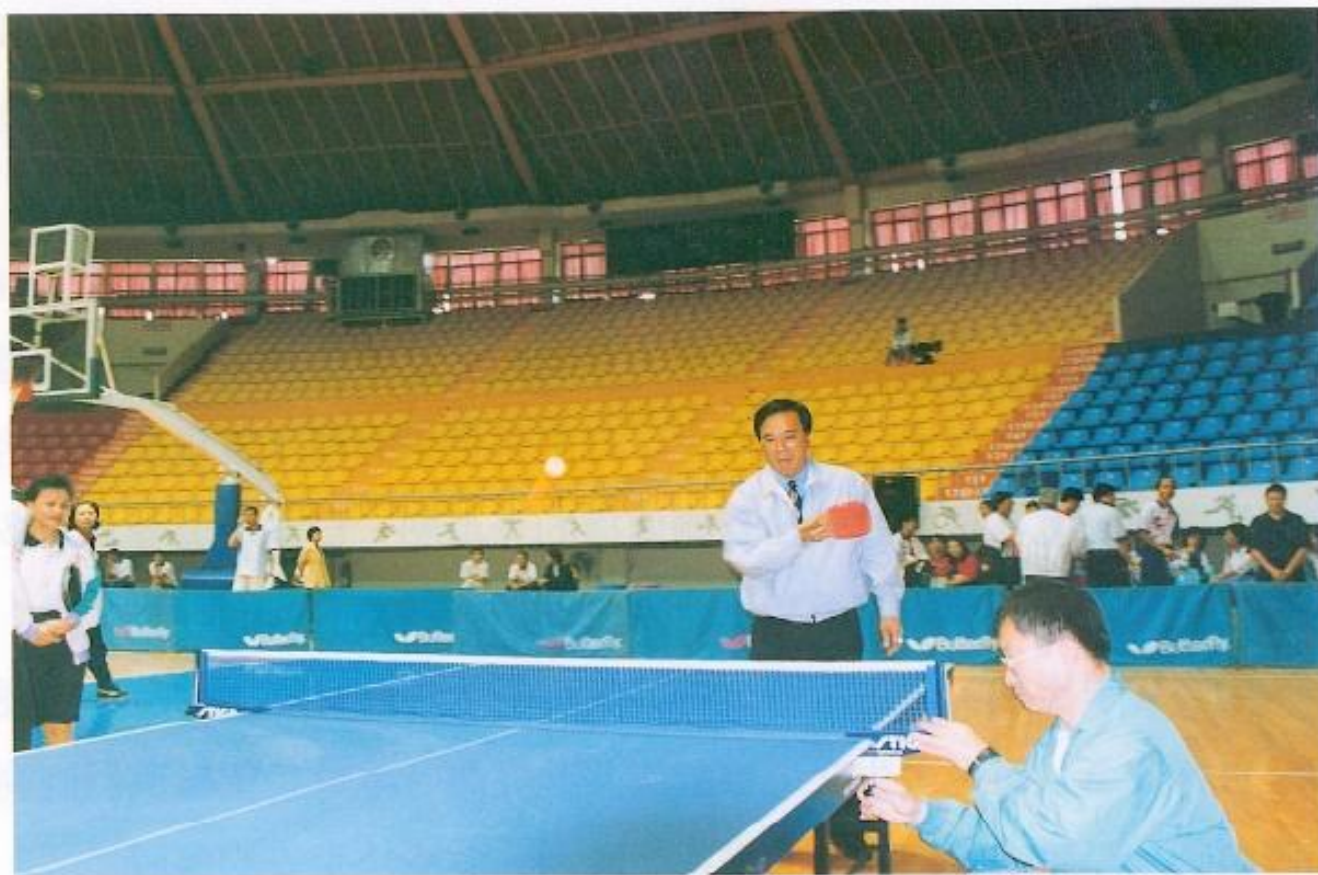
▲非常喜歡運動的許議長呼籲縣民要常運動以保持身心健康。

許議長在五月二十三日至路竹國小為選手們加油打氣，除在現場表示將全力支持推廣巧固球外，也希望多養成良好的運動習慣，減少如飆車、吸毒等不正當活動，才能提昇生活品質及維持身心健康。