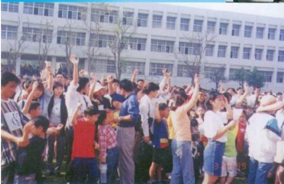
◀ 人山人海的岡山國小百週年慶。