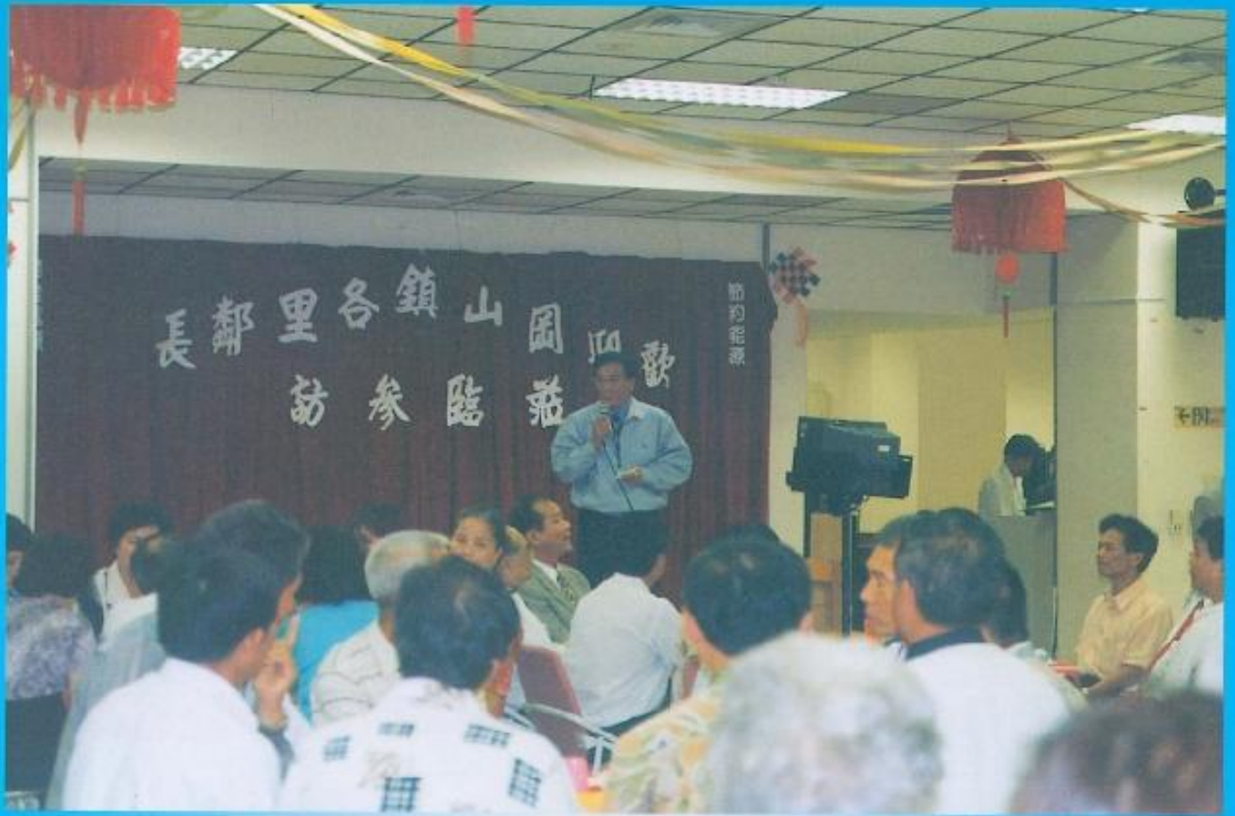
▲本會與各社團的互動良好 常有縣民組團來訪。