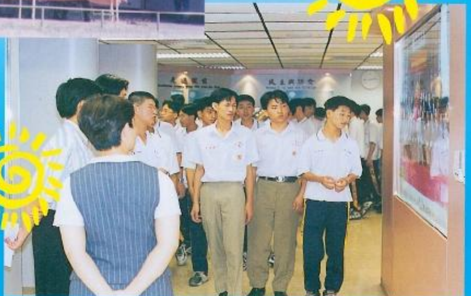
▶本會會史館開放給學 生參觀。