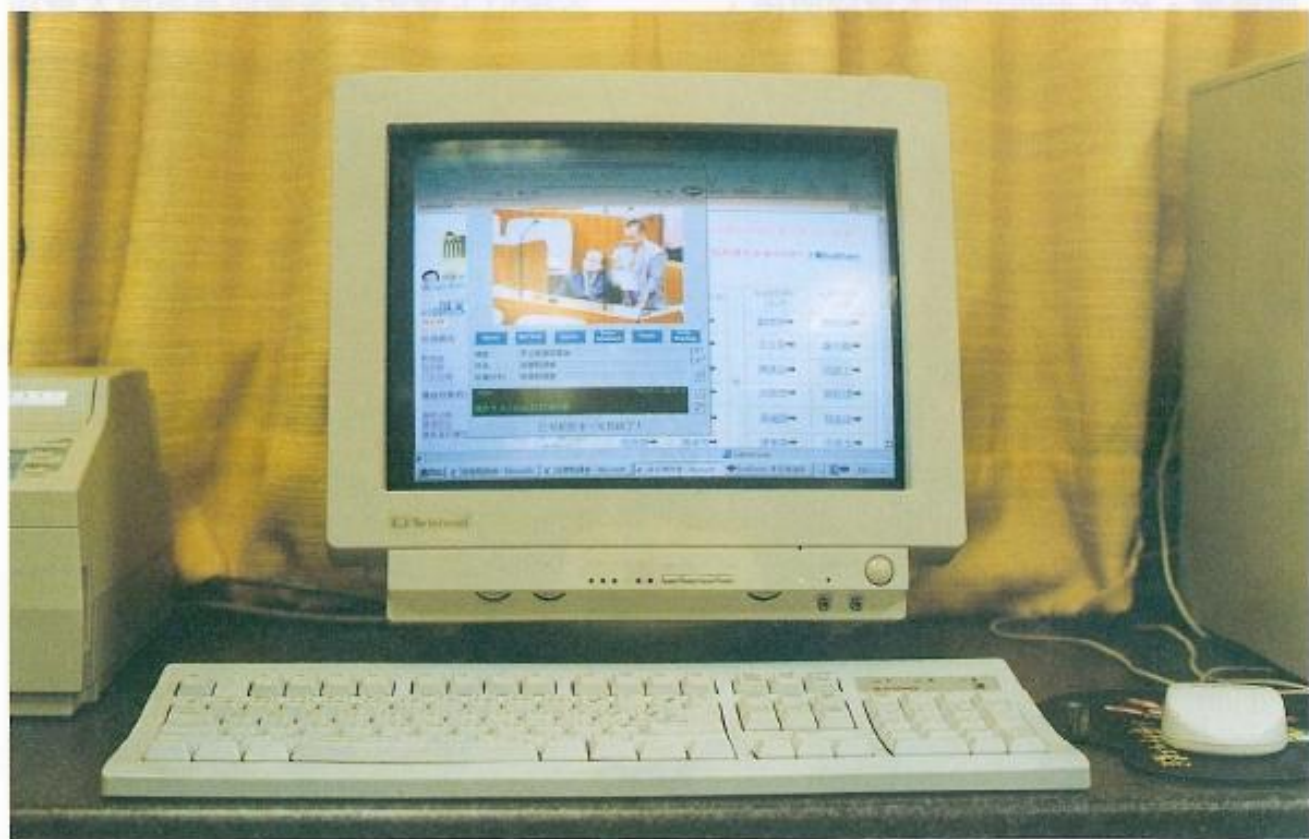
▲現在透過Internet民衆可以在全世界任何角落觀看議員們的精采問政。

歡迎民衆踴躍上網與本會進行各種交流，讓我們共同監督縣政，邁向高雄縣二十一世紀更光明的未來。