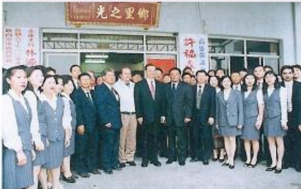
●議長許福森及議會同仁們與連副總統合影。