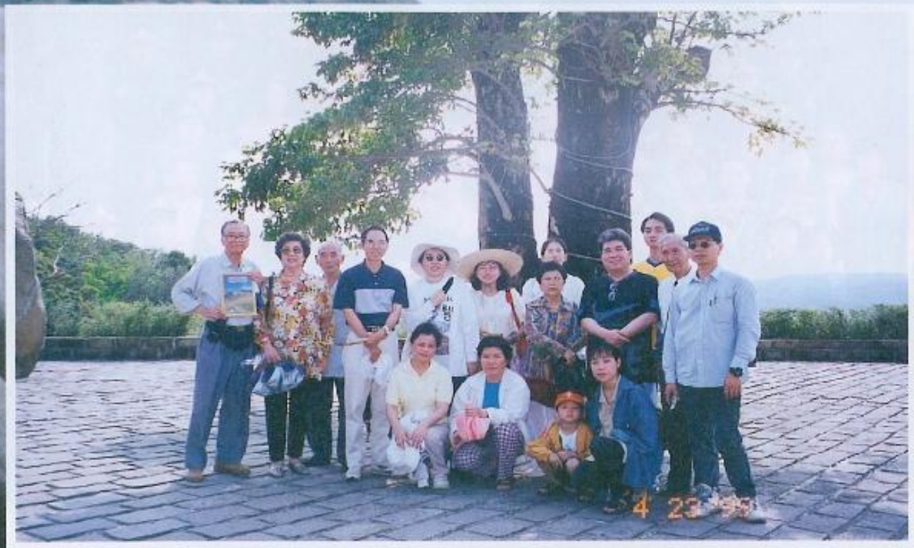
▲參加本會員工自強活動的工作同仁於恆春合影留念。