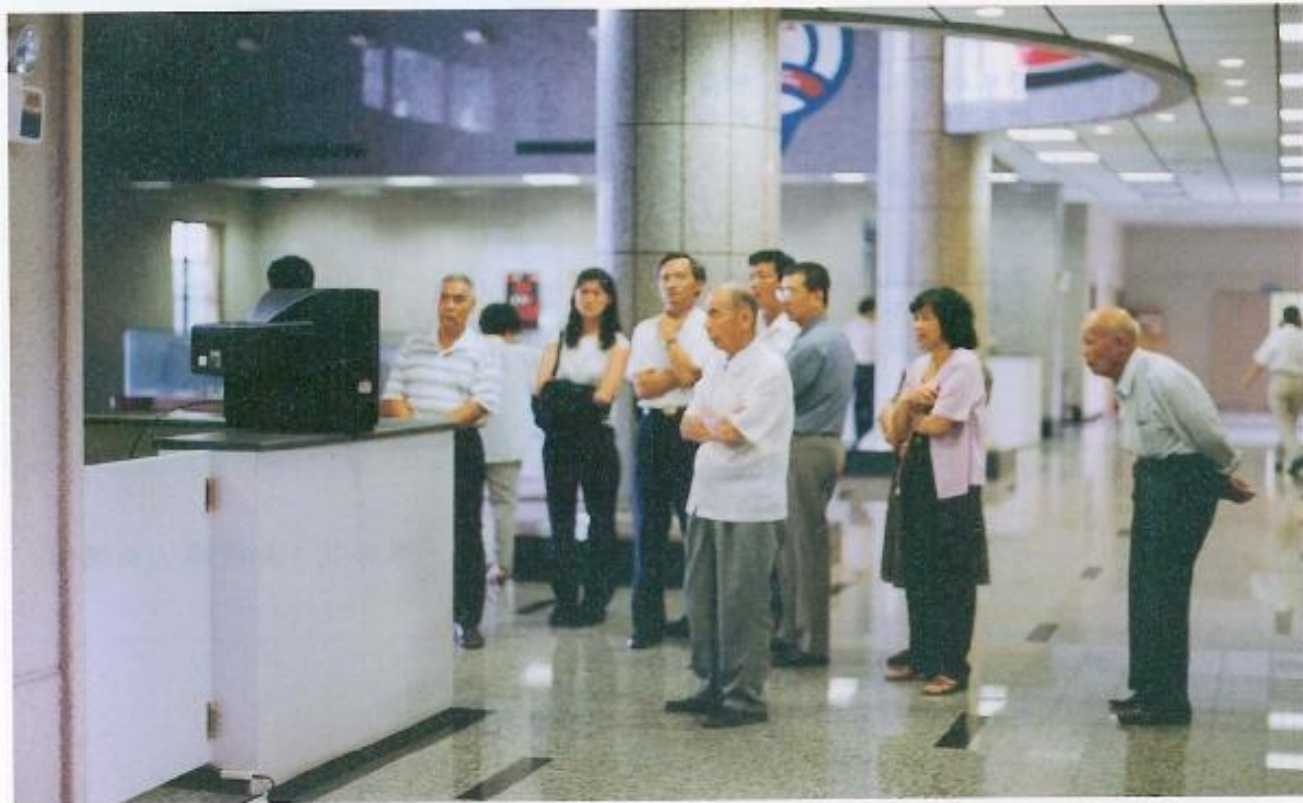
▲關心縣政的民眾透過電視收看議員們的精采問政。