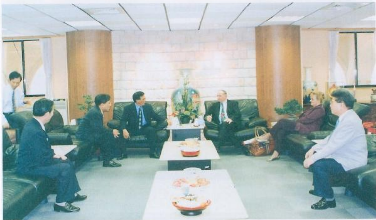
▲議長許福森招待遠道而來的本縣姊妹縣--澳洲北昆市蘭省凱恩斯市愛斯頓郡郡長金·查普曼夫婦。

金·查普曼夫婦此行來訪，正逢本會召開第十四屆第三次定期大會，當他們抵達本會時，許議長宣佈暫停會議之進行，並率副議長、議員及單位主管至門口迎接，請金·查普曼夫婦至議事廳入座。許議長於致歡迎詞時表示：他和黃副議長及本會議員、各單位主管對查普曼郡長蒞臨本會指