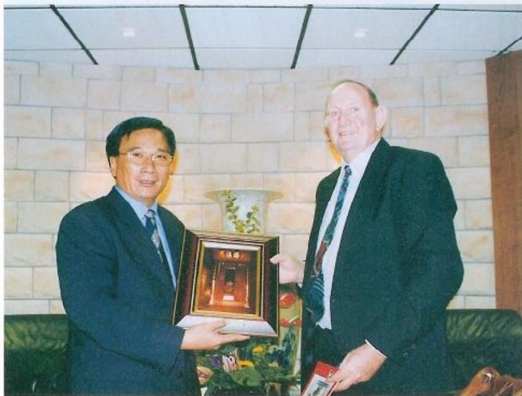
◀ 許議長贈予紀念品，查普曼郡長愛斯頓。圖為許議長贈予查普曼郡長紀念品。

由於查普曼郡長此次訪問本縣行程非常緊湊，沒有時間參觀本會其他設施，雙方在愉快的氣氛中，結束此行訪問本會的行程。