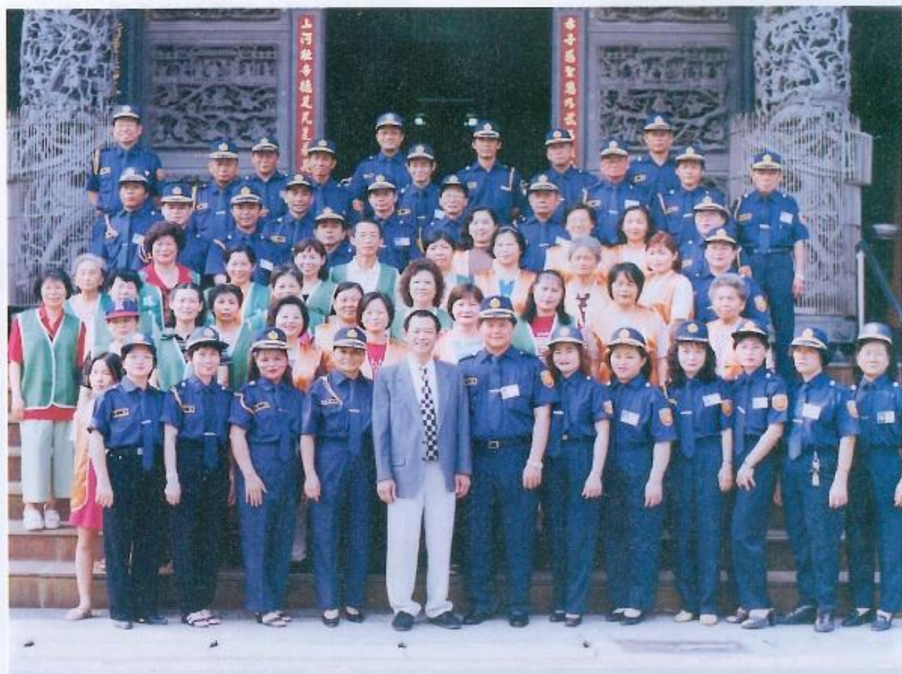
▲為服務縣民，鳳山市赤山地區居民自發性成立巡守隊及義工媽媽。

且警察的勤務又是那麼繁重，社會治安的維護，光靠警察的力量是不夠的，必須社區內的居民，大家團結起來，為改善治安、打擊犯罪而付出我們的心力，才能獲致成果。如果犯罪案件減少了，如果竊盜案件不再發生，我們生活在無恐懼的環境裡，出門不必擔心家中是否會遭小偷光顧，那我們平日所有的付出，一切都是值得的，許議長非常希望其他社區，也能成立類似的組織，讓我們的社會更祥和、更安定。