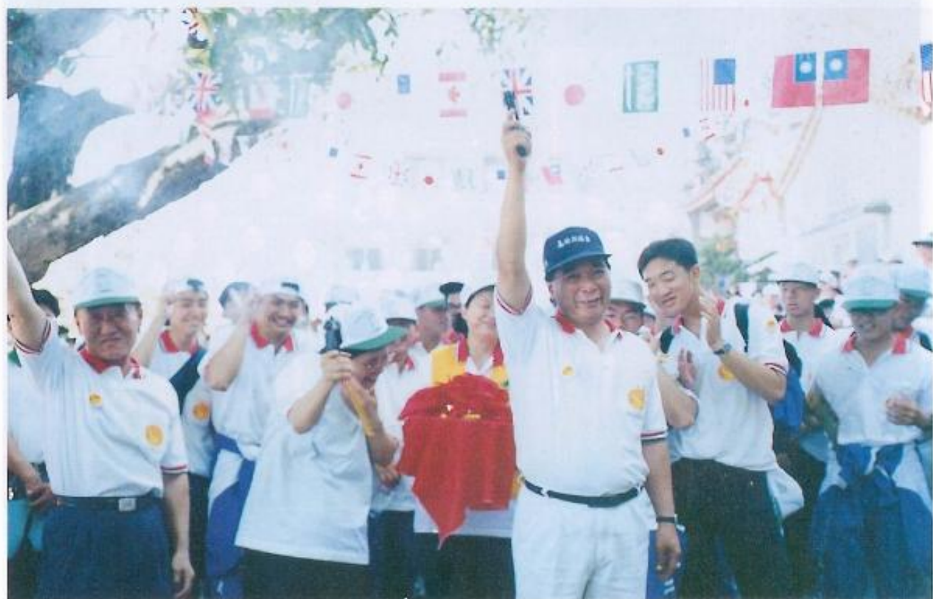
▲大岡山兒保健行活動在許議長的鳴槍典禮下開始進行。

參加民衆沿著大崗山環山步道健行，沿途飽覽山色美景，並可眺望本縣永安、彌陀海岸線。主辦單位更是用心在路上設置分站教育，讓登山民衆在爬山健身之餘，也讓親子一起動動腦，宣傳兒童保護知識，並增加親子間的親情。