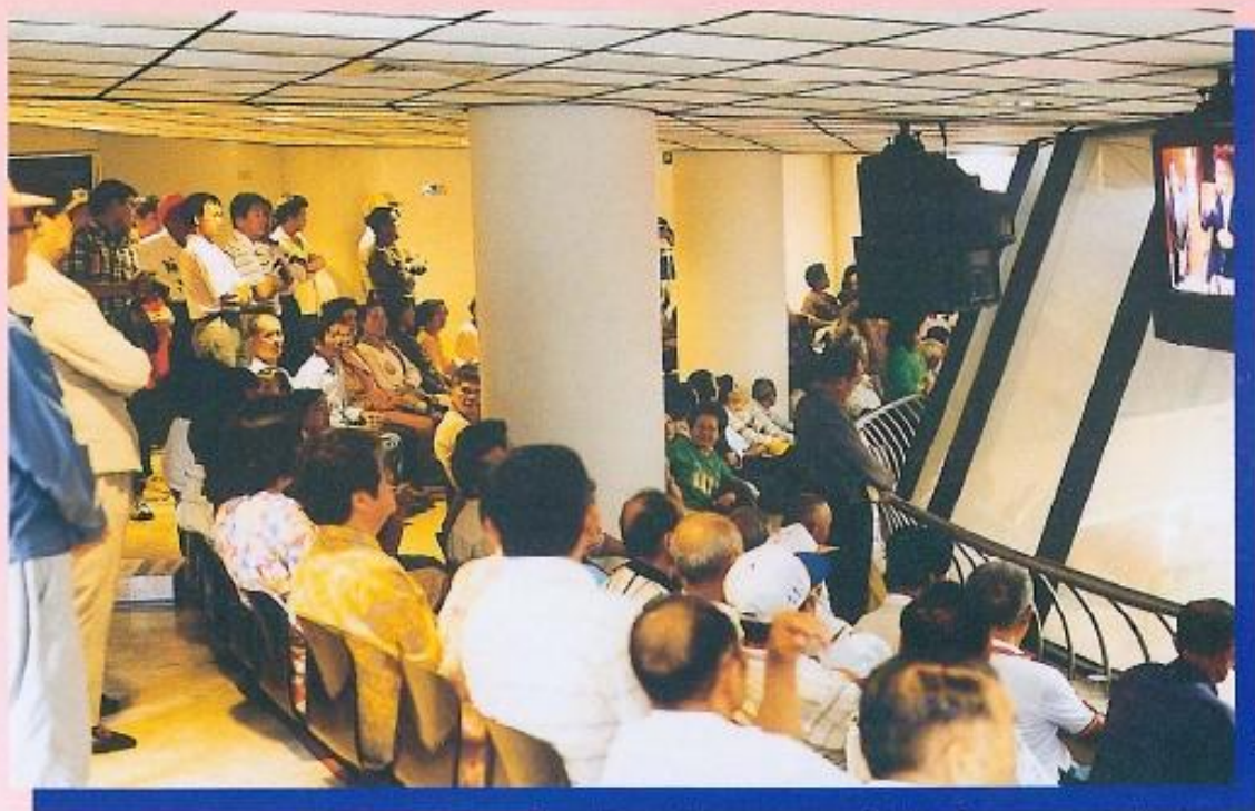
◀本會議事廳三樓旁聽席常常有民眾到場關心縣政。