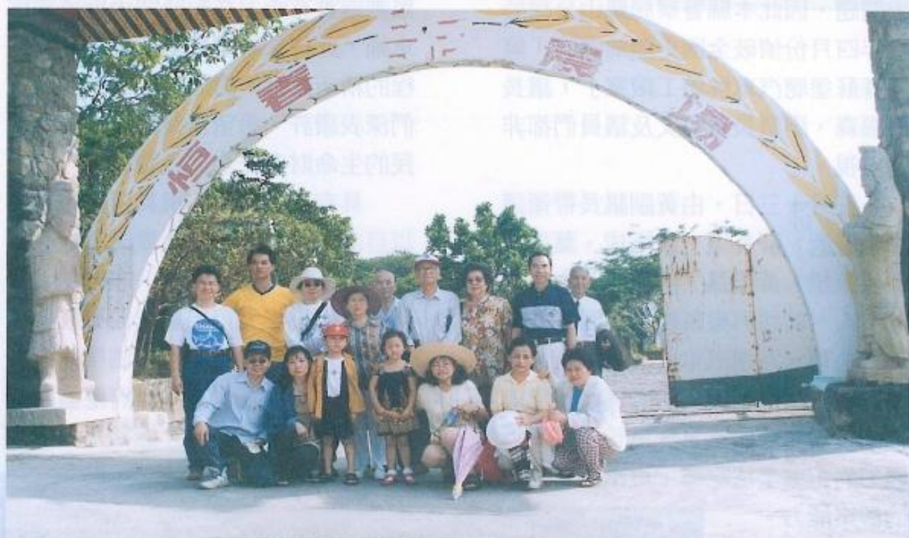
▲本會員工在恆春生態農場留影。

充電後的本會員工，在回到工作崗位後，大家顯得更有衝勁，也提昇本會的團結力量，對於即將來臨的定期大會，同仁們將更加賣力為民服務，讓大會順利開，圓滿成功。