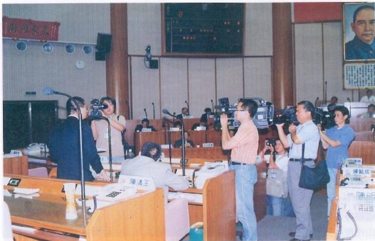
▲本會縣政總質詢實況。

台灣省先例，把議員總質詢實況畫面，於每日議事開始進行後同步在本會網站上即時轉播議事實況。上網使用者只要具備影音播放軟體RealPlayer G2（可透過本會網站鏈結至該軟體廠商網站免費下載）即可開啓收看議員質詢實況。另外，若是縣民們無法即時上網觀看質詢實況，本會亦將個別議員質詢影音內容存檔，縣民可隨時上網，點選欲觀看個別議員質詢或縣政論壇的精采實況。