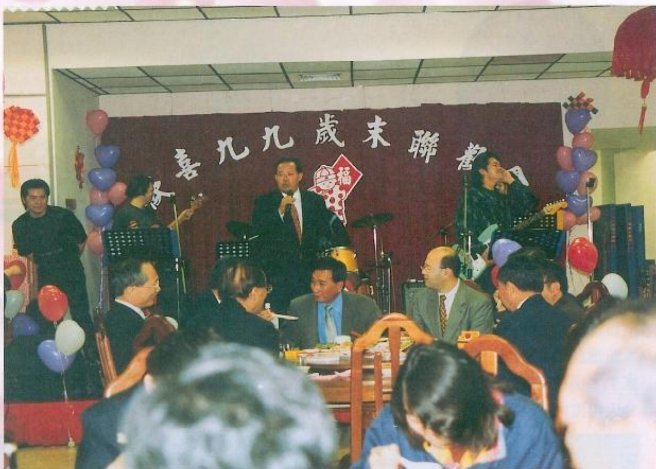
▲縣長余政憲蒞臨本會與本會同仁同歡。