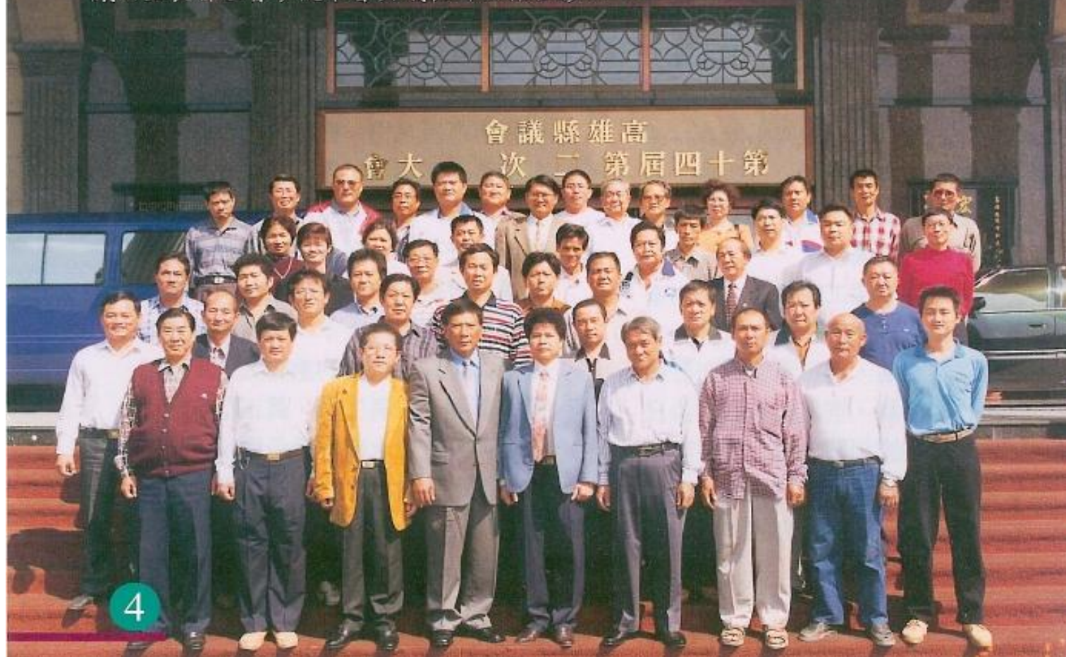
鳳山里長聯誼會參觀本會與議長許福森合影。

許議長指出，本會希望多聽取各鄉鎮市基層民意心聲，畢竟，監督縣府不光是本會職權，也是百萬縣民的權利，尤其里長們更能反映民瘼，所以關於里長們所提供的寶貴建議，本會將會給予重視及回應。另外，於座談會之中，許議長也幽默的表示，由於個人吃素好幾個月，很多不必要的