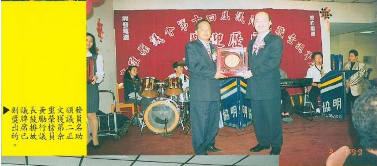
發 員 名 助 。 頒 議 二 正 文 獲 第 二 名 。 重 榮 榜 第 二 名 。 黃 勵 行 徐 榮 榮 。 長 鼓 排 員 議 。 議 牌 席 出 的 副 獎 出 的 副 獎 出 的