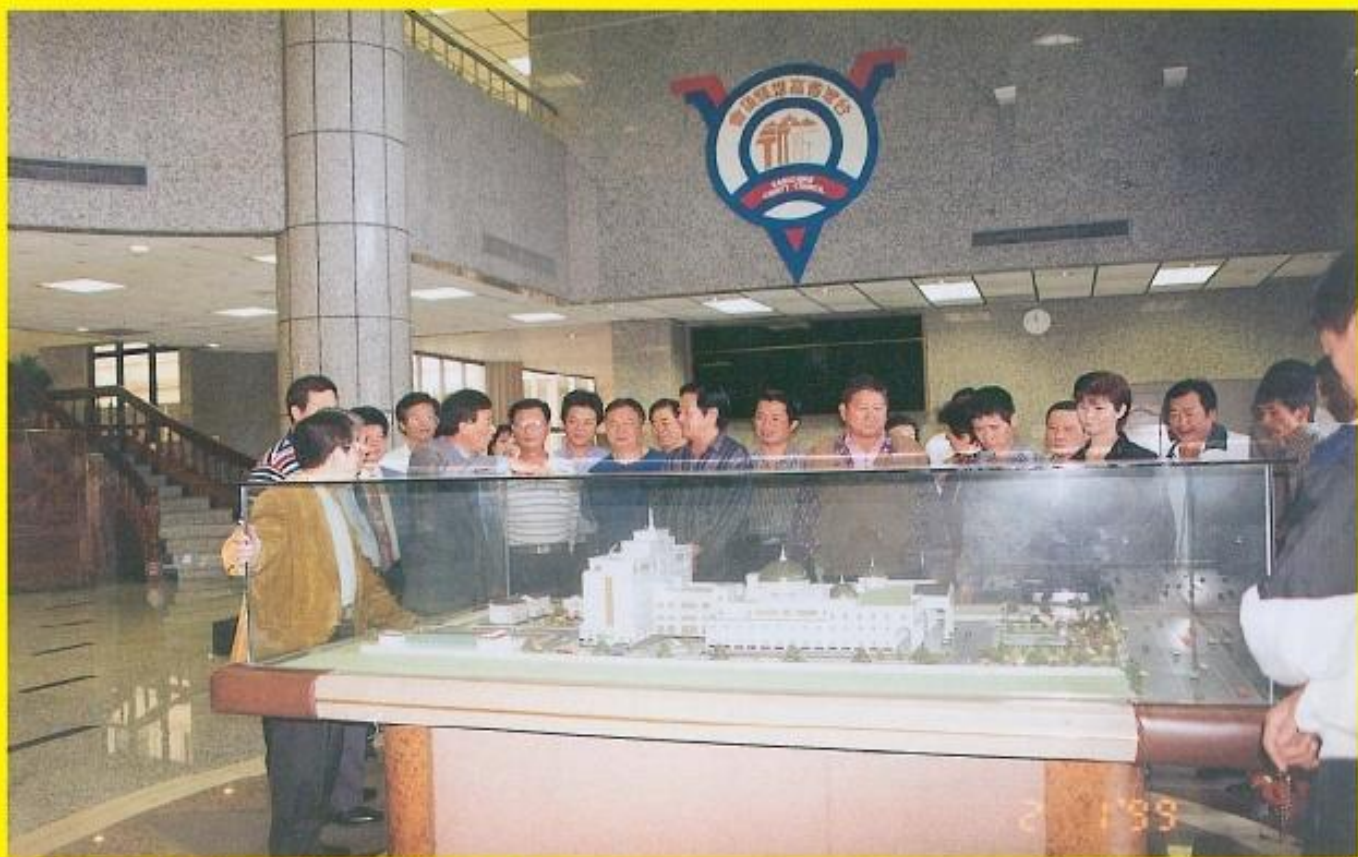
▲ 鳳山里長們參觀本會建築模型。