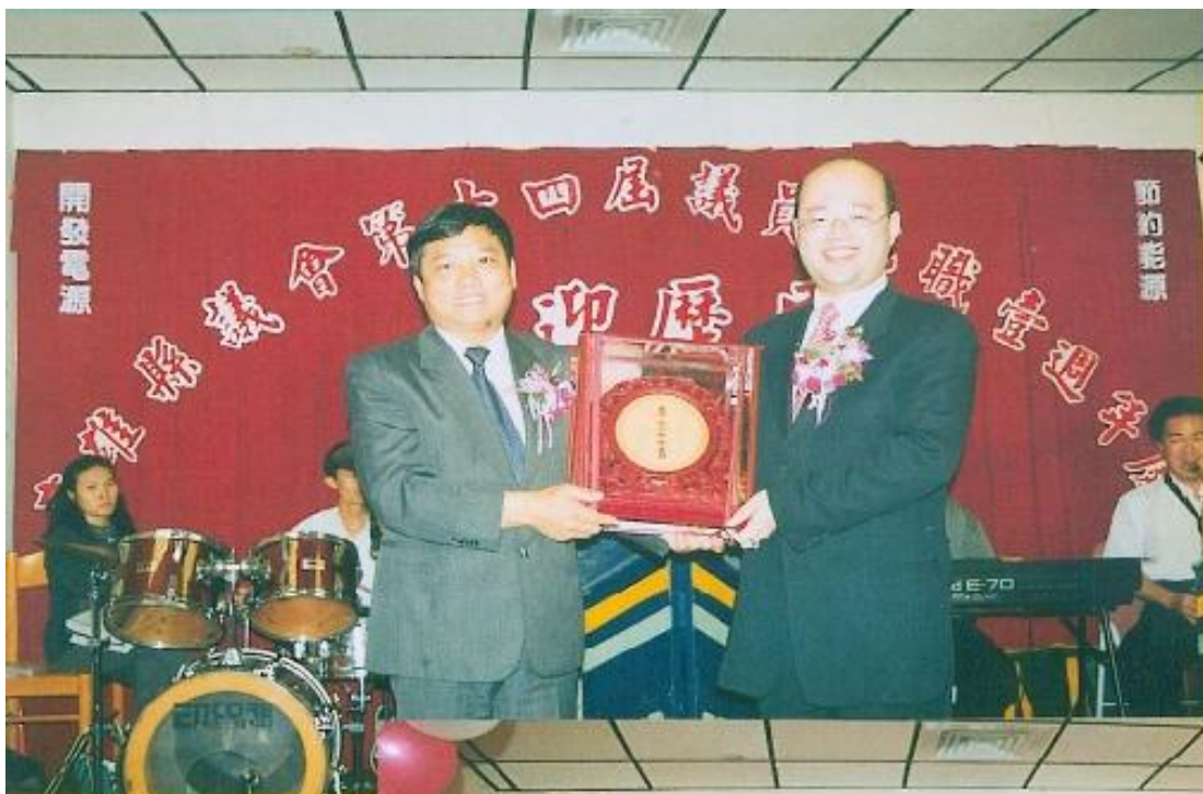
發 員 名 。 頒 議 一 文 獲 第 一 名 。 重 榮 榜 第 一 名 。 黃 勵 行 徐 榮 榮 。 長 鼓 排 員 議 。 議 牌 席 出 的 副 獎 出 的 副 獎 出 的