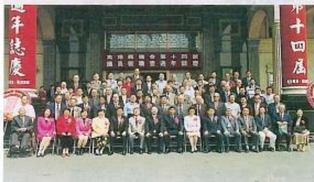
▲第十四屆議員就職典禮壹週年於議會前合影留念。