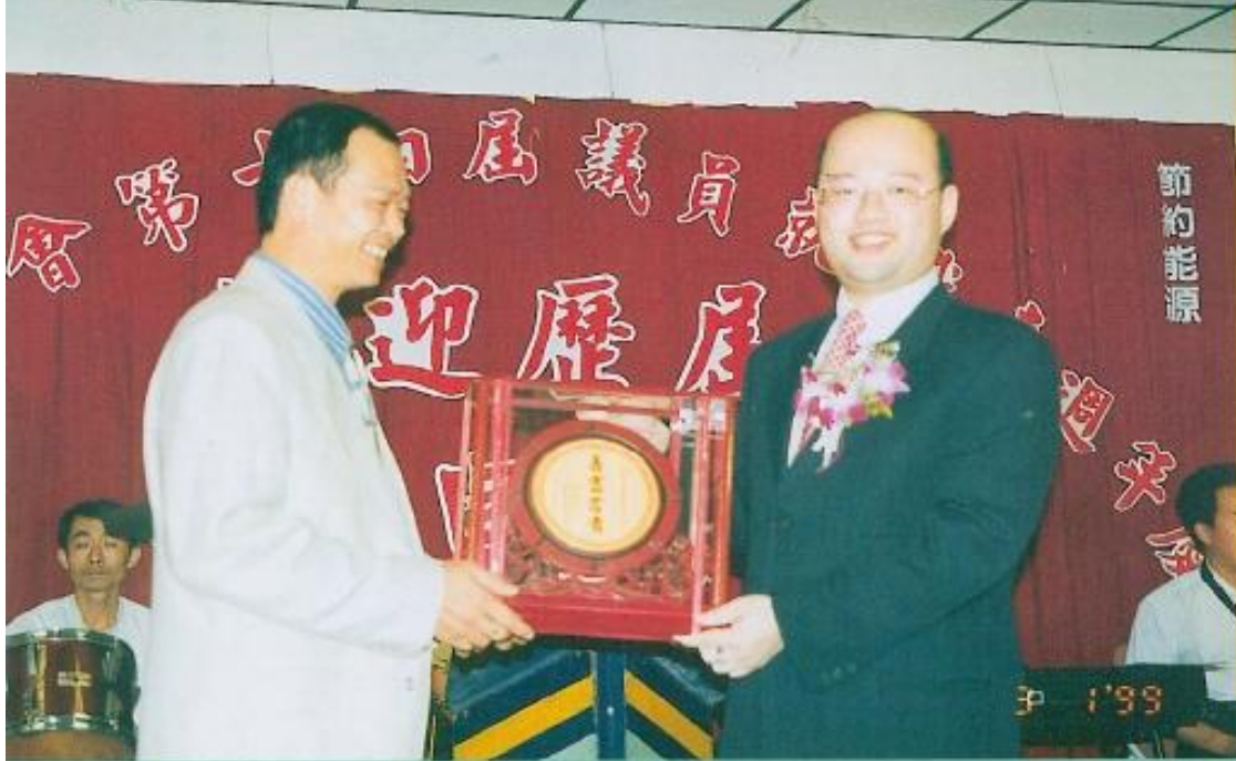
發 員 名 。 頒 議 三 文 獲 第 三 名 。 重 榮 榜 第 三 名 。 黃 勵 行 徐 榮 榮 。 長 鼓 排 員 議 。 議 牌 席 出 的 副 獎 出 的 副 獎 出 的