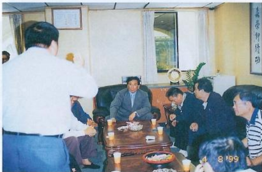
▲茄萣鄉民就興建焚化爐事宜向許福森議長陳情。

縣議員葉發機則認為好不容易爭取來的經費，一旦放棄非常可惜；而議員葉香也指出，原本茄萣民衆也是反對設焚化爐，是民意代表不斷溝通，大家的態度才轉變，如今卻遭環保局反對，實在令人不解。原本丁杉龍態度相當堅持，但在許議長和多位縣議員要求下，同意將補助款先辦保留，並儘速邀請兩鄉所會首長、縣長余政憲及地方議員們召開兩鄉的協調會，以免垃圾問題無法處理。