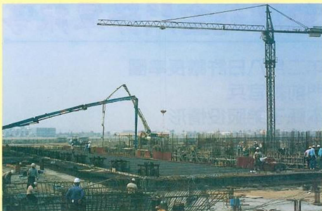
◀正在施工的 本洲焚化爐， 至二月底， 總體工程 進度為25.2 %。