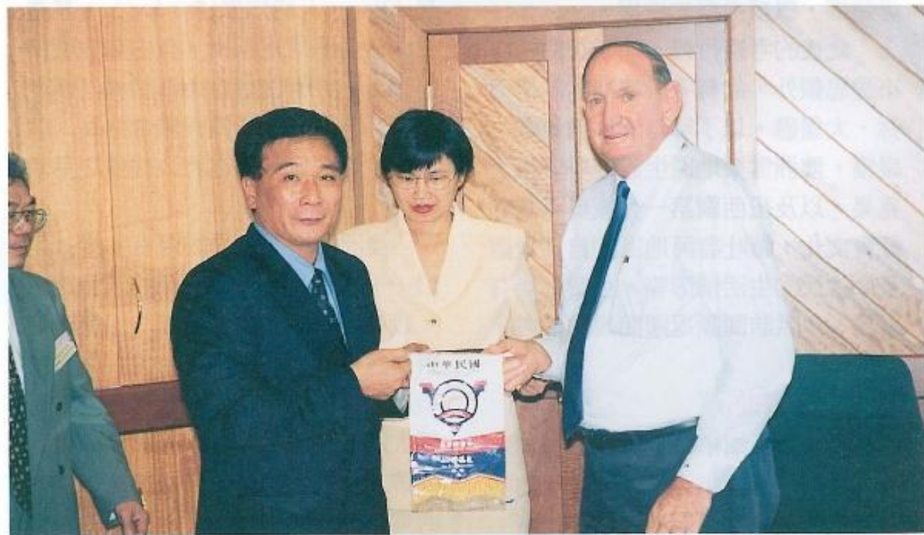
▲ 議長許福森與愛思頓郡長金·查普曼(右一)交換紀念錦旗。

紐西蘭的國家公園、森林公園、保留地、保護區、公園綠地等面積約佔其國土的兩成，可以說是一個非常重視生態環境維護的島國。對於美麗的天然景觀，如熱噴泉、大瀑布、螢火蟲洞、蟻巢等均予列入保護。在紐西蘭的住民，家家戶戶都有花園，庭院修剪、花卉栽培是正常的日常活動