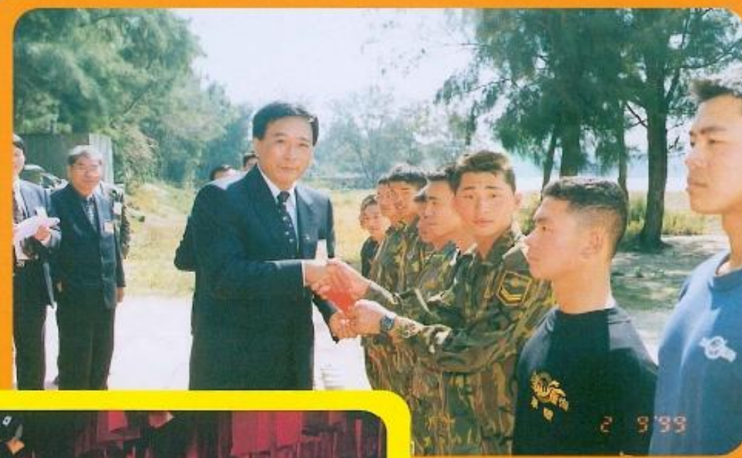
▲ 議長許福森新春期間赴金門 慰勞子弟兵。