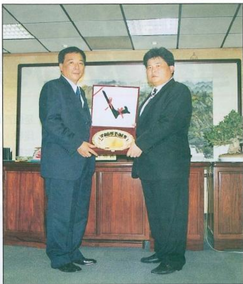
▶ 本會議長許福森與台中縣議會議長顏清標交換紀念品。

許議長並陪同台中縣議會顏議長一行參觀本會議事廳等多項硬體設施，並於議會大樓前合影留念後轉往高雄市議會訪問，結束本會的參訪行程。