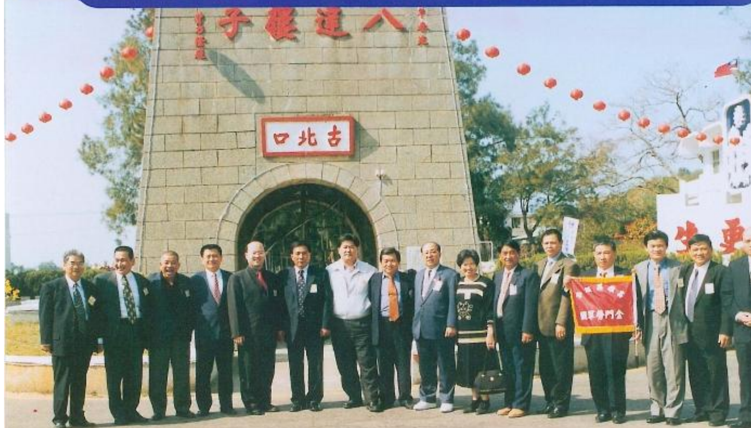
▲ 本會金門勞軍團於金門八達樓子合影。