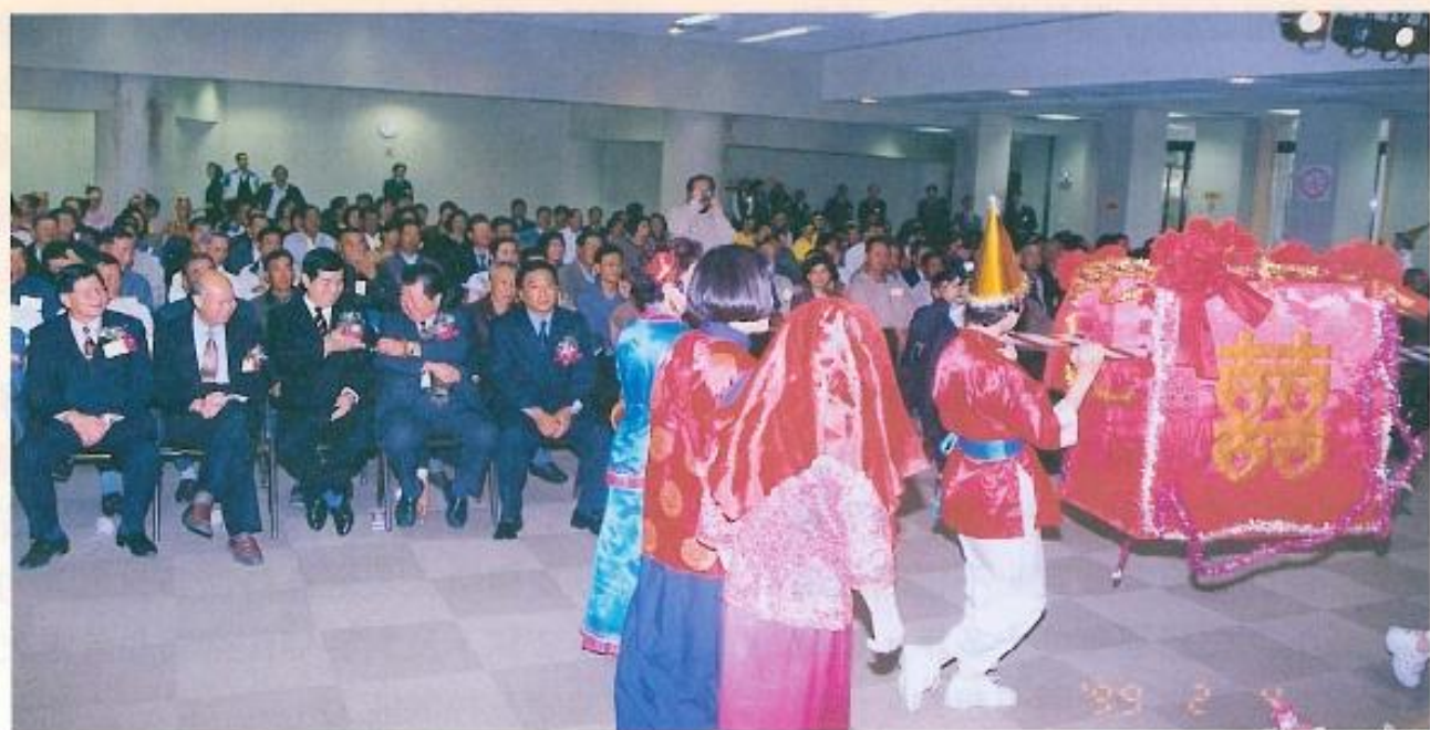
▲慶祝農民節特別節目。

助父親從事農務工作，對於農民的辛勞頗能感同身受，而今早期的農業生態將轉型進入工業社會並受到國際貿易協會的監督，未來勢必將對農業帶來一定的衝擊。為了因應這個趨勢，本縣應儘早擬定農民優惠政策，全力協助農民渡過難關。