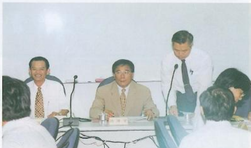
▲本縣為保障縣民安全，設立消防局。

葉吉堂局長則表示，本縣轄區遼闊，各類災害頻傳，成立消防局後，消防人員有更多資源來救災、救護，縣民可獲得更大的生命及財產的安全保障。