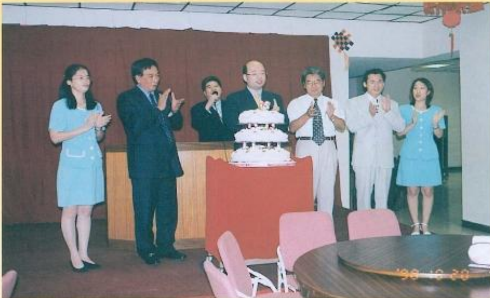
◀ 本會舉辦慶生會為 工慶生。