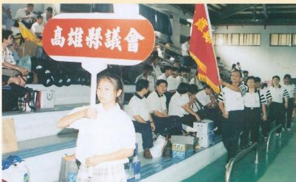
◀ 本會桌球隊參加台 第二十五屆民政盃 賽。