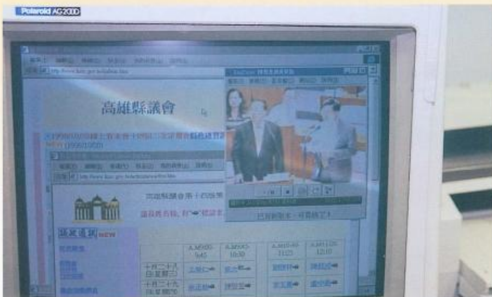
◀ 第二次定期大會總 詢，實況已在網路 全程轉播。