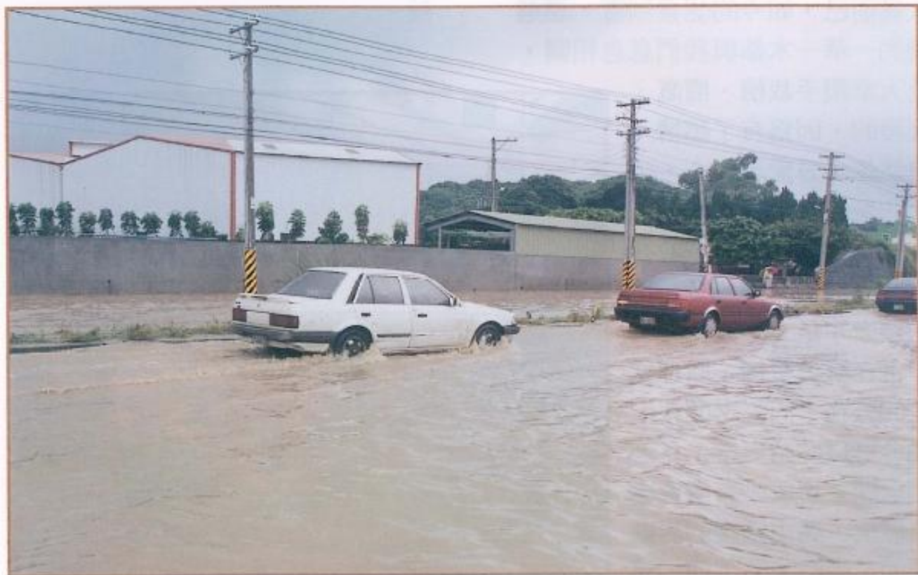
▲每逢豪雨，岡山地區就因排水系統未發揮功用而積水。

本縣岡山地區三大河川，其整治工程逾時兩年多時間，原定今年八月底完竣的土庫排水系統，因受變更都市計劃作業延宕和用地範圍內地主阻擾查估無法配合影響，工程進度嚴重落後。高雄縣政府建設