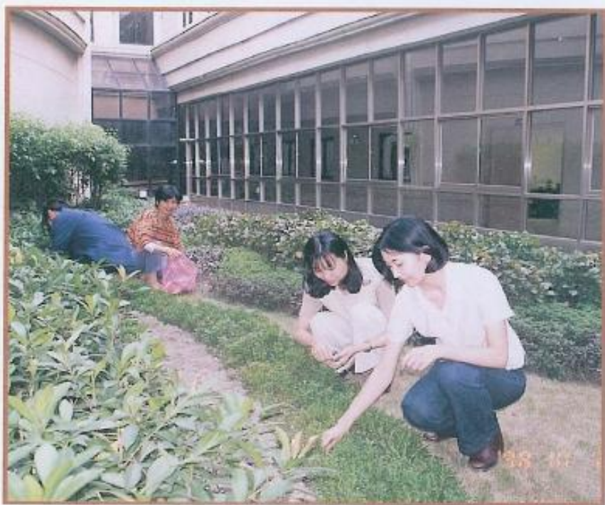
▲本會員工修整認養園區花卉。

除了推動本會的美化及綠化工作，更希望拋磚引玉，以帶頭的示範作用，讓民衆了解環境保護要從自身做起，唯有人人將環保都當作自己的責任，我們才能擁有一個美好的生活環境，爲了我們自己，也爲了下一代，人人都應責無旁貸的肩負起這個責任，「前人種樹，後人乘涼」的時代意義，藉此源遠流長。