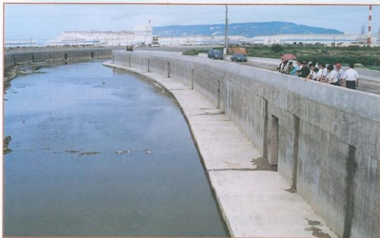
▲ 岡山地區民眾一直期待土庫排水工程能盡速發揮其應有的作用，使岡山不再成為水鄉澤國。

土庫排水整治工程，分六段七個工區，第一段及第二段位於都市計劃區內，因原區段內河道規劃為五十公尺，僅符合通水斷面在設計方面無法增設防水道路，但沿線百姓要求必須增設，乃專業辦理都市計劃變更作業，並於八十七年二月復工施作。第三段已發包，但因地上物補償及工廠拆遷問題而延誤，第四段及第五段已完工，第六段第一工區及第二工區目前已完工。