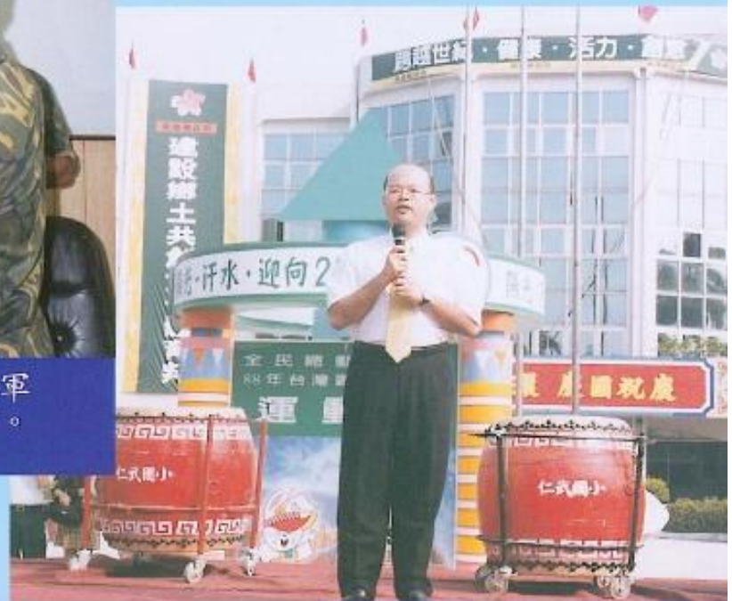
▲ 副議長黃璽文於國慶日升旗典禮上致詞。