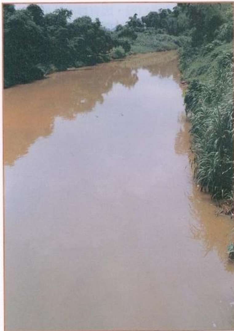
▲ 典寶溪除了無法完整發揮疏通雨水的功能之外其受污染的程度也是一個需重視的問題。

至於造成岡山地區嚴重水患禍首的土庫排水整治問題，高雄縣政府建設局長林琦瑞坦承表示，目前第一段及第三段涉及四家工廠對補償經費異議因而牴觸施工，和受變更都市計劃作業耗時影響，原定今年八月底全線整治工程完工將被迫延後，預定明年二月底前能完工。