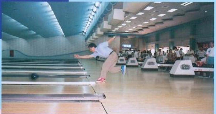
▲ 本會舉辦的保齡球大賽由許議長開球。