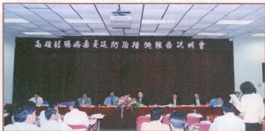
▲為防止腸病毒在高雄縣內肆虐，本會特別舉辦說明會。

不論如何，如何能有效抑制疫情繼續蔓延、防範未來應是最重要的議題，議長許福森也再一次地呼籲家長、學校多鼓勵幼童加強個人衛生勤洗手，加強居家環境衛生及通風，預防腸病毒的侵略，必能安然度過這次腸病毒風暴。