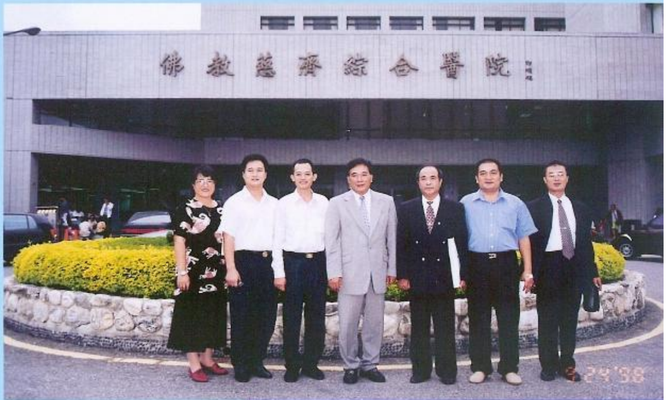
▲ 本會許議長及議員訪問慈濟醫院