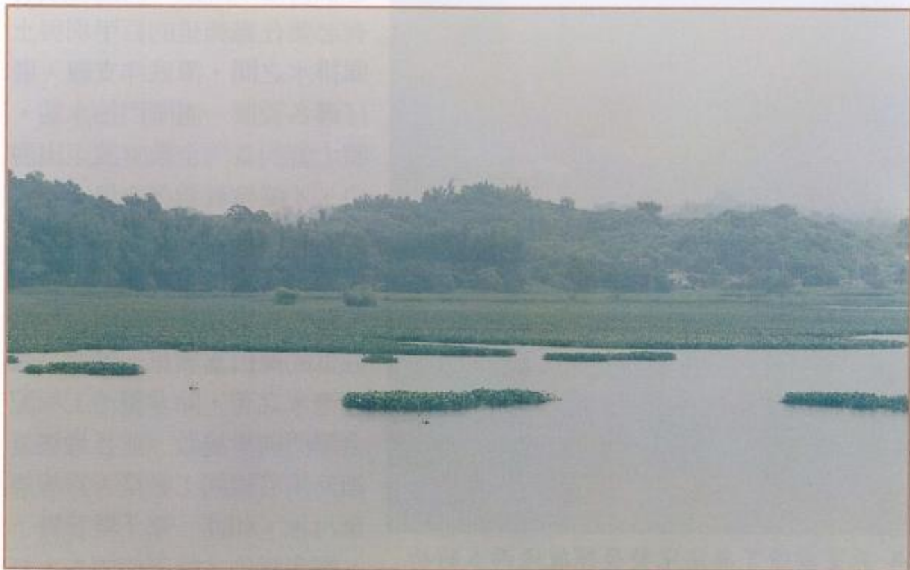
▲ 阿公店水庫與阿公店溪調節了高雄縣市的水資源。

典寶溪自梓官鄉之台灣海峽出海口至橋頭鄉境內國道公路止，全長十五點八四公里，預計分四個年度執行，總經費高達四十億元。但是第四段第二工區從長潤橋至大遼排水出口段，因有燁隆及燁興公司經過規劃路線問題涉及龐大補償經費，其處理事件目前陷於膠著狀態。第六段位於內政部營建署執行的高雄縣橋頭新市鎮開發計劃內，並