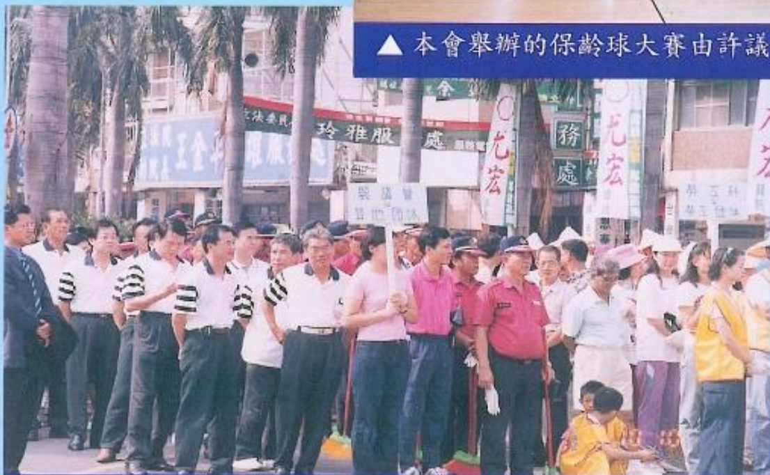
▲ 本會同仁參加今年國慶日在高雄縣政府前舉辦的升旗典禮。