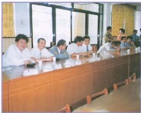
▲ 本會議員在八軍團勞軍並交換意見。

許福森議長更指出，國軍除了平日堅守崗位的辛勞外，於公益活動上之配合與為民救難、救援的精神更是可佩。例如：本會日前於三山～鳳山、岡山和旗山地區所舉辦之大型宣導反毒反飆車的飆舞活動，用意深遠地希望宣導現在的年青人應在正當娛樂上享受生活，而不是在煙毒、飆車的肆虐中無能為力。而正值璀璨年華的國軍弟兄們也熱心支援、協助宣導，以自我為範。再者當岡山嘉興地區嚴重水患，造成許多民衆家園、家當於水鄉澤國之中時，國軍弟兄們亦率先肩負起協助岡山嘉興地區民衆搶救並重建家園的先鋒部隊，由於駐軍弟兄們的極力配合，奮不顧身地搶救、支援下，使得嘉興地區居民們可以