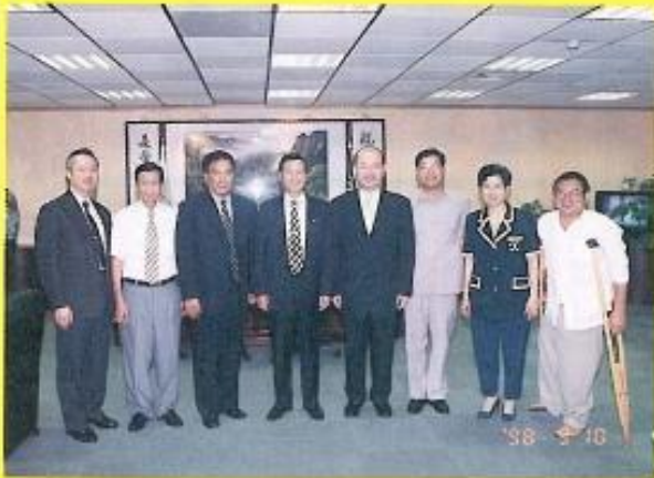
▲ 行政院消防署陳署長蒞會訪問，並與議員們合影留念。