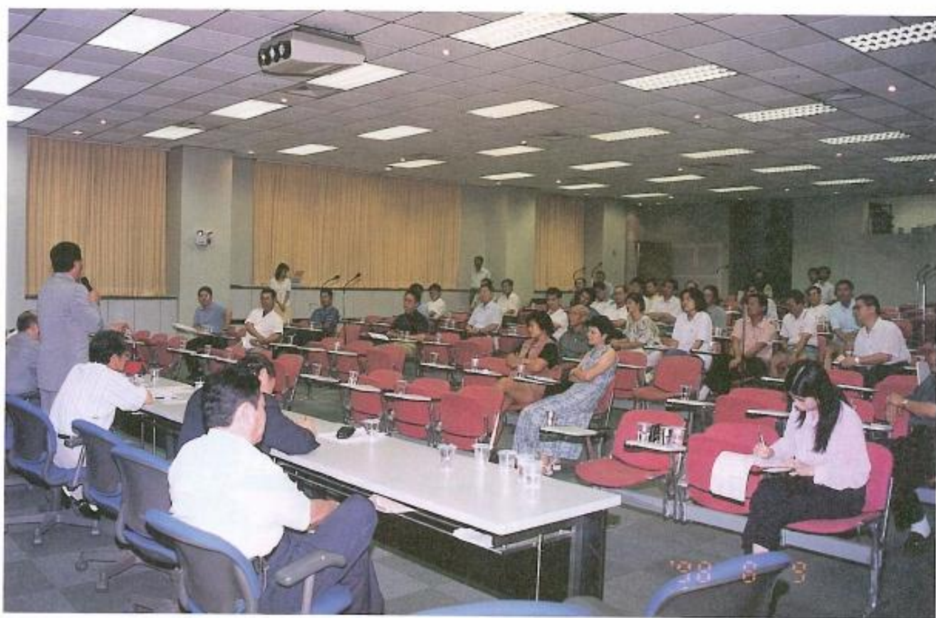
▲ 在許議長及議員們協調下，住戶與業者取得共識。