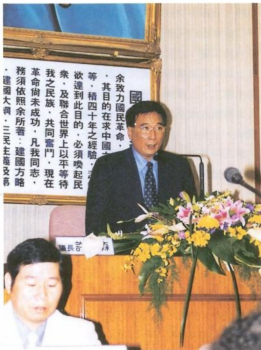
▲許議長於第十四屆第二次臨時會主持開幕典禮。

本會議員認為，自來水公司供應的水質，藥水味重，口感較差，民衆沒有信心，所以南部地區百姓，都購買桶裝礦泉水飲用，如果自