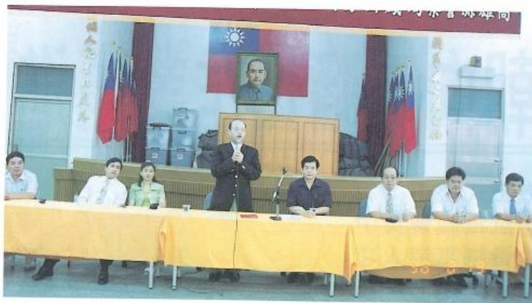
◀ 副議長黃璽文對鳳山打表許文對員警犯罪現狀及非常肯定。

贓物寄放於其親屬及同案嫌疑人代為銷贓，於今年七月二十六日在鳳山市的工協新村市場向攤販銷贓時，被機警的被害人發現，認為事有蹊蹺，立即向鳳山市警察局刑事組報案，經深入追查後，查獲一干嫌疑人並起出大批贓物。初步估計全數贓物價值約為新台幣柒佰萬元以上。