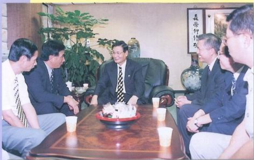
◀ 行政院消防署陳署 蒞臨本會訪問。