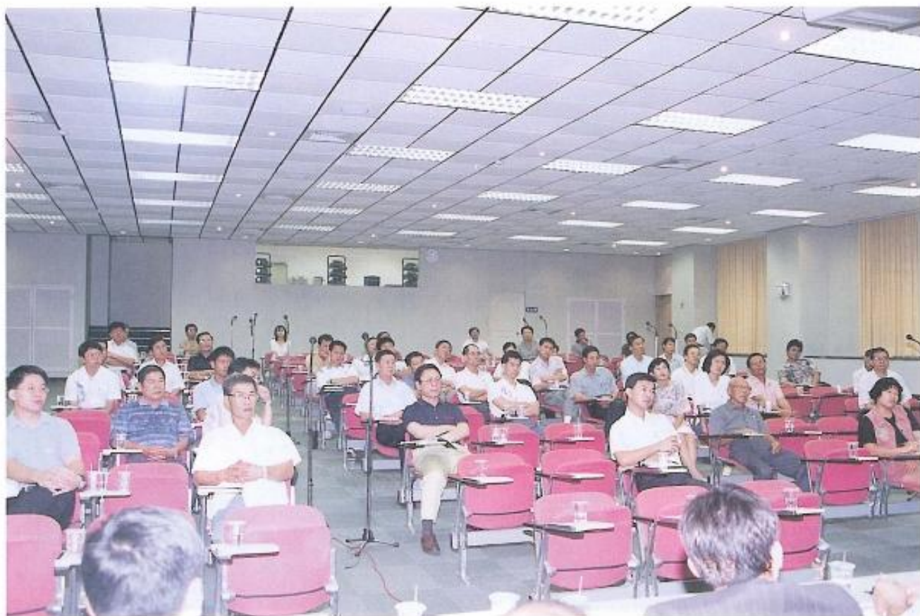
▲ 鳳山市大樓住戶管理委員會主任委員均出席公聽會。