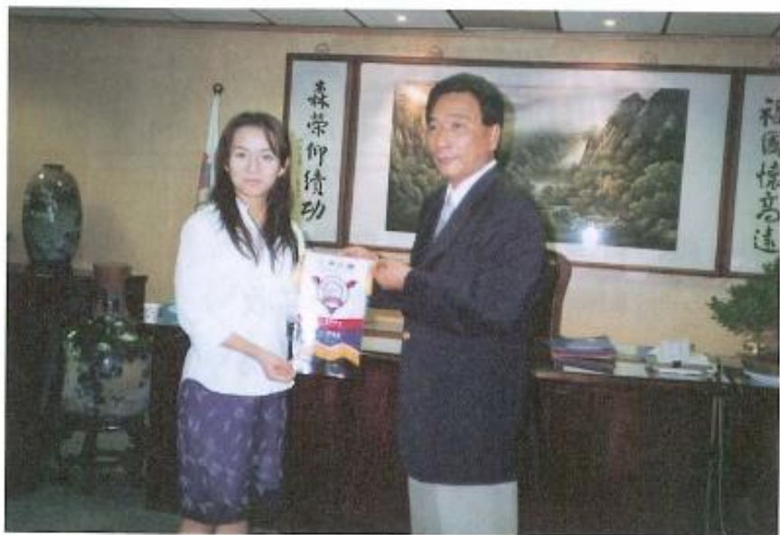
▲ 爲了歡迎日本青年學生的來訪，議長還親自一一頒發本會的小錦旗給學生們。

由於目前中華民國政府與日本並無正式的官方往來關係，因此中日雙方的交流，非官方的往來關係扮演了極重要的角色，本會在許議長的領導下，無論是締結姊妹縣或是促進與友邦的情誼，一向是積極