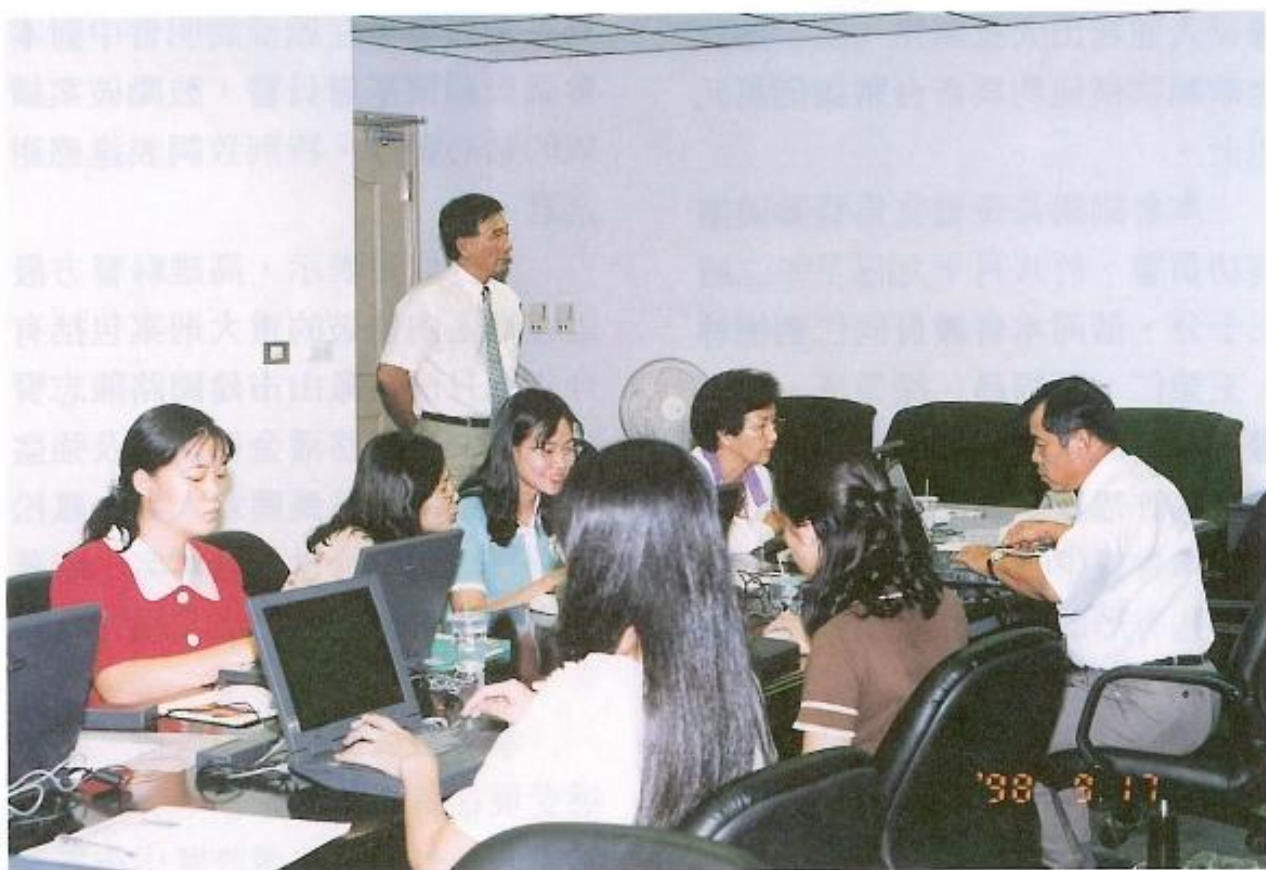
▲ 許議長非常關心本會的內部電腦操作教育訓練課程。