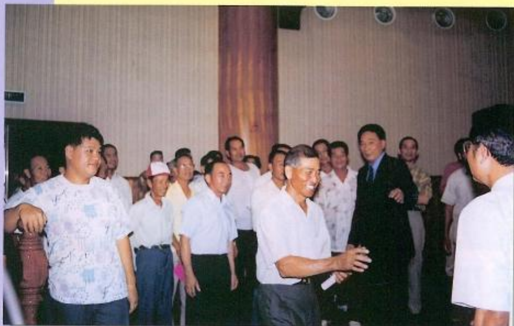
◀ 許議長非常親切地帶領民眾參觀本會。