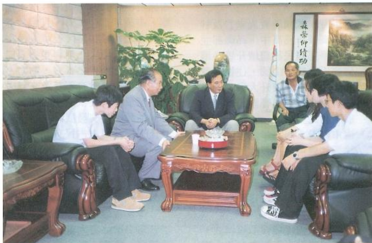
▲ 日本青年學生們聆聽議長介紹本會。