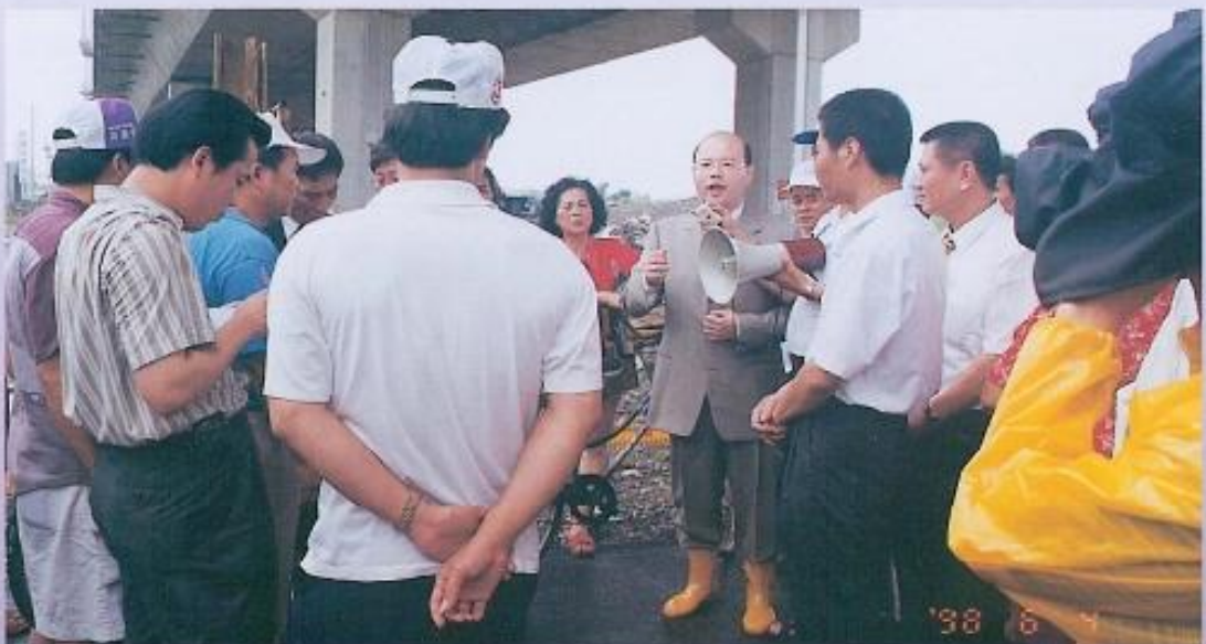
▲黃副議長在聽取民眾的陳情後，大聲疾呼，整治水患刻不容緩。