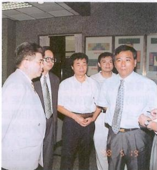
▲許議長爲直接瞭解民瘼，特於本會一樓大廳右側設立「民衆服務中心」，受理民衆陳情委託案件已達兩百餘件，各界均極爲讚許。

本會創全省先河成立的「民衆服務中心」，積極發揮「爲民喉舌」的功能，直接與民衆面對面接受陳情，深獲好評。議長許福森表示，以該中心作爲民衆與縣府間化解紛爭的橋樑，充分發揮議會的團隊精神，並進而達到善盡監督的職責，對於「民衆服務中心」所能發揮的功能，持相當肯定與樂觀的態度。