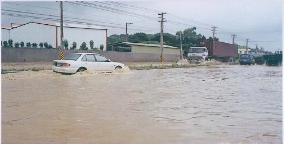
▲岡山鎮宛如水鄉澤國，交通被迫中斷，汽車行經，險象環生。