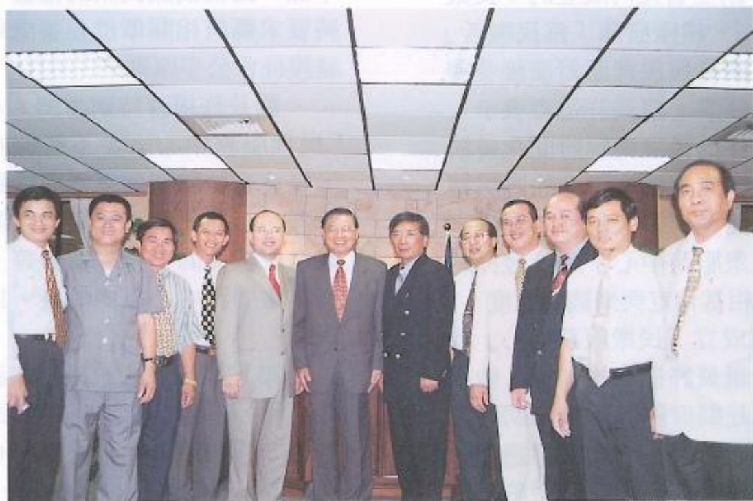
▲江主委在聽取議長及議員們的建言後表示，經建會將會努力和相關部會協調，並與大家合影留念。

江主委坦承，中央確實有很多事務需要重新整合，對於河川整治，將擬定規劃一元化水利機關，成立專責管理局，俾提升行政效率。他同時對諸多議員提出的建議案，表示會帶回經建會，努力與相關部會協調。不過，目前各部會向經建會提出的建設經費每年共二千八百億元，主計處僅同意給一千四百億元，所以將來地方建設會有優先順序，高縣提出的建設案將拜託相關部會優先列入計劃，屆時他與各部會協調的時候，希望地方能派員參加。