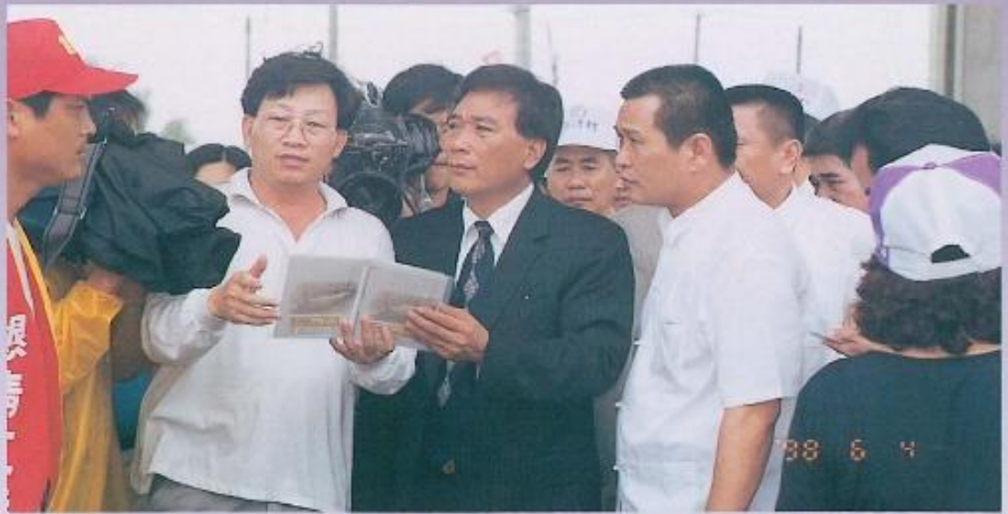
▲許議長面色凝重，在水患現場聆聽簡報，對於縣民生命財產遭受威脅，深表難過。