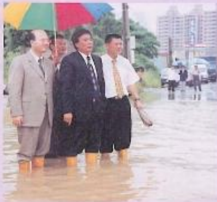
封面說明：許福森議長巡視岡山鎮水患災區