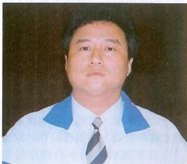
面對縣府下，對空污問題關注，質