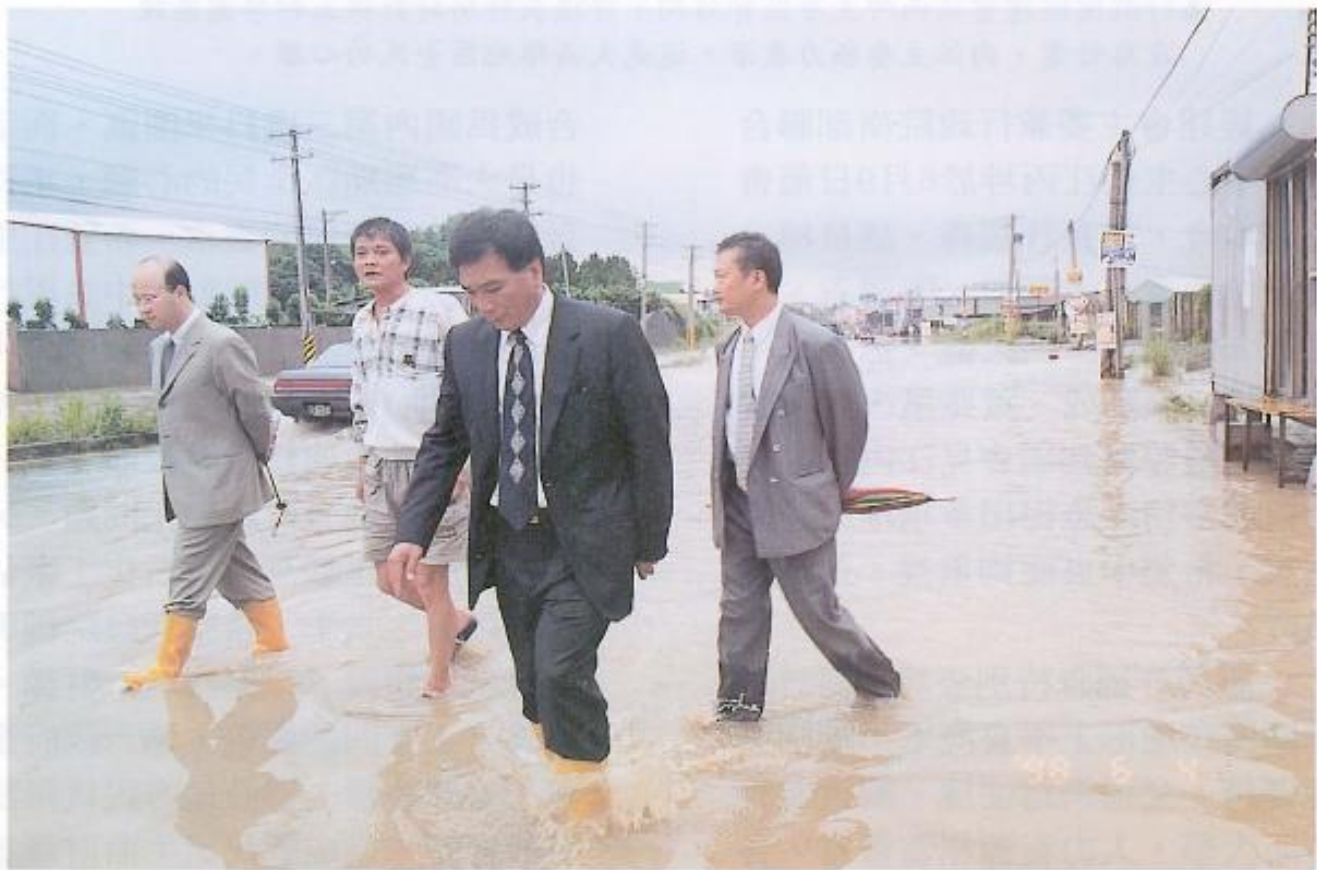
▲雙腳踩在水裡，議長及副議長均舉步維艱，感同身受，焦急之情，溢於言表。

希望明年雨季再度來臨時，大家不必再擔心有水患，而是沏壺好茶，與親愛的家人就著雨聲話家常，窗外是美麗的雨中夜景，心裡是喜悅和樂——。