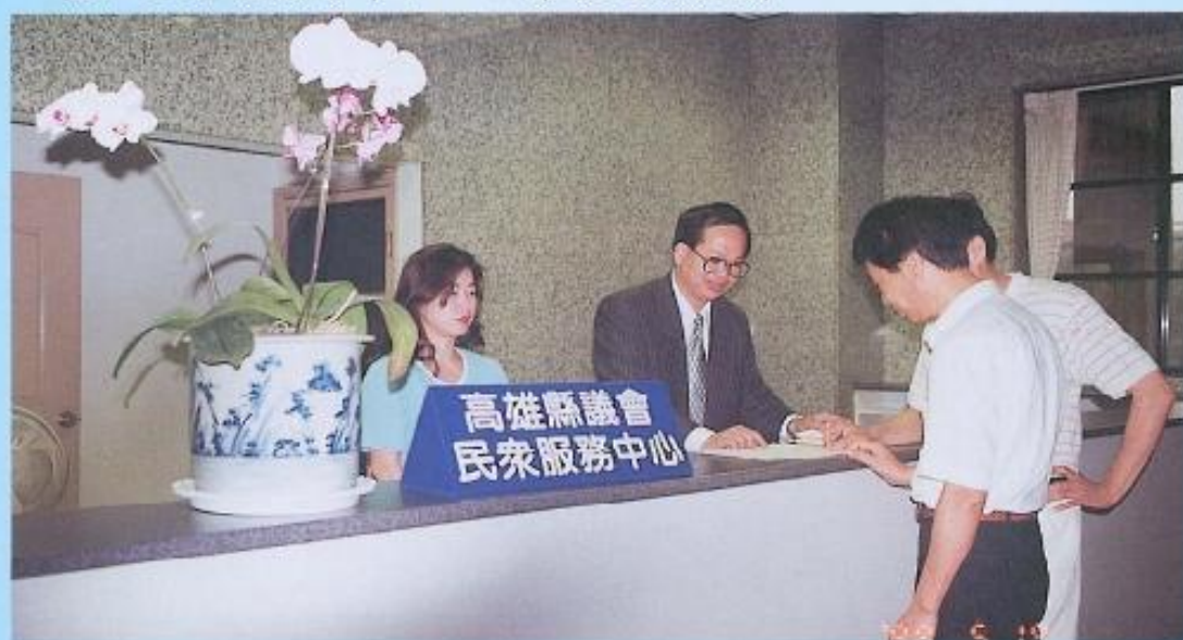
▲本會「民眾服務中心」，已成為民眾與縣府之間的溝通橋樑，將更落實本會為民服務的工作。