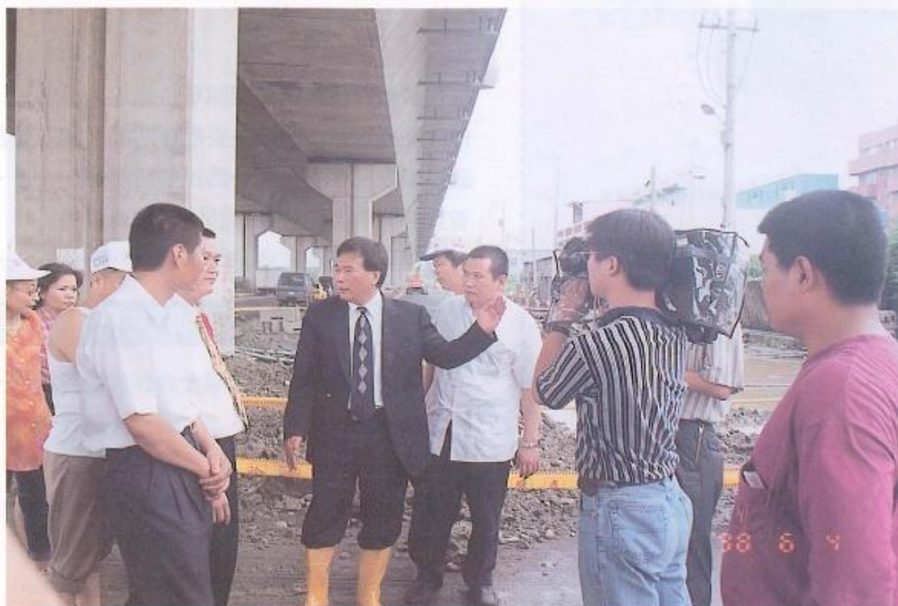
▲許議長巡視災區，對於嘉興里有一份特別情感，為居民的處境，深表痛心。

六月九日前往岡山鎮嘉興里探視水患災區，穿著雨鞋，站在水深及膝的一片汪洋中，內心真有說不出的難過。政府保障人民生命財產與身家安全是天經地義的事，如今眼見水鄉澤國的景象，鄉親不得安居樂業，整治水