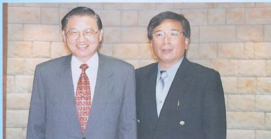
▲江主委與許議長相談甚歡，交換許多關於地方建設的意見，希望江主委能協助爭取，以繁榮地方經濟。