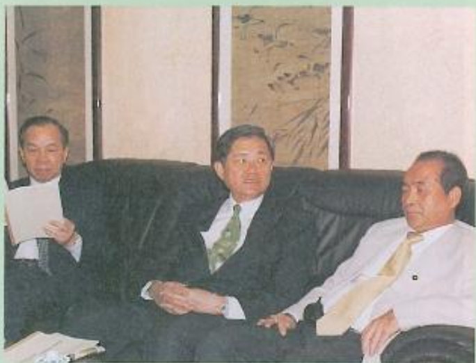
▲監委們凝神傾聽許議長及議員們有關縣政各項建言。