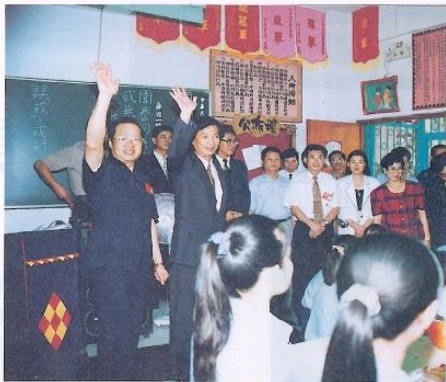
▲陳議員熱心公益的個性，常常獲得民眾的肯定與支持。

得曾經受過他幫忙的民眾，紛紛站出來替他拉票，陳議員因而踏進了議會之門，一直到今天每逢選舉就有許多朋友自動出來幫忙。