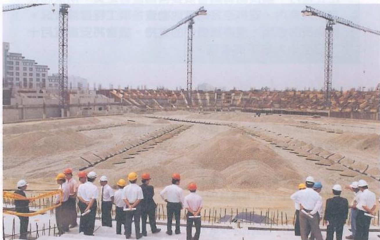
▲為了確實掌握縣內各項重大工程的執行，議員們都親自下鄉考察以利工程的推動。

本會這次定期大會將安排五月十二日至十九日，赴縣內參觀多處重大工程建設，包括有林園石化工業區、省自來水公司第七管理處、鳳山水庫、仁大工業區、興達火力發電廠、中油液工處、旗山孔廟、農民休閒中心、客家文物館、新威苗圃、巨蛋棒球場、仁武焚化爐及岡山本洲工業區開發工程等。