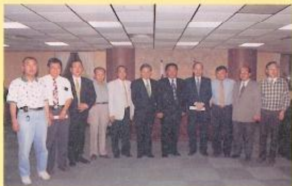
封面說明：監察院謝孟雄委員、葉耀鵬委員蒞會訪問與議長及議員們合影留念