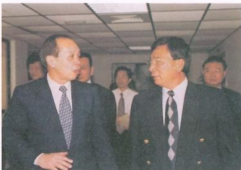
▲議長向監委陳情建言，監委同意列入專案瞭解。