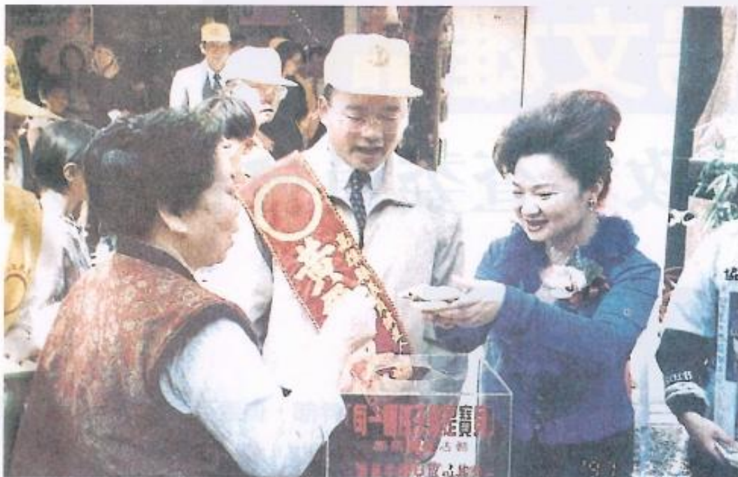
▲黃副議長相當關心兒童福利問題。

但在二年前經鄉代會議決通過全面終止觀音山鄉產的租賃關係，並決定於四月將其中的慈德育幼院全部拆除，至於該院目前收容的四十九名貧困或單親孩童，橋頭鄉公所有意協助將孩童分發至其他公立育幼院扶養。