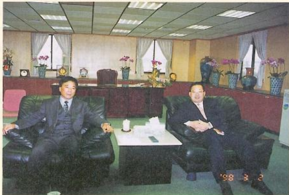
▲許議長及余縣長攜手合作 為高雄縣創造更美好將來。