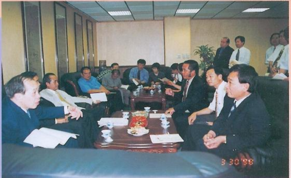
▲監察委員蒞臨本會，本會議員並且就高屏溪整治工程，反對荖濃溪及楠梓仙溪越域引水供應南縣工業區使用、旗山中華路住戶編為行水區、鳳山溪下游出海口嚴重污染等陳情案向監委建言陳情、監委同意列入專案瞭解。