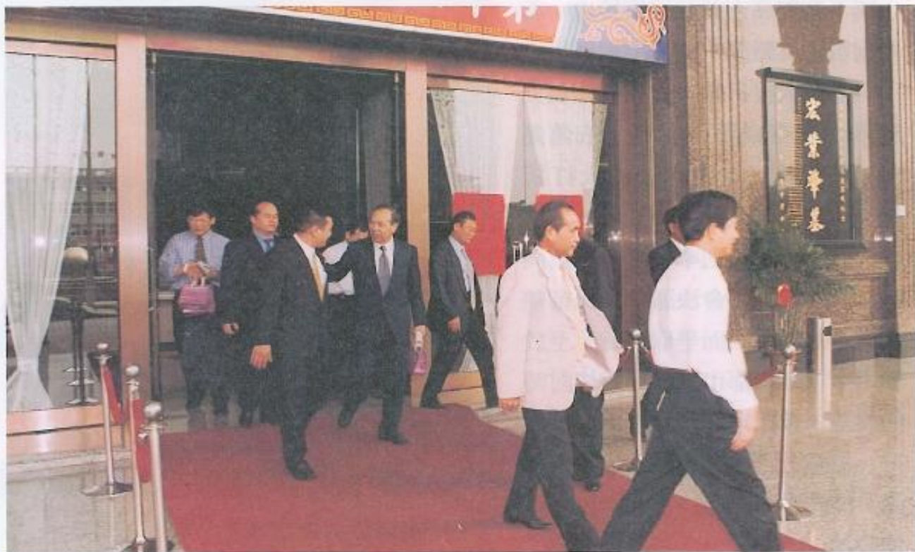
▲議長及議員們歡送監委們離開議會。