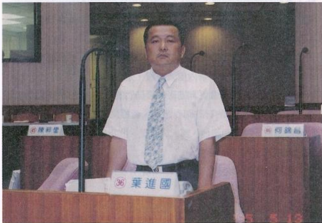
▲葉議員相當重視環保問題。

這次葉議員再度高票當選，就表示選民多麼肯定葉議員的做人、做事。葉議員表示，歡迎大家到他那裏泡茶，或者找他服務，他隨時歡迎大家前往。