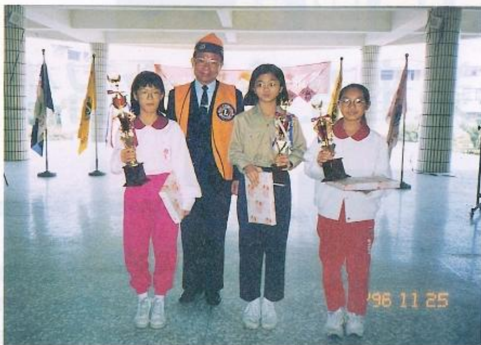
▲曾任大社鄉獅子會會長的許議員非常重視國民基礎教育。

神病患的照顧有一定的程序，設立許多醫院或養護所安置精神病患，在經過醫生的證明後，給予妥善醫療或是個案輔導。反觀台灣社會對於精神病患的照顧幾乎接近於零。而這些沒有受到照顧的精神病患往往就會變成社會問題。不但家屬痛苦。而少數有暴力傾向的病患，更會使社區的民眾受到威脅。