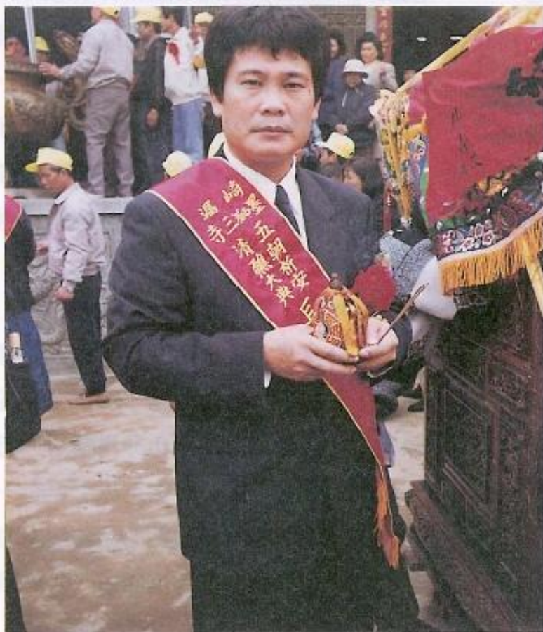
▲ 鄧議員平日積極參與鄉親及里鄰間的各项活動。

鄧議員雖然公務繁忙，但也很重視家庭生活，他有二個可愛的兒子，而鄧議員平日繁忙的問政生涯，使他無法常常陪伴小孩，二個兒子有時也會覺得爸爸留給選民的時間比留給孩子的還多。但聰明懂事的他們，很能體諒爸爸的辛苦。而鄧議員在忙碌問政之餘，偶會攜帶兩個兒子去潛水、釣魚，到郊外休閒一下。潛水、釣魚是鄧議員最感興趣的兩大休閒活動。