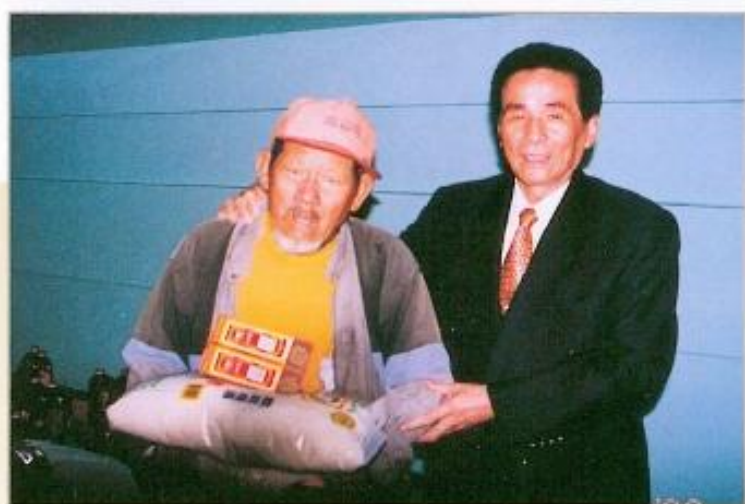
● 黃議長主辦86年度冬令濟貧活動