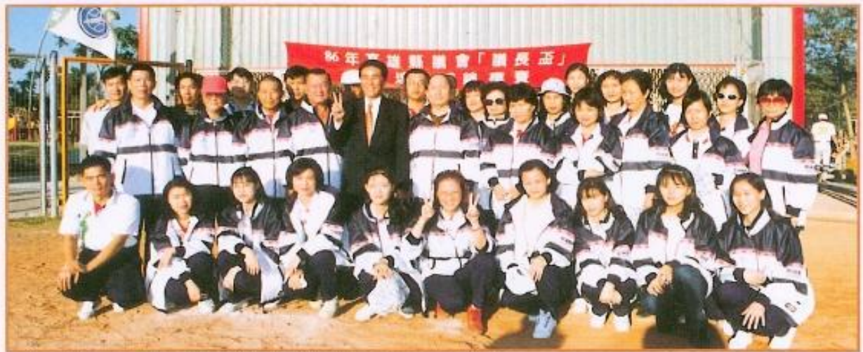
▲ 議長杯慢速壘球賽閉幕典禮，黃議長與議會全體同仁合照