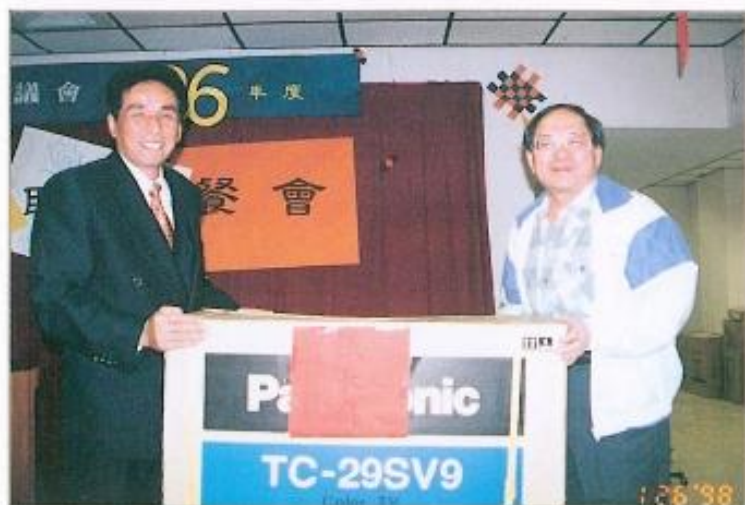
● 本會86年度歲末聯歡餐會