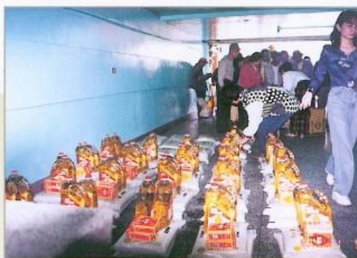
● 黃議長主辦86年度冬令濟貧活動