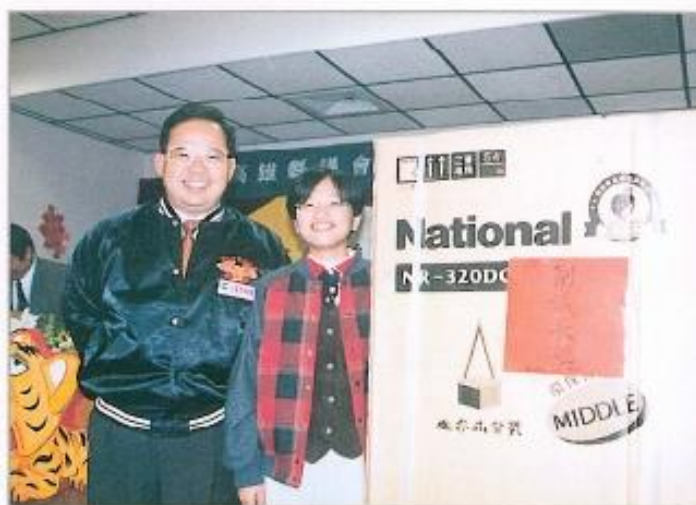
● 余縣長參加本會86年度歲末聯歡餐會