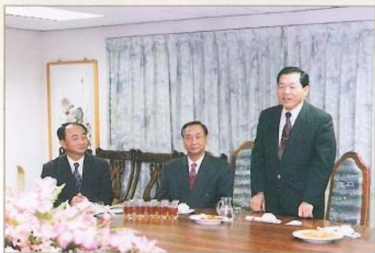
● 87年春節勞軍活動及餐會