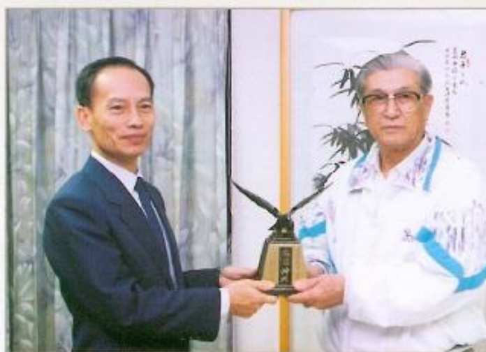
● 87年春節勞軍活動及餐會