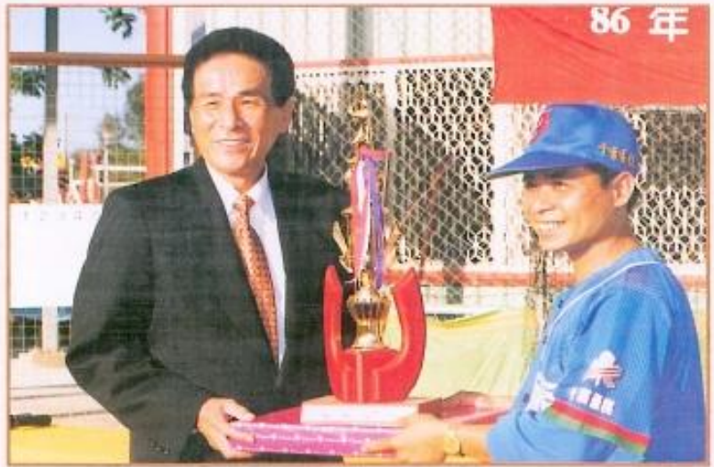
▲ 議長杯慢速壘球賽閉幕典禮，黃議長頒獎給優勝隊伍