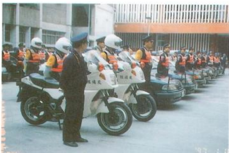
◀縣警局交通隊整裝待發

員警都無法推卸責任，而事權也可以統一，也唯有如此才能解決昔日警方辦案時事權不一與爭功的情事發生，加上要與媒體的充分配合，如果能做到如此，相信要防治重大案件的發生是指日可待的。