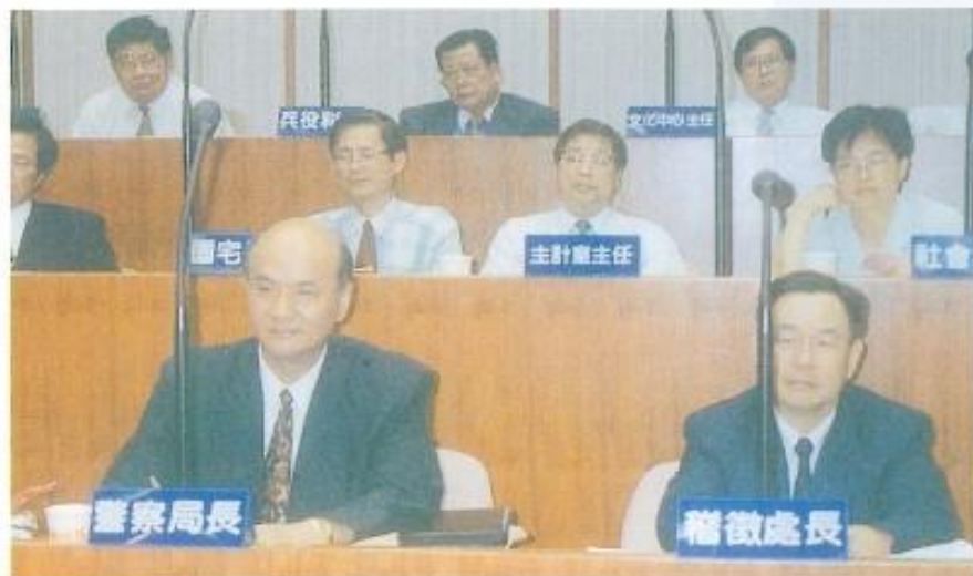
▲ 施志茂局長接受本會議員質詢

社會的問題，葉議員要求施志茂局長對整個高雄縣內治安狀況應充份的掌握，並做全面徹底的檢討，一方面加強訓練以提昇員警的素質，另一方面要針對當前各項問題擬定整套的計劃，確實做好維護治安的工作。