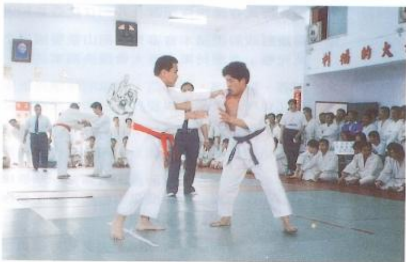
不斷的訓練，才有不斷的進步▶