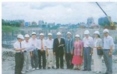
封面圖示/ 黃議長會同本會議員至巨蛋球場實地 勘查