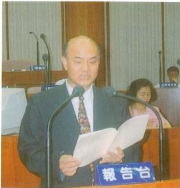
◀ 縣警局施志茂局長至本會作治安工作報告

在治安維護方面：針對案發頻繁時段、地點，不定期實施擴大臨檢，盤查可疑人車；對轄內黑道份子列冊管制，並防止其介入工程進行圍標、綁標；依狀況需要加強巡邏，維護民意代表之安全；徹底清查地下製造槍彈工廠；全面清查易為逃犯隱藏、出入之場所；遴選優秀幹員組成「蒐證小組」，針對黑道幫派展開專案蒐證工證，防止其繼續坐大；加強偏遠地區、市區巷道之巡守，全力檢肅竊盜；加強漁港安檢工作，遏止毒品氾濫危害。