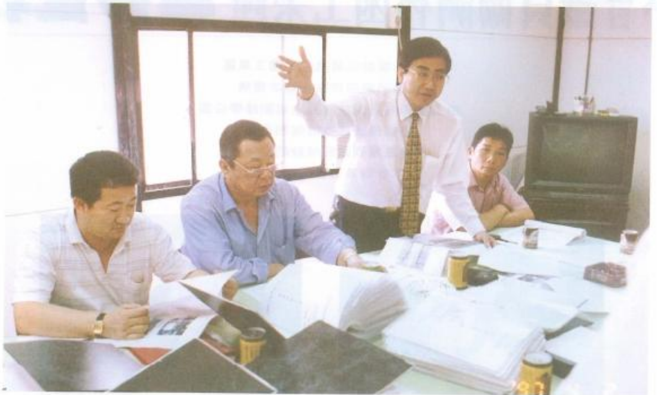
▲本會議員針對球場各項設施提出質疑