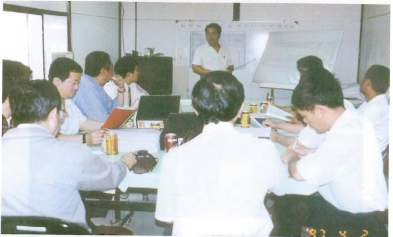
▲本會議員聽取巨蛋球場設施簡報