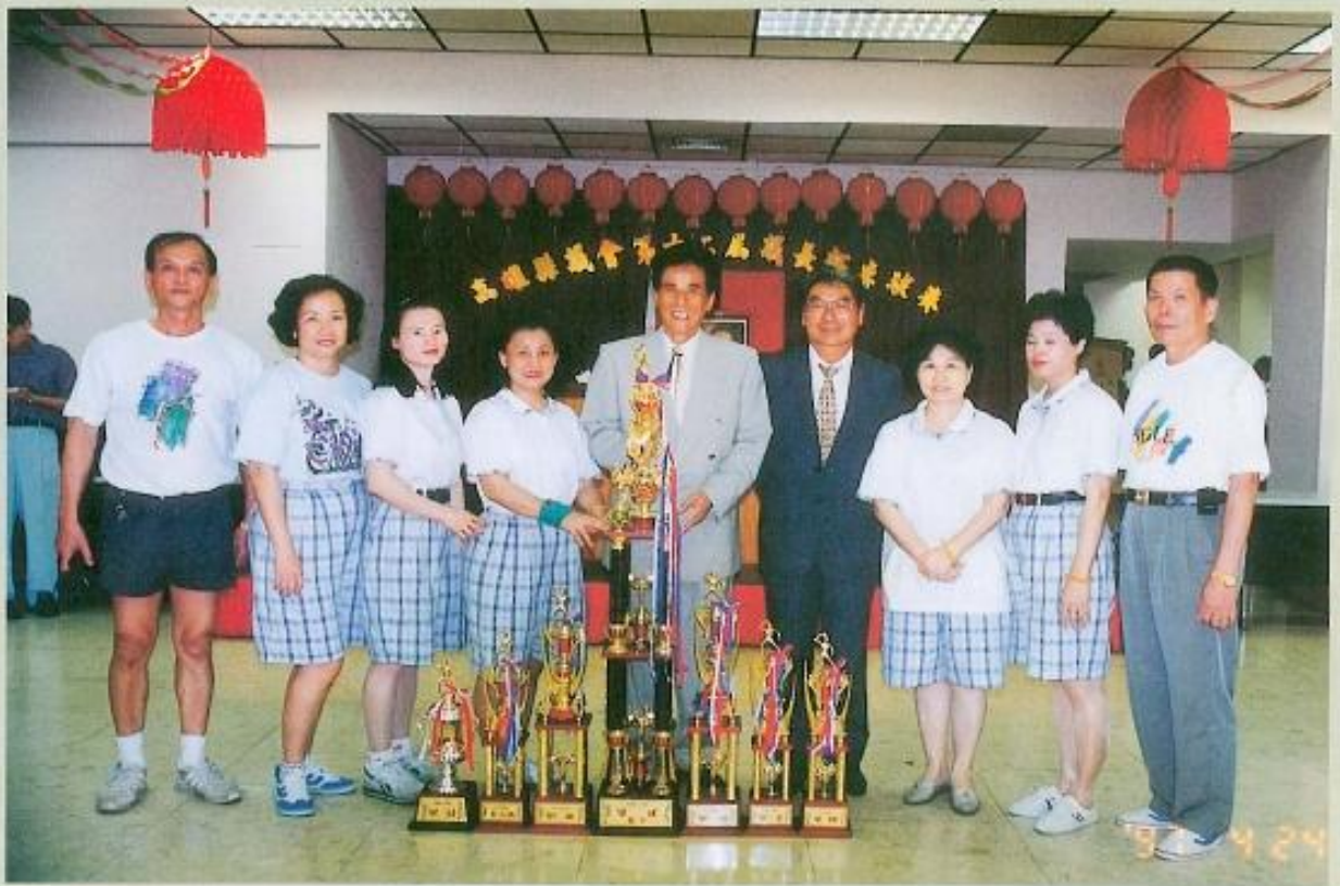
黃議長與本會桌球代表對隊合影