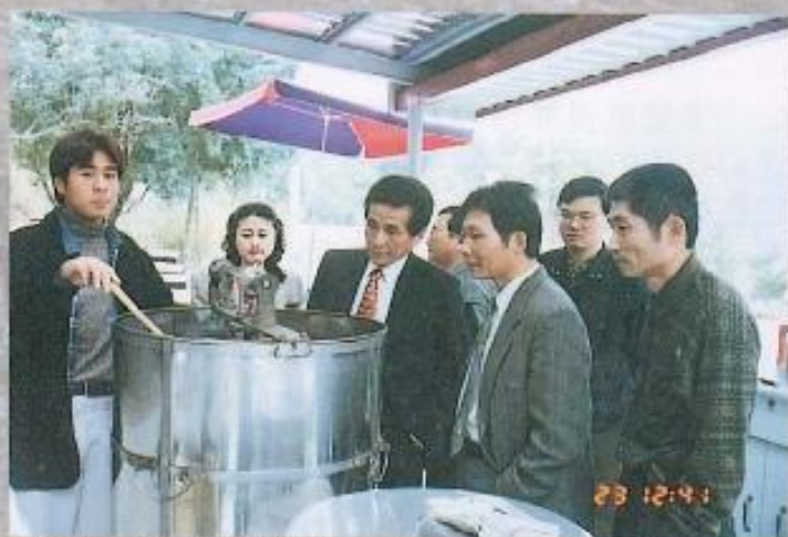
▲東勢林場參觀蜜蜂生態。