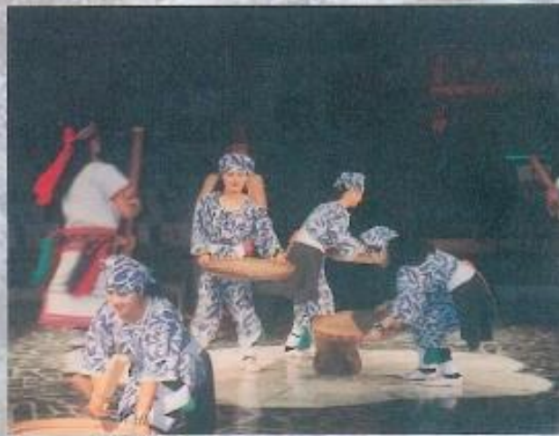
▲至山地文化村參觀阿美族舞蹈。