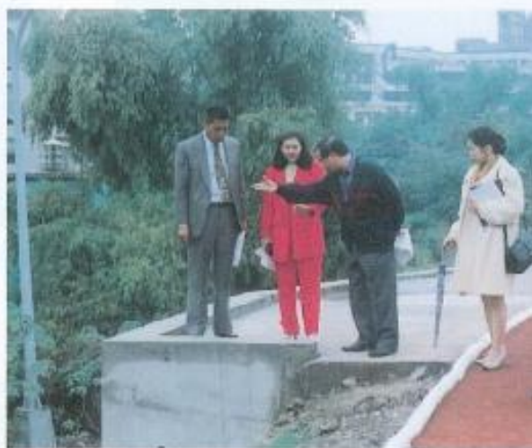
▲ 文山國中運動場南側缺乏護欄，影響學生安全