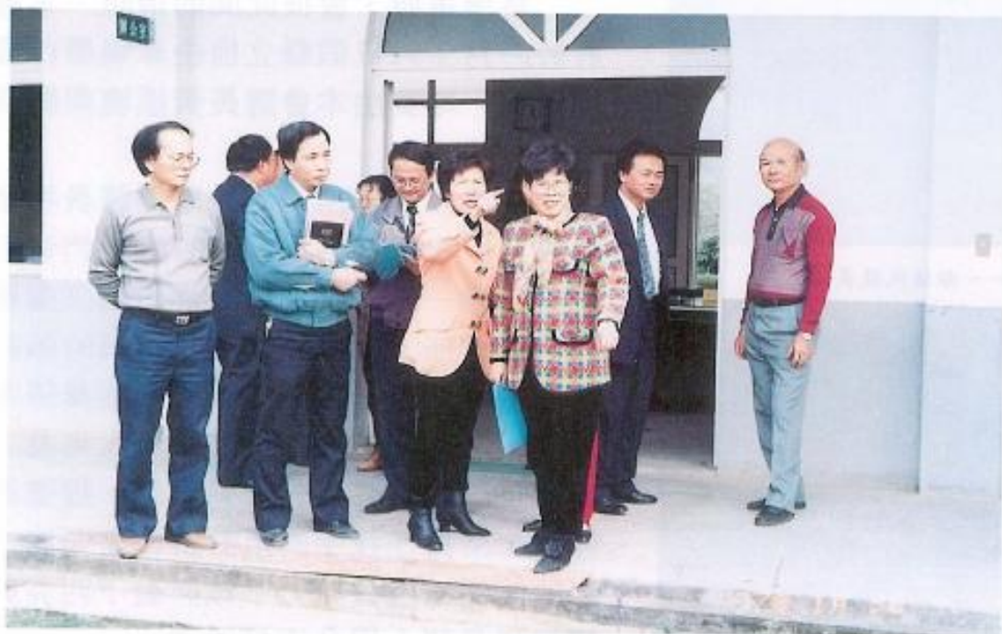
◀本會議員實地了解龍肚國中現況。