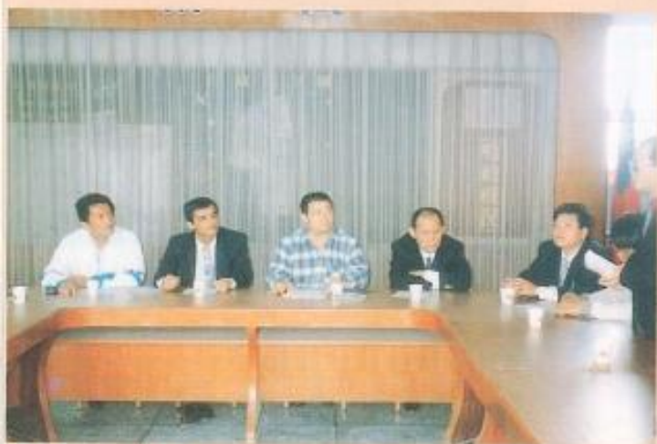
▲大發工業區醫療廢棄物焚化爐調查案。