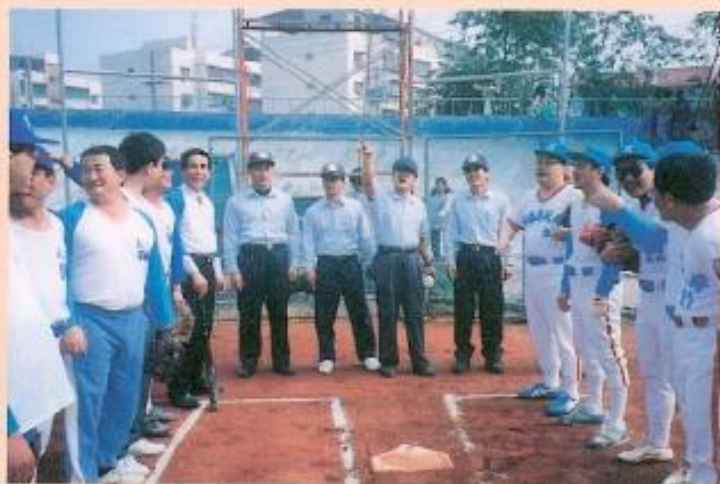
▲本會與縣政府舉行慢速壘球聯誼賽。