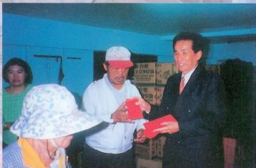
▶ 黃議長希望每個人都能過個好年。