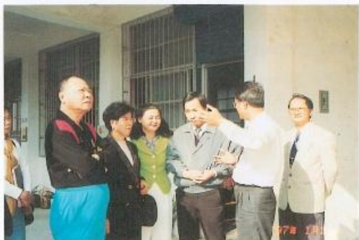
▲本會議員極為重視阿蓮國小崁山分校。