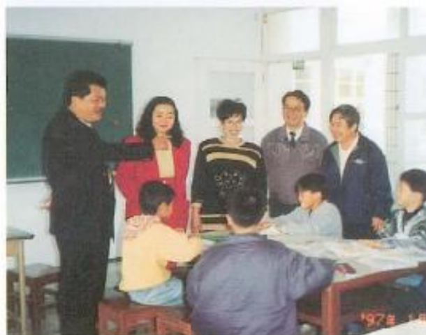
▲參觀新發國小教學情形。