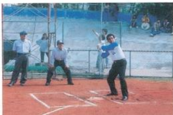
▲黃議長為友誼賽主持開球儀式。