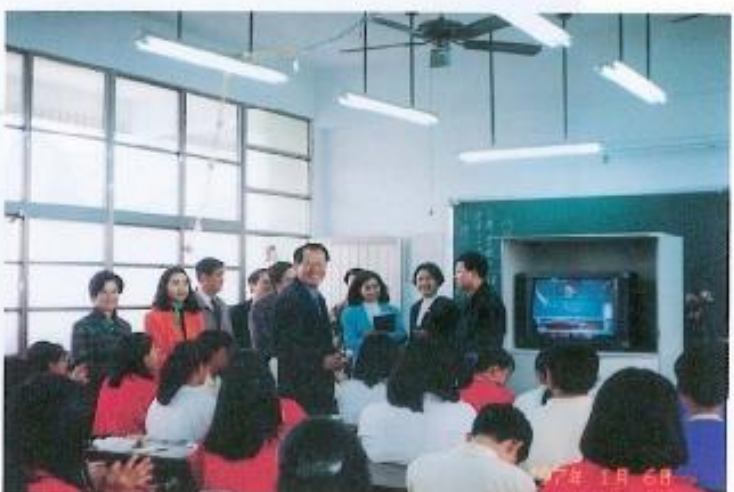
▲參觀林園高中電視教學設施。