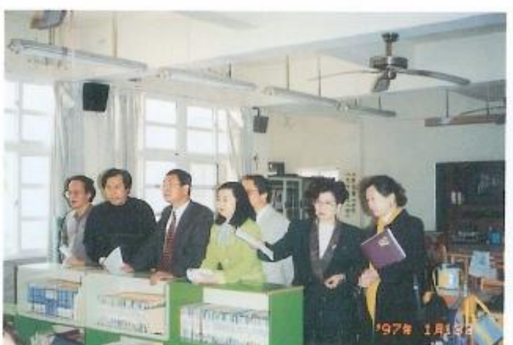
▲了解路竹國小啓智班教學狀況。