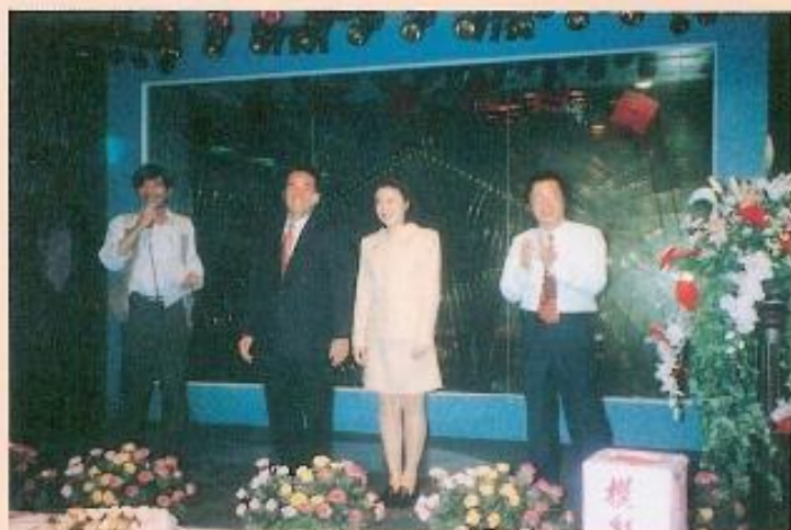
▲黃議長伉儷出席新聞記者會歲末聯歡晚會。