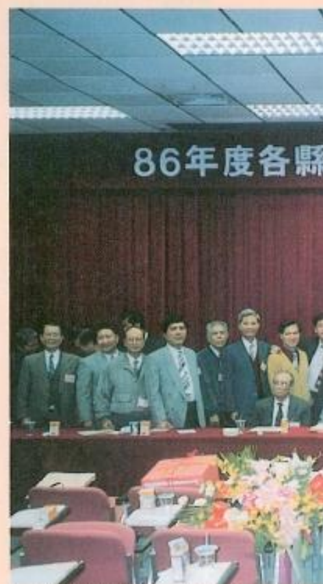
▲各縣市議會法制、議事工作聯繫會。