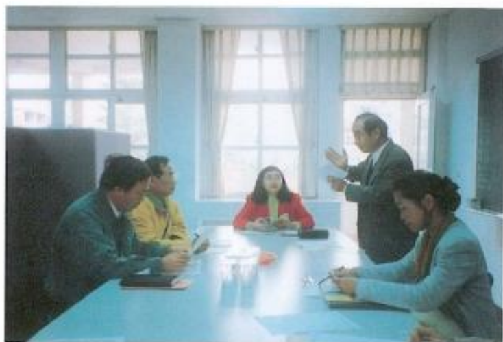
▲福誠國小的電費，校方根本無力負擔。