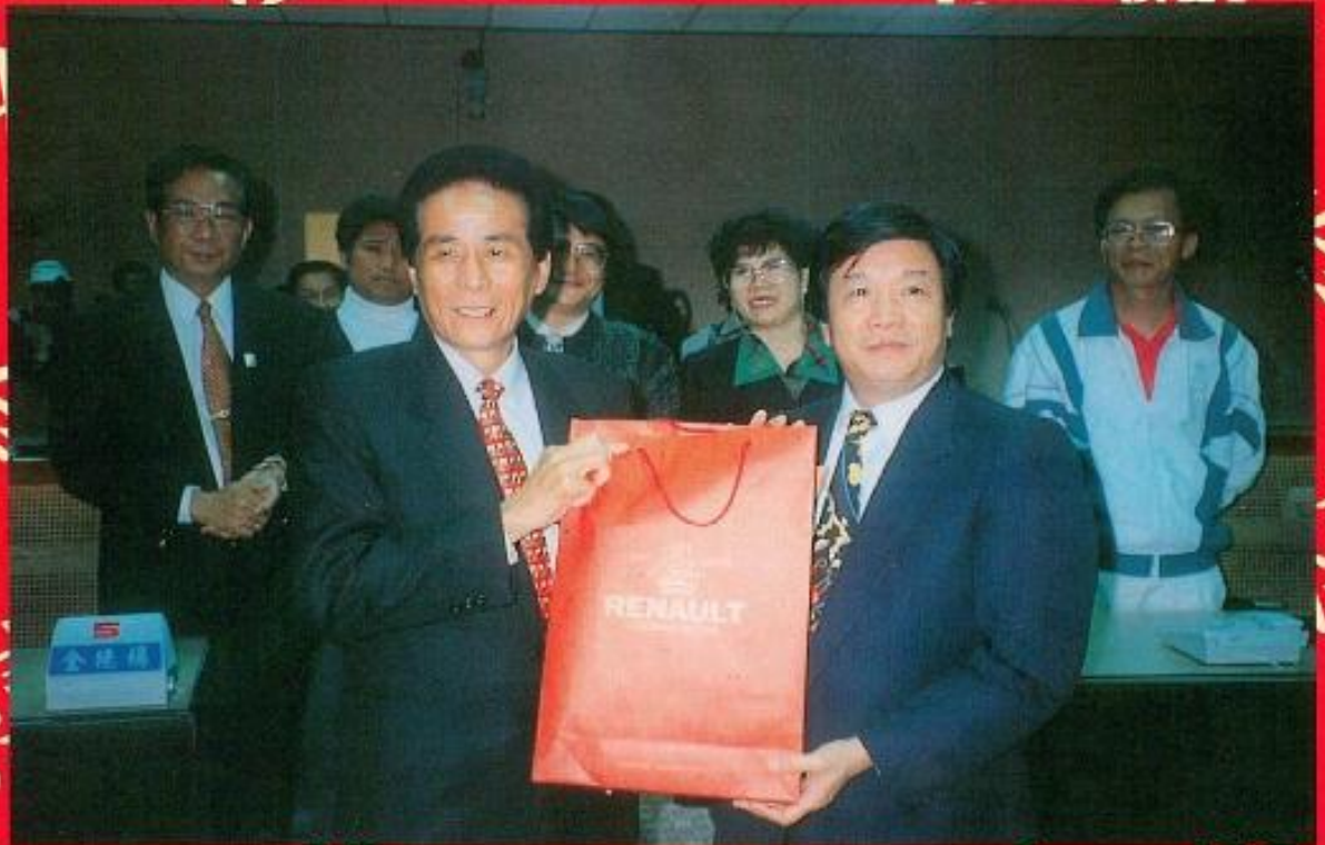
▲本會致贈花蓮縣議會紀念品。