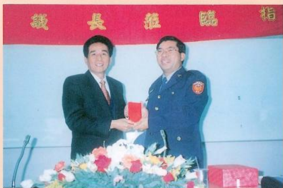
▲黃議長慰勉縣警局消防大隊並致贈加菜金六萬元。