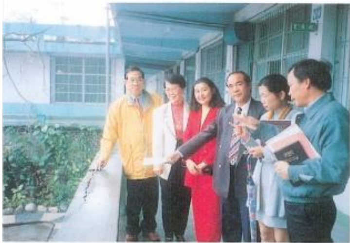
▲五甲國小的欄杆，水泥剝落、鋼筋外露相當的危險。