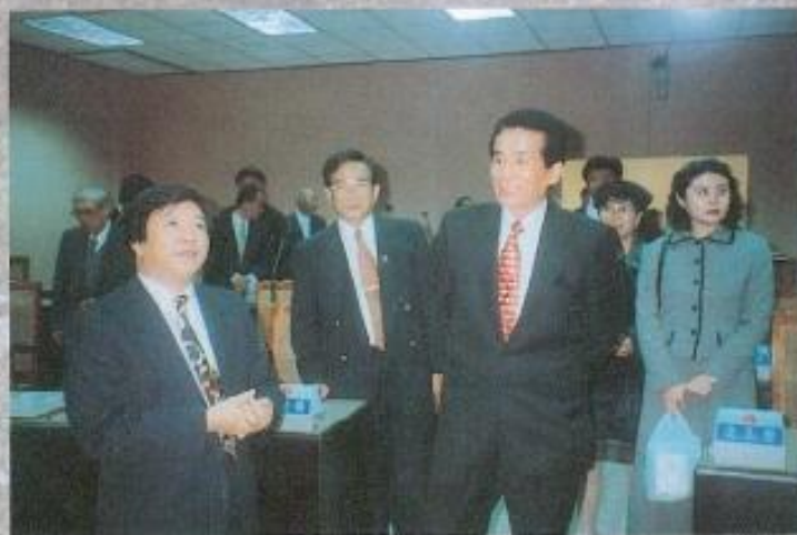
▲參觀花蓮縣議會議事堂。

感謝花蓮縣議會蔡議長及全體議員同仁們熱誠的接待，並提供寶貴的意見，讓我們此行獲益良多，藉本刊表達我們的謝意。