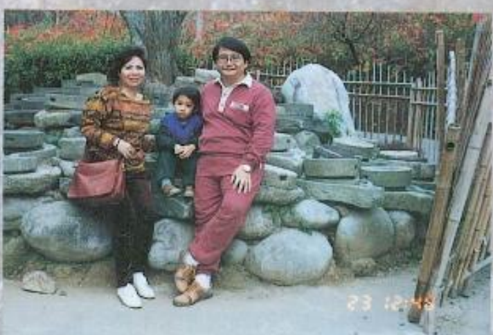
▲李嘉俊議員夫婦於東勢林場合影。