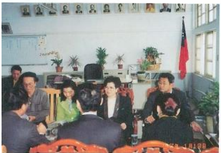
▲關心湖內國中校務推展情形。