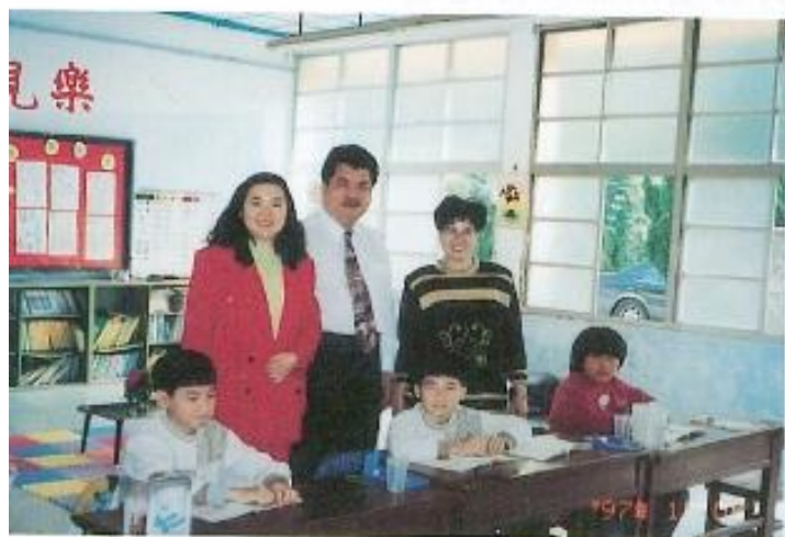
▲本會議員參訪龍興國小天津分校。