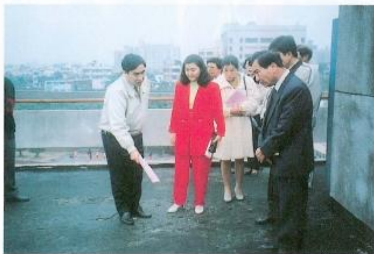
▲ 勘查鳳山國中教室屋頂龜裂情形。

對於上列事項本會議員特別關心並將各校反映需要改善的部份一一造冊，並於日前行文縣府，建議儘快編列預算，以供各校能在近期內改善以嘉惠莘莘學子。