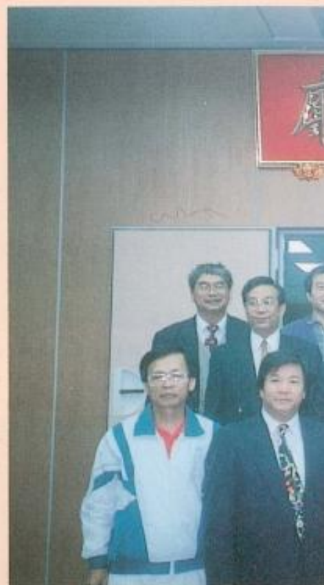
▲黃議長率本會同仁拜會花蓮縣議會。