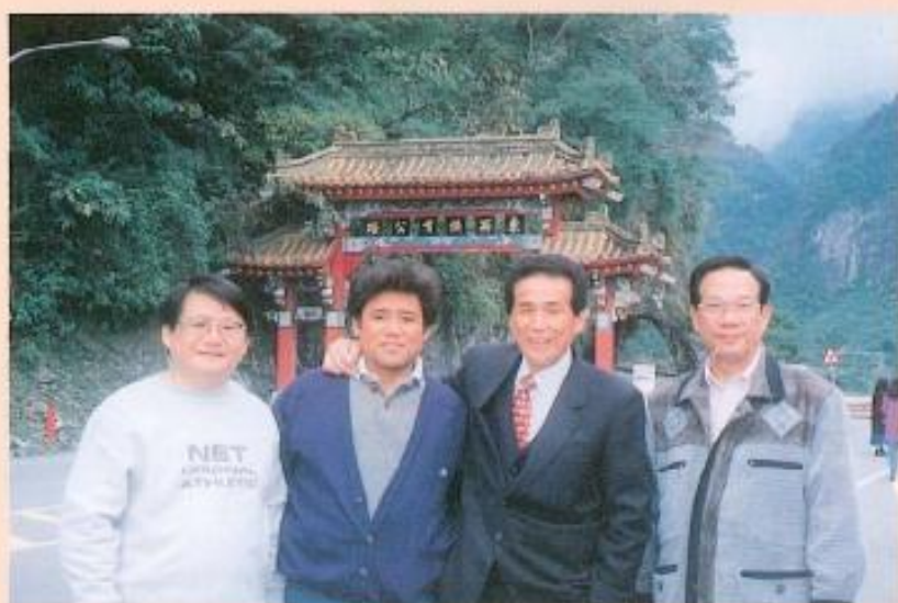
▲議員赴他縣市考察暨自強活動。