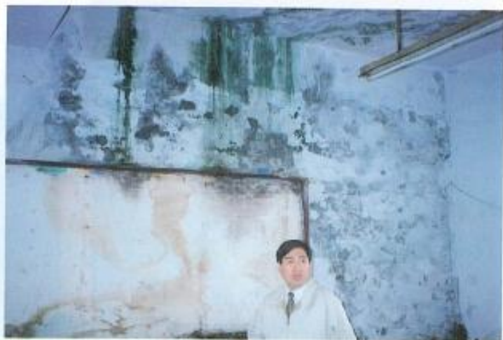
▲本會議員對鳳山國中教室漏水情形極為關切。