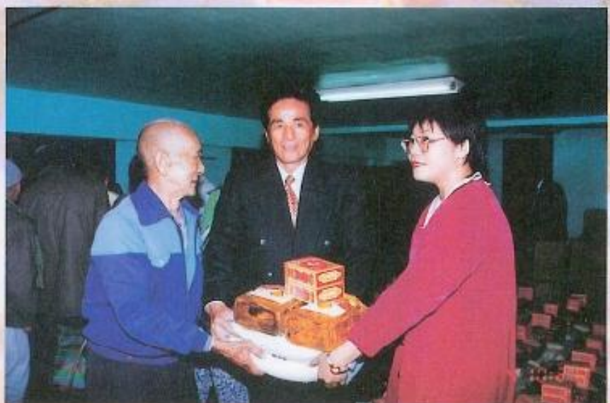
◀ 八年來黃議長每年都舉辦冬令救濟。