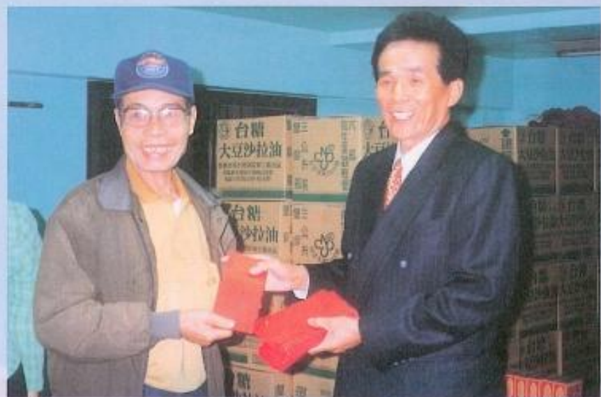
◀ 黃議長體恤低收入戶的愛心再次展露無遺。