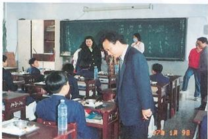
▲本會議員關心南隆國中午餐辦理情況。