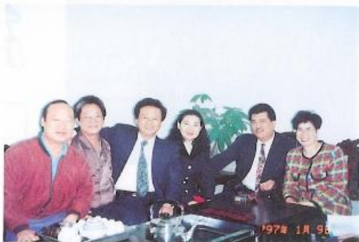
▲本會議員於美濃國小聽取簡報。