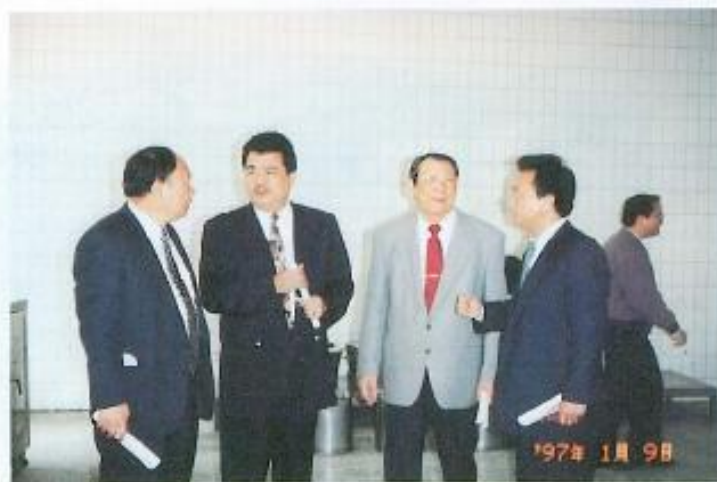
▲美濃國中營養午餐僅有二菜一湯，急待改善。