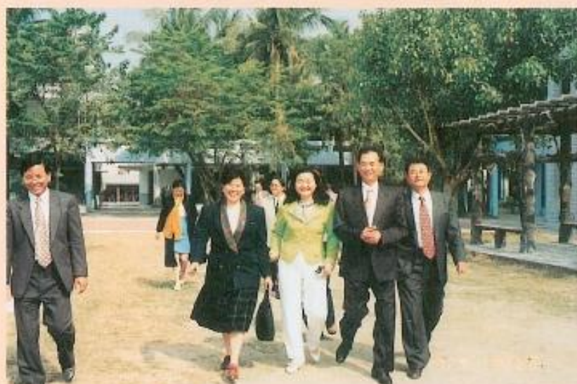
▲本會議員訪視岡山地區學校。