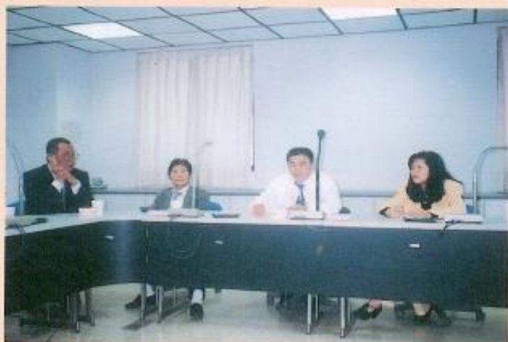
▲岡山镇典寶溪整治工程案。