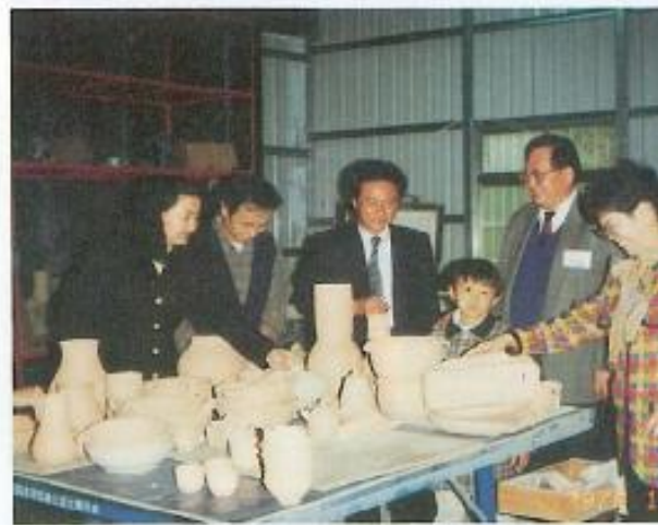
▲本會議員對六龜國中陶藝教學成果極為推崇。