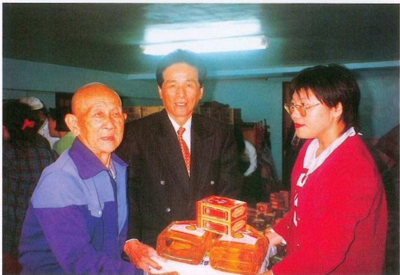
▲黃議長於自宅舉辦冬令賑濟活動，對象含括全鳳山地區貧戶。