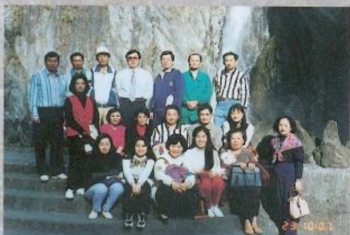
▲參觀龍谷花園於瀑布前合影。