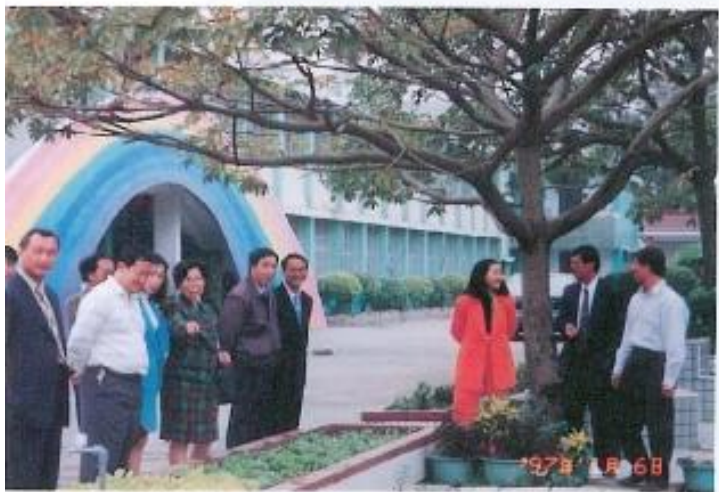
▲潮寮國小植物生態教學極為成功。