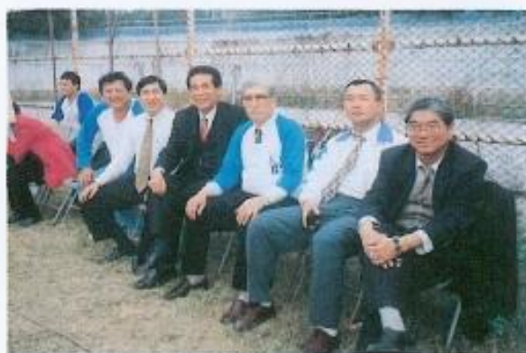
▲黃議長與議員們為與賽的同仁們加油。