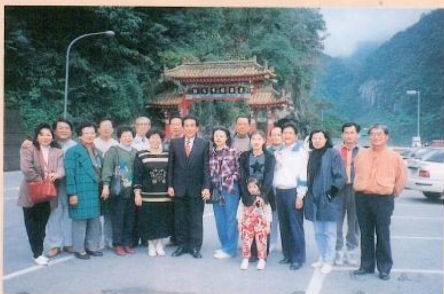
▲本會議員赴他縣市考察暨自強活動。