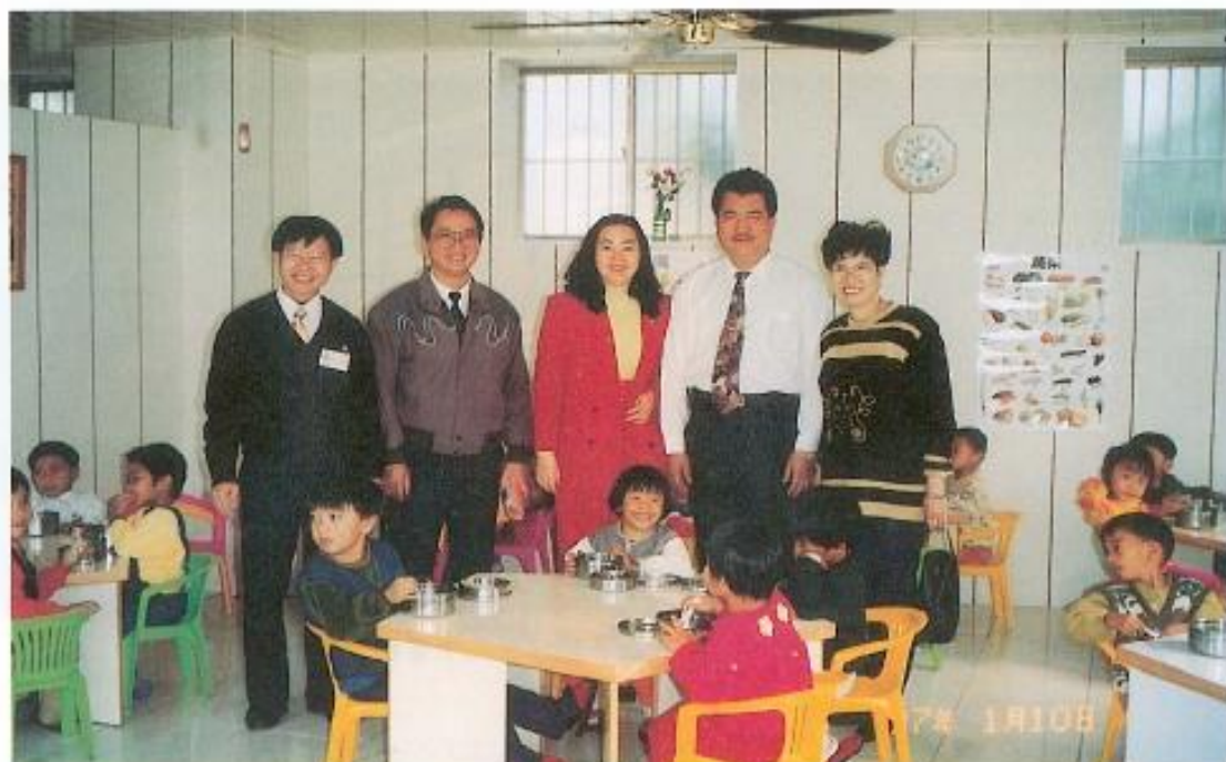
◀茂林國小附設幼稚園辦理的營養午餐十分豐富。