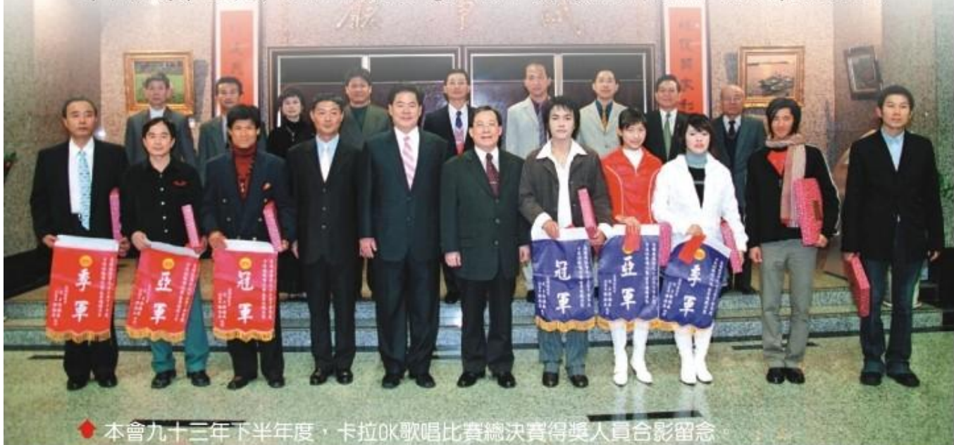
本會九十三年下半年度，卡拉OK歌唱比賽總決賽得獎人員合影留念。