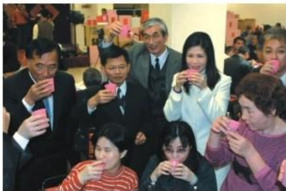
◆府會首長逐桌向本會員工敬茶賀節。