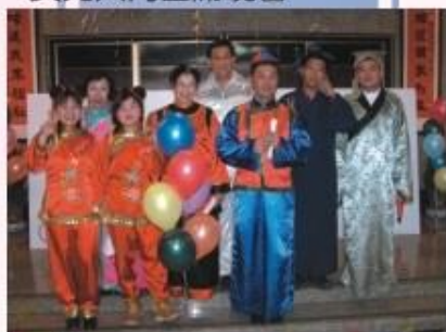
◆演出議員們，興高彩烈的與民眾歡渡耶誕節聯歡晚會。