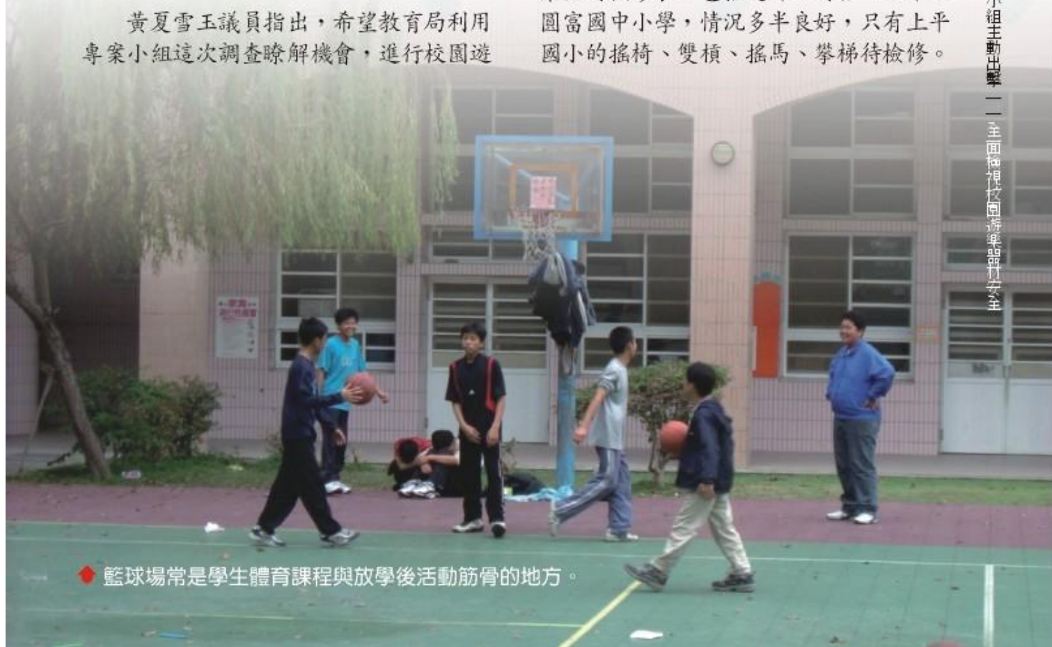
◆籃球場常是學生體育課程與放學後活動筋骨的地方。

教育局首度提供給專案小組的校園遊樂器材檢修表，包括過埤、安招、上平及圓富國中小學，情況多半良好，只有上平國小的搖椅、雙槓、搖馬、攀梯待檢修。