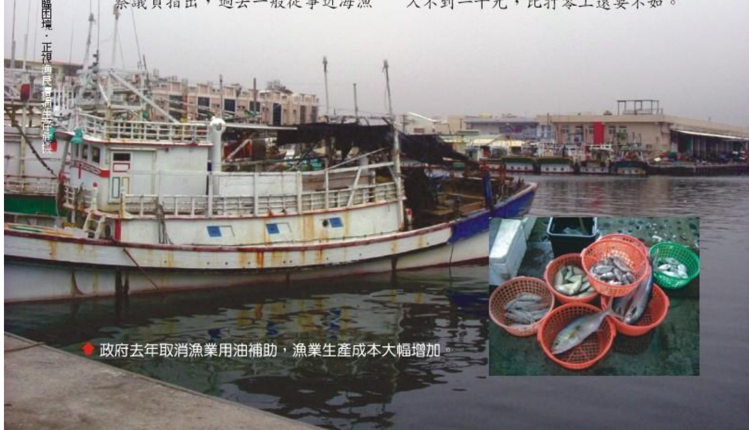
◆ 政府去年取消漁業用油補助，漁業生產成本大幅增加。

撈工作的漁船，一天的用油成本大約是三千元，但是政府取消漁業用油補助之後，漁民一天至少要增加二到三千元的油費，如果以每天漁獲量一萬元計算，過去用油補助時代，漁民賣掉漁獲，獲利還有六、七千元，但是用油成本暴增之後，一艘漁船出海能夠收益四千元已經不錯，如過三、四人平分，一個人收入不到一千元，比打零工還要不如。