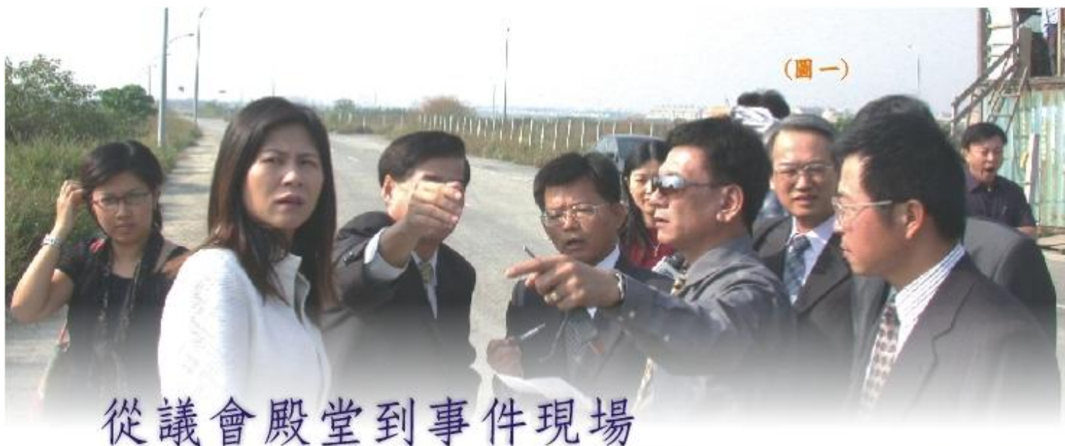
從議會殿堂到事件現場