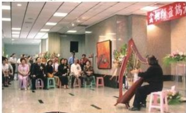
◆ 開幕剪綵典禮暨茶會，現場豎琴音樂演奏。