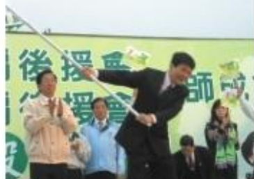
◆擔任挺扁後援會會長