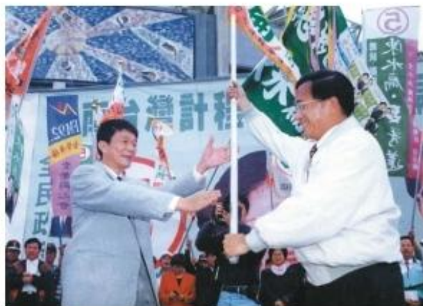
◆積極為民進黨提名總統候選人助選