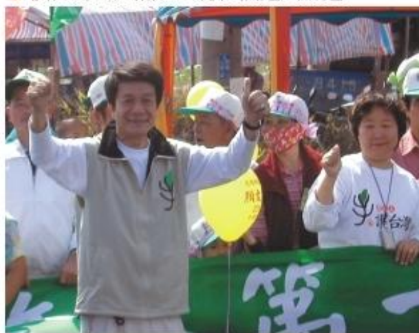
◆參加手牽手護台灣活動