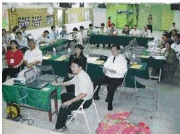
◆本會隨行同仁於忠義國小聽取簡報