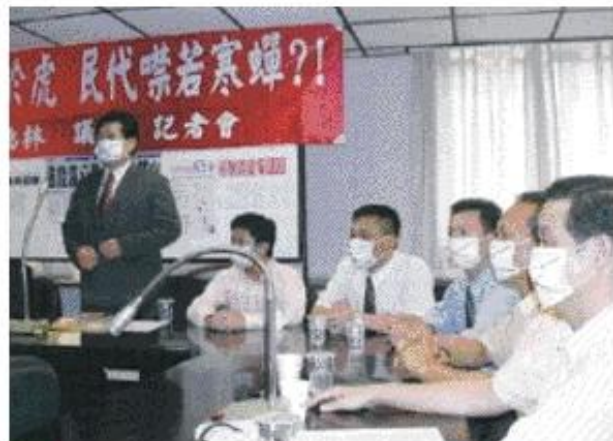
◆國民黨縣議會黨團十二位議員，以戴口罩方式召開記者會，用實際行動表達無言抗議。