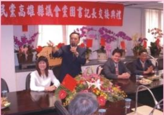
◆ 徐書記長將努力帶領團隊，做好議事運作，就縣府的各項提案和施政進行嚴格把關工作。