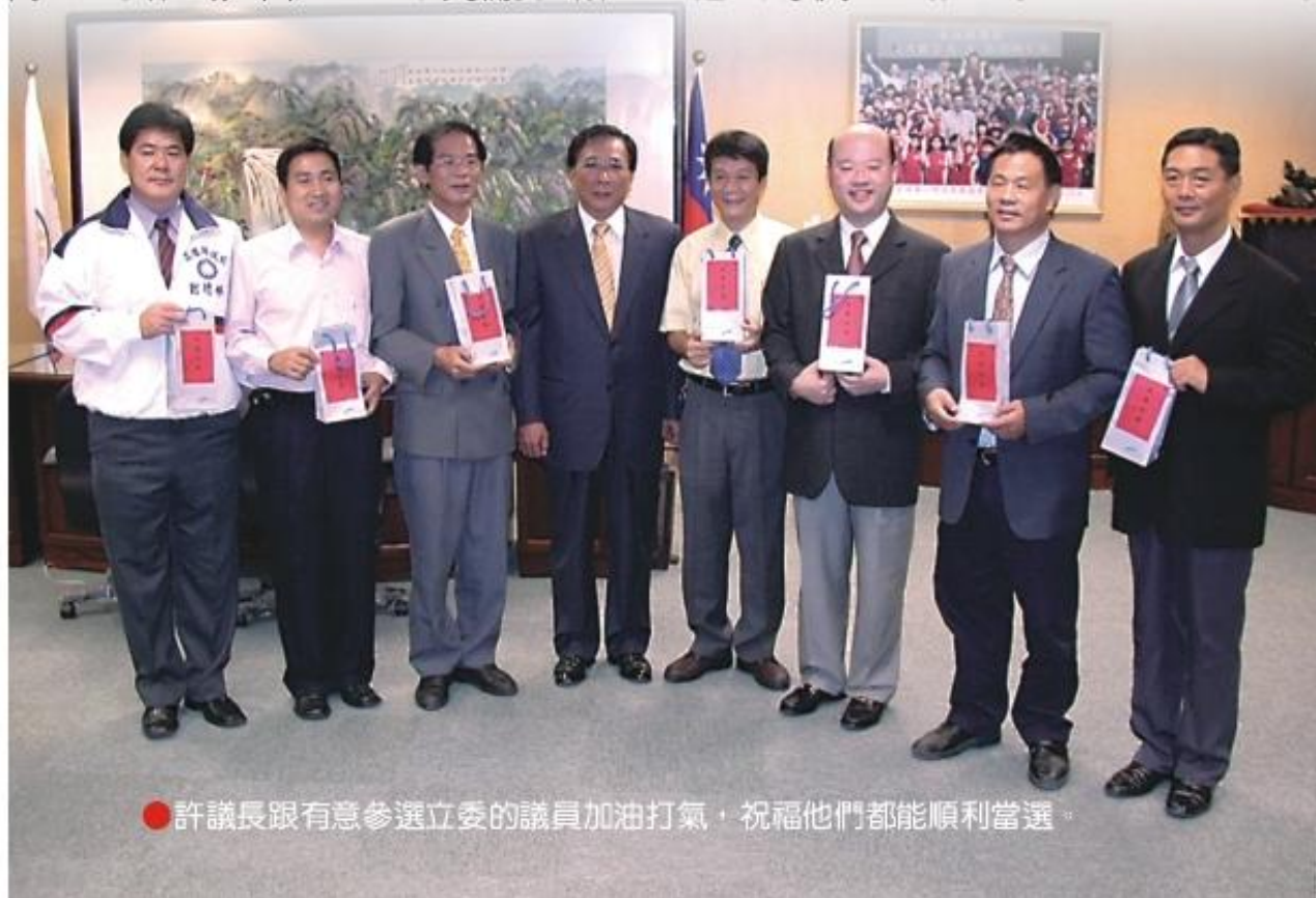
● 許議長跟有意參選立委的議員加油打氣，祝福他們都能順利當選。

有意參選立委的議員們，上午都極有風度彼此鼓勵打氣，場面相當熱鬧。許議長當天笑容滿面，逐一跟有意參選立委的議員們握手，加油打氣，並合影留念，祝福他們都能順利當選，代表高雄縣做更多事。