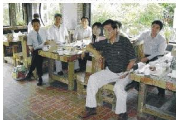
◆本會議員同仁於大樹鄉聽取工務局簡報

農業局代局長蔡復進說，縣府推動的這項植樹計劃，今年五月底前已種完16萬餘株，達成率49.19%。編列在相關單位的預算有工務局七千萬元，負責行道樹栽植綠化景觀工程，現委由各鄉鎮規劃發包中，觀光交通局二百四十八萬元，負責公園綠地美化，現正規劃設計中，預定執行範圍為小崗山登山步道景觀、鳳山五甲環保公園綠美化；教育局四百三十七萬餘元，負責校園級學校預定地綠美化，現已支用約四十一萬五千元辦理老樹祭植樹活動及綠化講習，預定執行範圍為學校預定地文小七綠化工程、植樹月系列活動及忠義國小、大灣國