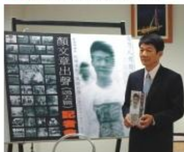
◆推出見證台灣歷史有聲書