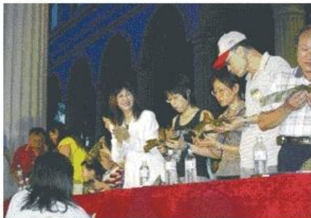
◆陸副議長為「親子吃粽子速度王」參賽者加油打氣

成績二分三十一秒，抱走六千元獎金。第三名的鳳山市吳新貴、吳黃金玉、黃士弘成績二分四十四秒，獲獎金三千元。獲第四名至第十名者，各有一份紀念品。隨後邀請陸副議長，縣議員劉德林、王榮仁、黃明河等人頒發優勝隊伍獎金和獎品。