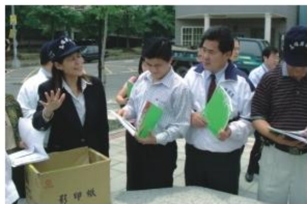
◆議員同仁們手持書面資料，在植樹勘查過程中，細心的逐一審核查對。