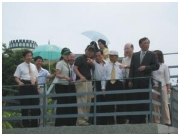
許議長及隨行議員們認為，希望縣府對「鳳凌廣場」內部設計規劃多用心。

楊縣長說，鳳山人口密集，休閒地方很少，鳳凌廣場緊鄰鳳山國小設置，完工後附近景觀將煥然一新，尤其是晚間燈光效果很好，到此喝咖啡、看街頭表演將是一種享受，可成為很好的休閒空間，也可活化附近商圈帶動地方