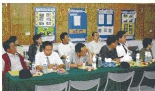
◆議員同仁們於忠義國小專注聽取教育局簡報