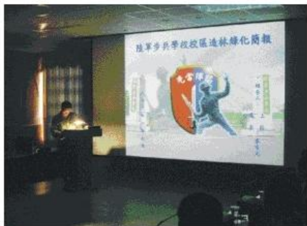
◆步校校區造林綠化簡報