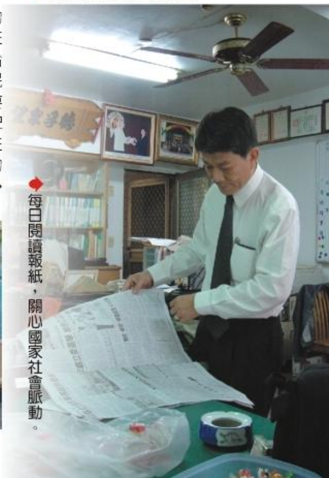
◆每日閱讀報紙，關心國家社會脈動。