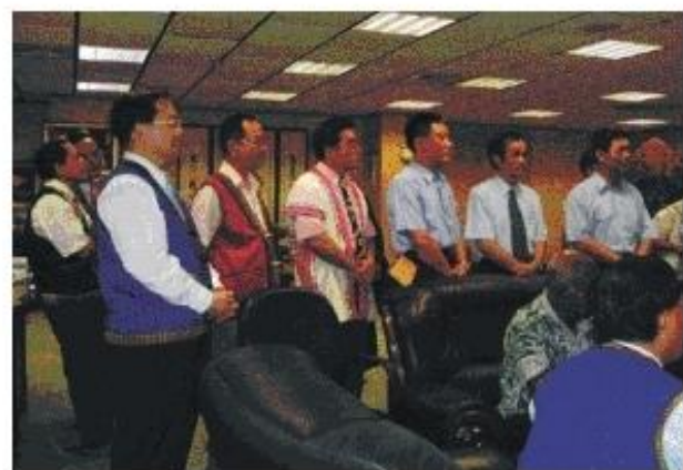
◆ 斐濟原住民藝術團到訪，多位議員在場作陪，尤其與本會原住民議員頗有互動。

心，是由三百多個環狀珊瑚礁組成，面積僅有台灣的一半，人口大約有八十五萬人，是一個椰林林立的度假島國，這次到高雄縣訪問是透過台北市政府邀請，到高雄縣三民鄉參加布農族打耳祭表演，當日下午這支訪問團在縣議會表演了一段精美的斐濟原住民藝術表演，獲得在場人士的熱烈掌聲回應。