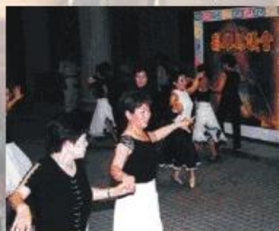
■ 瑞興媽媽土風舞社，舞出青春與活力。

議長許福森一再表示，希望鄉親能善用本會開放式的休閒空間，現場來感受水舞表演的震撼，一邊欣賞精彩的節目，一邊品嚐議會免費提供的咖啡、茶水、糖果、餅乾，留下週末夜美好的回憶。◆