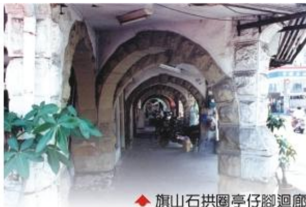
◆ 旗山石拱圈亭仔腳迴廊