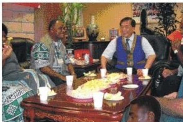
◆ 依斐濟慣例，大酋長不對外發言，僅以官方代表的身份，感謝本會的熱情接待。

心，是由三百多個環狀珊瑚礁組成，面積僅有台灣的一半，人口大約有八十五萬人，是一個椰林林立的度假島國，這次到高雄縣訪問是透過台北市政府邀請，到高雄縣三民鄉參加布農族打耳祭表演，當日下午這支訪問團在縣議會表演了一段精美的斐濟原住民藝術表演，獲得在場人士的熱烈掌聲回應。