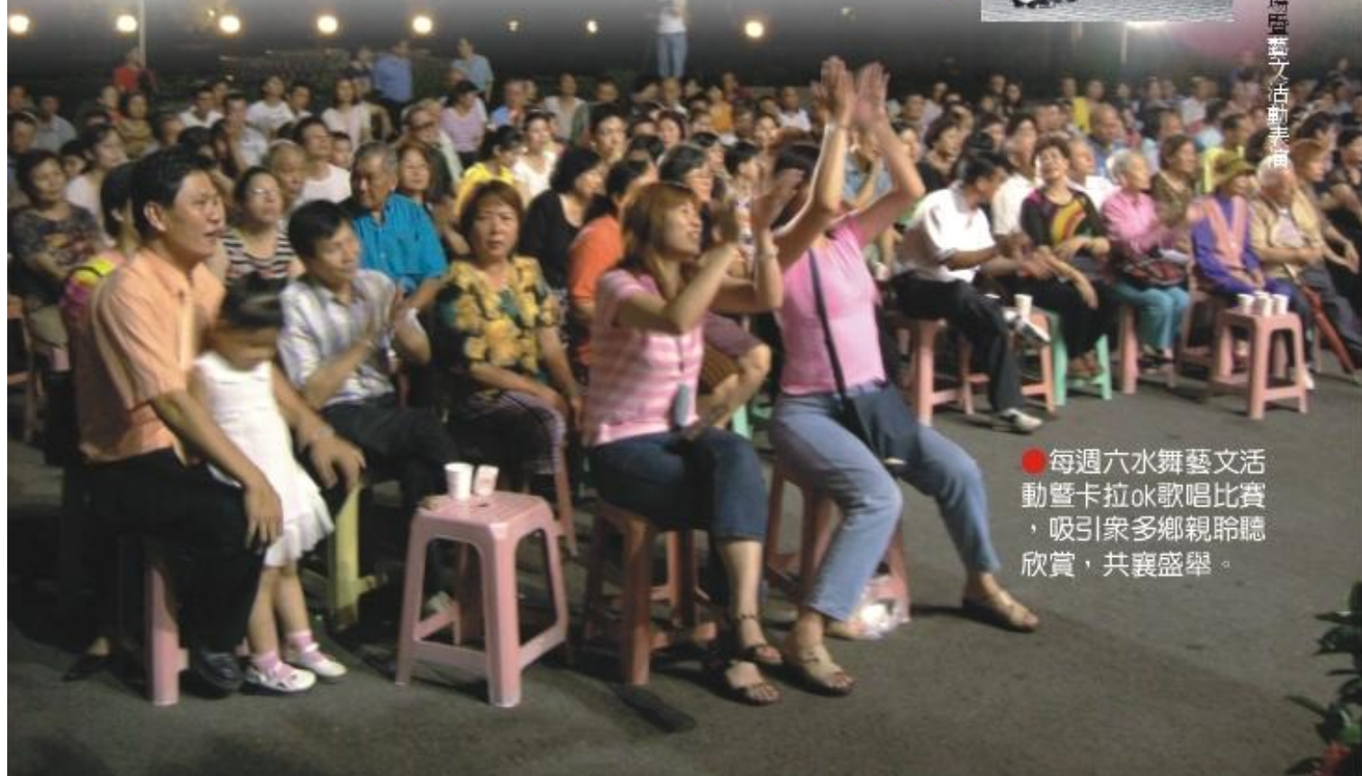
● 每週六水舞藝文活動暨卡拉ok歌唱比賽，吸引眾多鄉親聆聽欣賞，共襄盛舉。