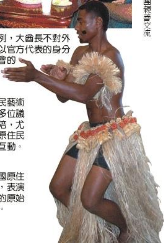
◆ 斐濟共和國原住民藝術團，表演出力與美的原始動感舞蹈。