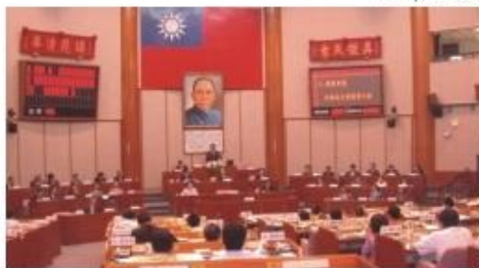
◆本會第十五屆五次定期大會