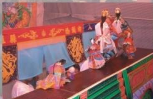
◆ 高雄縣橋頭鄉樂糖國小木偶戲團，用靈巧雙手為鄉親演出「武松打虎」戲碼，掌中戲出人物，栩栩如生。