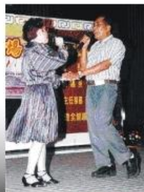
◆ 情歌對唱，經常有夫妻檔參賽。

參賽者中有人屢敗愈勇，勤練歌喉：情歌對唱組，有的是銀髮夫妻，有的是父女檔，甚至是年紀僅十來歲的姊弟或兄妹檔；社青組與長青組當中，也常看見殘障同胞參與比賽，所以音樂歌唱是沒有任何分界的。只要是鄉親對歌唱有興趣者，本會竭誠歡迎您來報名參加。◆