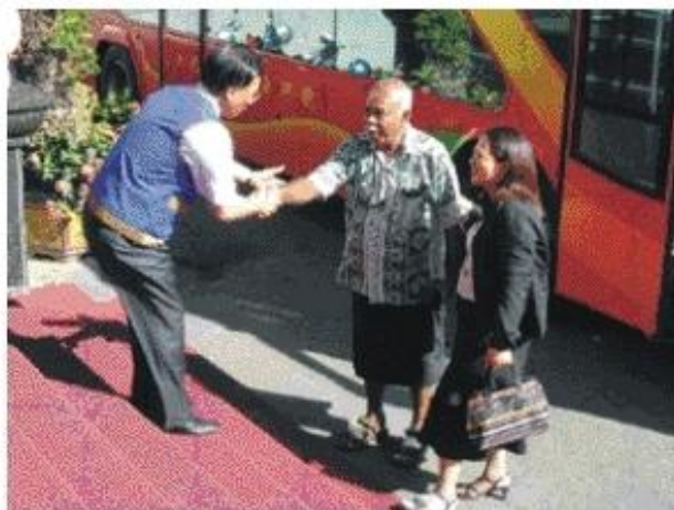
◆ 許議長親自歡迎斐濟大酋長貝拉瓦魯嘉賓。