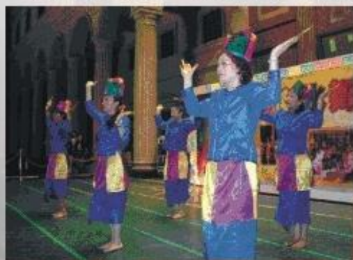
◆ 大寮社區發展協會土風舞社表演「泰國歡樂舞」