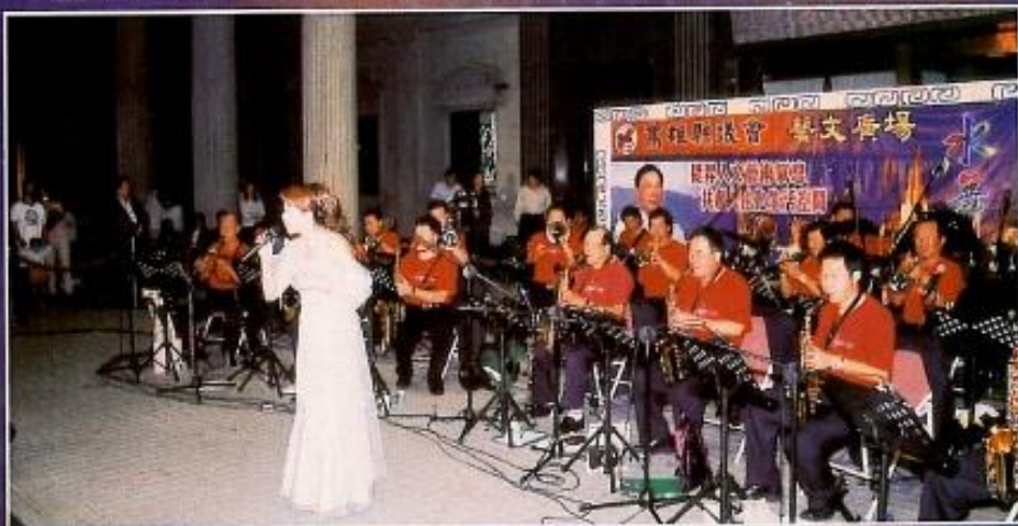
■ 高雄市音樂工會管絃大樂團於十一月一日假高雄縣議會水舞廣場前表演