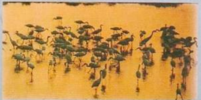
▲黃昏時，成群的白鷺鷥在業已荒蕪的鹽灘中覓食。

為了促進國家經濟發展，提供能源，政府在永安鄉設立了火力發電廠和中油天然氣接收站，為了降低環境污染的考量，電廠採用潔淨的 LNG 天然氣為主要燃料，這是最世界上最乾淨的化石燃料，產生的二氧化碳遠較燃油燃煤電廠為少，符合減緩溫室效應趨勢，有利於提昇我國國際環保的形象而興達發電廠的總發電量未來可望躍居為世界十大電廠之一。