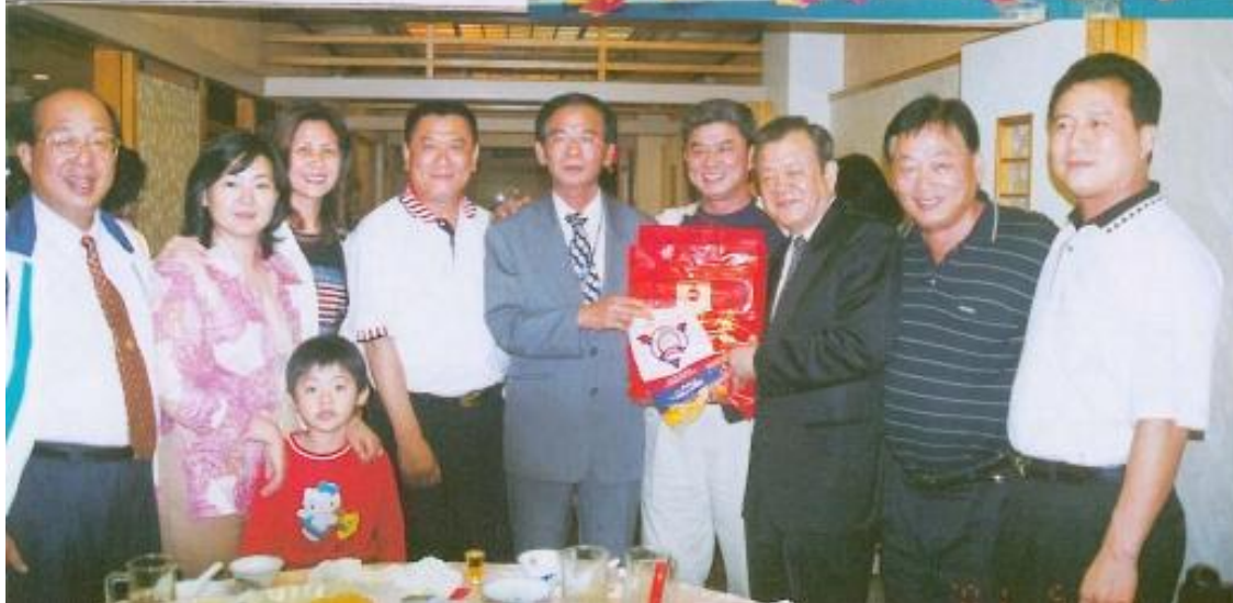
◀本會第一、四審查委員會議員赴宜蘭縣議會拜會，雙方互贈紀念品留念。