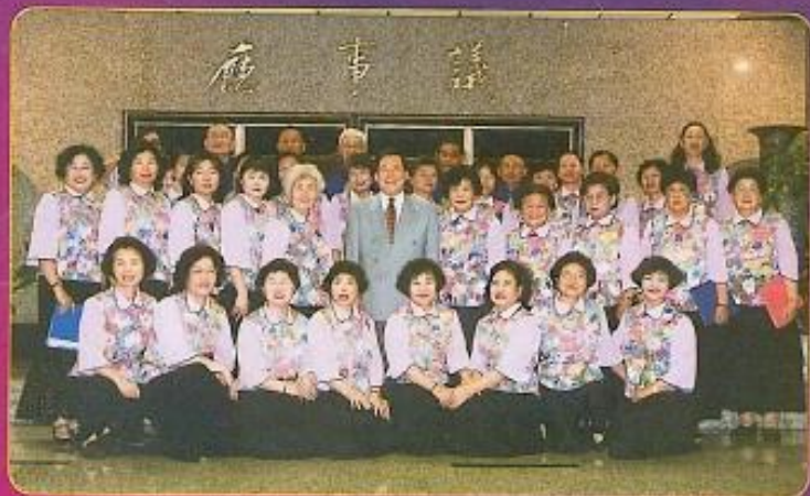
▲ 鳳韻歌舞協會及鶯之頌四重唱於本會週末水舞藝文晚會演唱多首悠揚之樂曲。