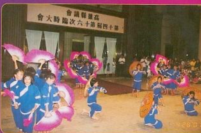
▲ 美濃福安國小為本會水舞表演精采生動的客家舞蹈，吸引了所有觀眾的眼光。