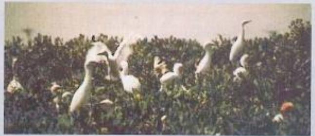
▲在「永安濕地自然公園」棲息過冬的水鳥種類高達百種，是知名賞鳥區。

永安現在的保安路以西原為大海，保安路即是海岸線。至清朝初年，形成潟湖海岸，漸成天然港口，後因阿公店溪等溪流因豪雨而山洪暴發，攜帶山區的流砂流向海岸，造成陸地，加上人工圳道也推波助瀾的傾注泥砂，使潟湖逐漸變成海埔新生地。此時已經有人到此地開墾，對海埔新生地加以利用，築堤引海水入內形成魚塭，有的則開發成鹽田。過去本鄉鹽田村居民，即以經營鹽田為生。後因政策關係，以及興達火力發電廠的建立，因此隨著老鹽工的日趨凋零，結束了鹽場的經營。目前這片大約一百三十公頃的濕地，紅樹林密佈，生長情形良好，在這兒棲息過冬的水鳥種類高達百種，因此，縣政府預定在這兒成立「永安濕地自然公園」，完成後將具學術、調節水患、淨化水質、觀光經濟等價值。