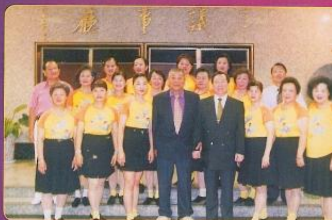
▲ 烏松群友會為本會水舞活動帶來精采的舞蹈表演。