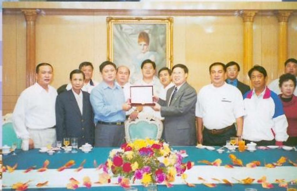
▲本會國民黨團議員組隊赴大陸做參觀交流。