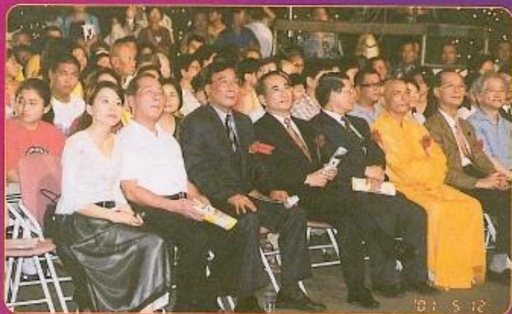
▲ 為表揚身心障礙者的母親，本會特結合週六水舞表演，擴大舉辦第八屆全國傑出愛心媽媽表揚大會，立法院院長王金平(左四)及議長許福森(左三)均全