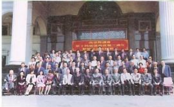
▲封面圖說 本會第十四屆議員就職三週年暨 歷屆議員回娘家，於本會前合影 留念。