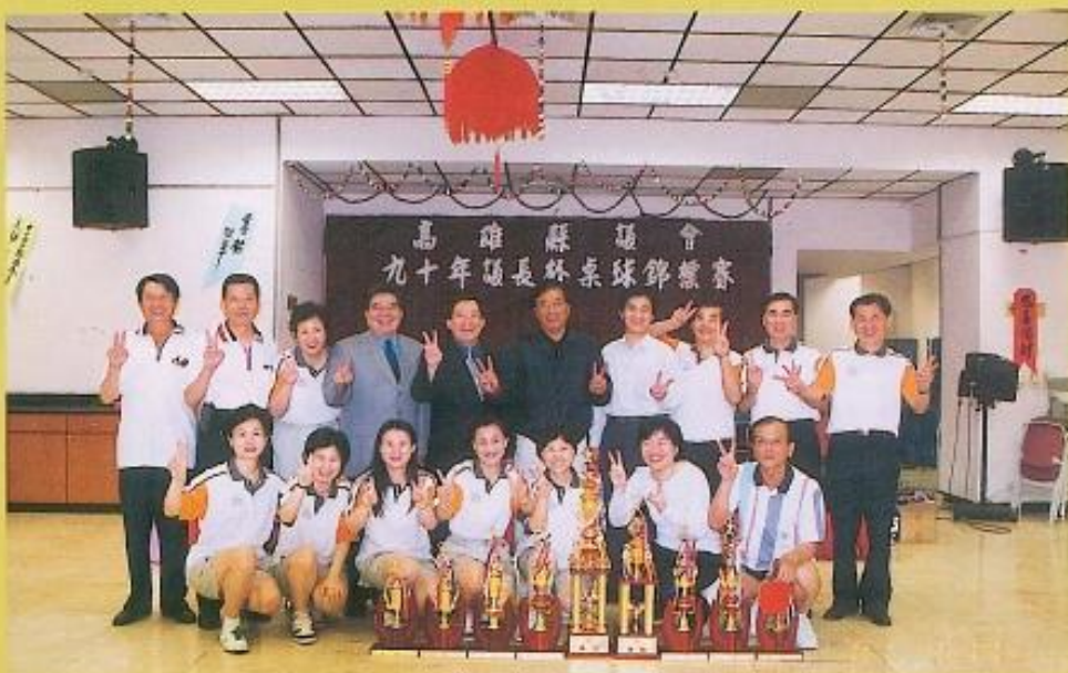
長日服及 議十員細碩、 年十運動豐 十四會運果 九於本的成 會賽，得然 議標落難果 縣錦幕現， 高雄滿展， 高卓球滿展 卓球滿展精 員滿展精神 員滿展精績