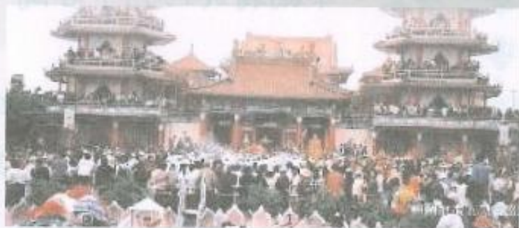
▲一甲國小旁的觀音亭香火鼎盛。

未來路竹智慧型工業園區的開發，所引進的都是智慧型的工業及高科技的產業，不僅對環境不會有傷害性的污染，又可提供三萬個工作機會，加上緊鄰的岡山本州工業區亦可提供一萬個工作機會，兩大工業園區一氣呵成，可見路竹鄉前景一片看好。此外，東帝士集團所投資開發的路竹工商綜合區及購物中心的建設，新瑞都集團投資大湖工商綜合區的開發案，以及興達遠洋漁港以及海洋文化園區等休閒觀光區的開發案，路竹於二十一世紀將成為結合休閒、渡假、文化、藝術、教育、科技的前瞻性遊憩中心。