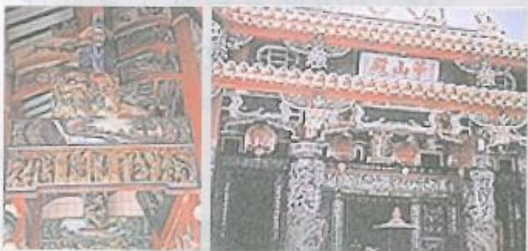
▲華山殿供奉明朝末代王孫寧靖王，殿內古色