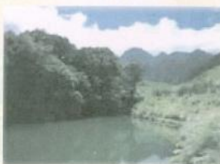
▲少年溪風景區山清水秀。