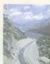
▲荖濃溪為四級泛舟線，比秀姑巒溪泛舟更刺激。