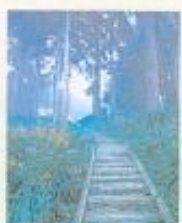
▲藤枝森林遊樂區內人工設施不多，充滿原始風情。