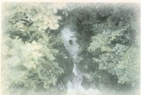
▲少年溪環境幽美，水質清澈。

桃源鄉可說是山與水的故鄉，到此一遊可藉由大自然洗滌心靈，是週休二日親子共遊的好去處。