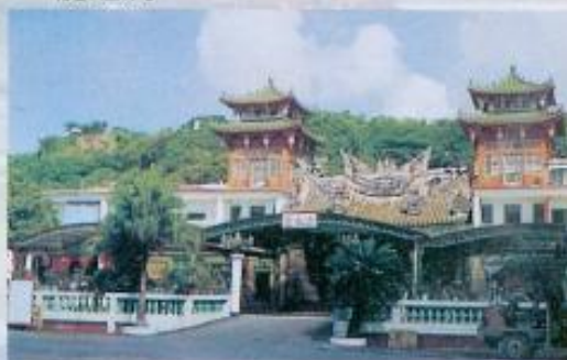
▲位於清水岩下，供奉釋迦牟尼佛及觀世音菩薩的清水寺。