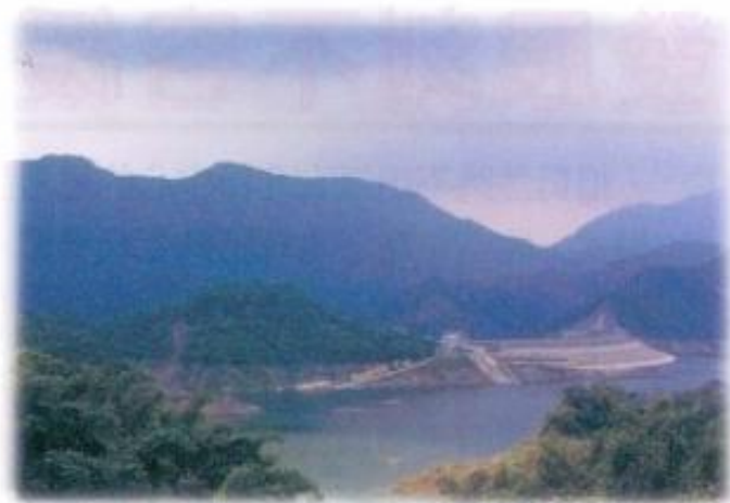
▲ 水資源取得不易，如何有效運用水資源，以及開發水資源是政府重要課題。

合、再生或相互支援這些水源。如此既開源、又節流雙管齊下，方能跳脫傳統思維，真正找出缺水危機。