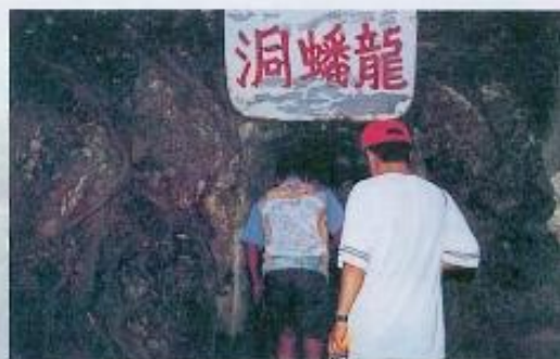
▲位於清水岩上日據時代隧道遺址——龍蟠洞。

林園鄉內有盛行的九孔養殖業和豐富的溼地資源。縣長曾兩次到高屏溪附近種植紅樹林，為了讓子孫能看見紅樹林及黑面皮鷺再造訪，可見他對濕地與生態的重視。原本為林園鄉垃圾掩埋場的河濱公園，已不見當年滿坑滿谷垃圾景象，但走近公園依稀可以聞到垃圾的獨特臭味；究此在期待林園鄉成為未來亞太營運中心境外航線最大的腹地同時，該整頓境內林園工業區所引發的環保相關議題。在經濟發展的同時，也不要遺忘所擁有的文化資源寶藏。