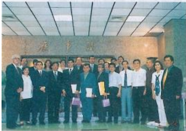
▲巴拉圭中央省議長胡哥率團訪問本會，議長許福森與議員熱情接待。(詳文見27頁)。