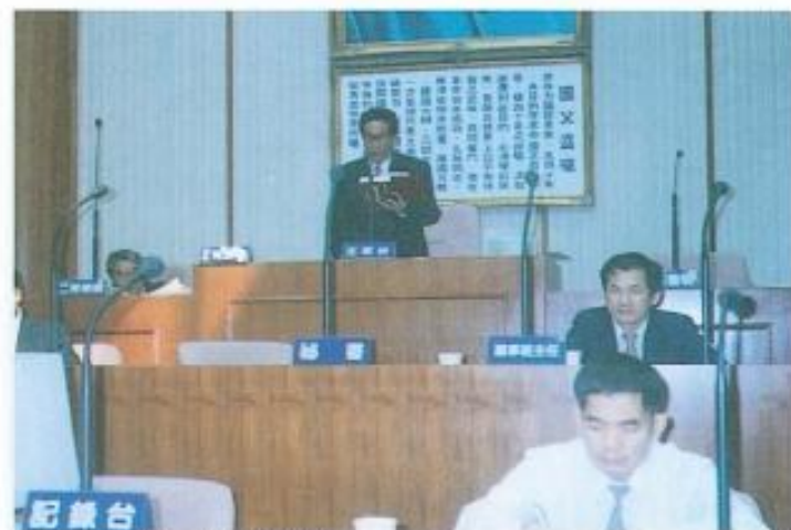
▲審查本會組織規程草案。