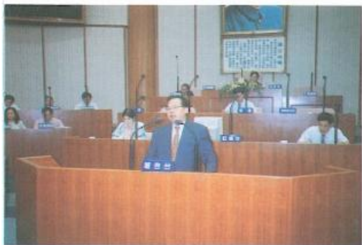
▲縣長余政憲施政報告。