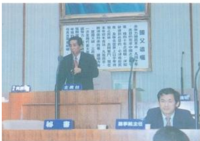
大會討論議案讀會。