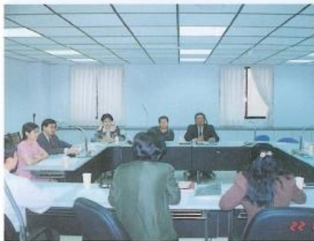
▲分組審查議案【民政】。