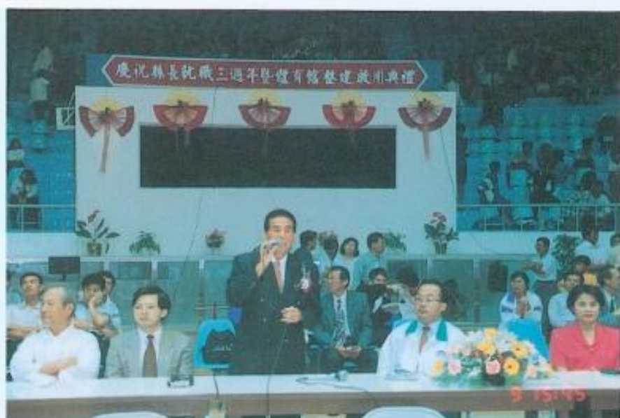
◀黃議長參加體育館整建啓用典禮。