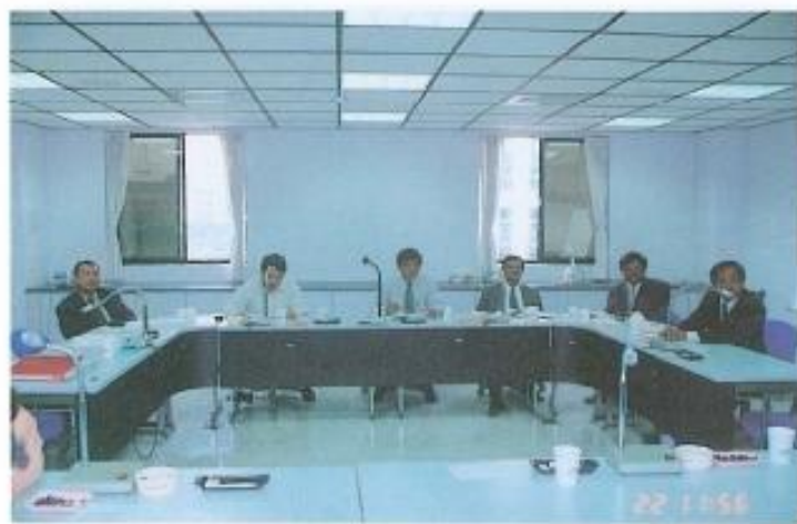
▲分組審察議案【建設】。