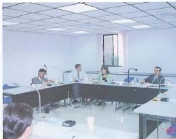
▲分組審察議案【保安】。