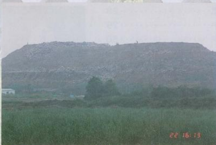
▲黃議長表示：本會議員相當關心垃圾山的處理問題。