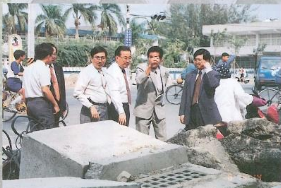
▲本會議員極為重視台 21 線（中山東路）施工進度。