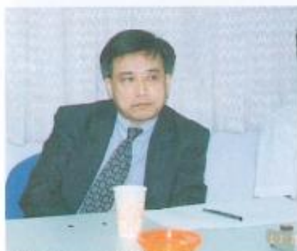
▲康城公司代表列席說明。