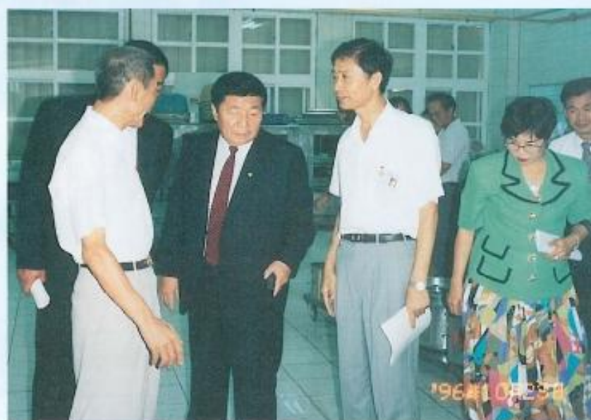
▶專家小組視察國中、小營養午餐辦理情形。