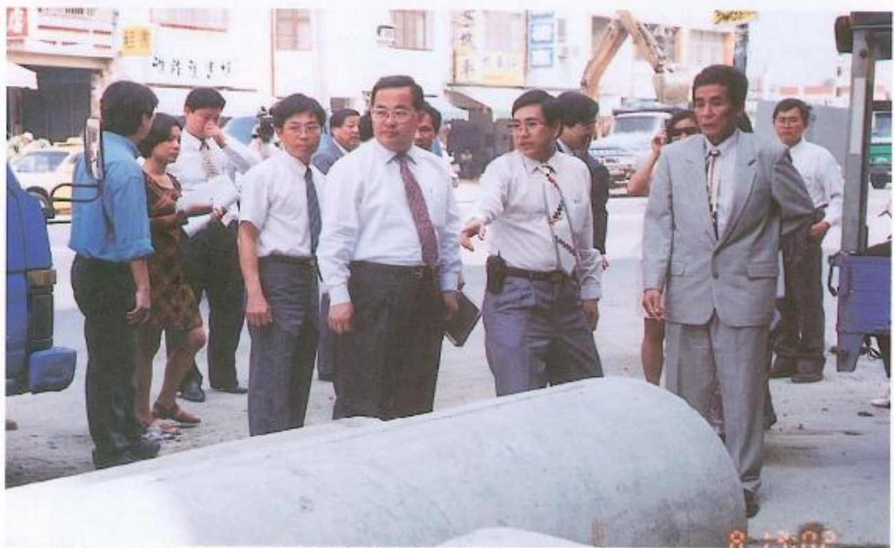
▲黃議長偕同本會議員與縣長余政憲至鳳山市中山東路查勘道路拓寬工程施工品質。