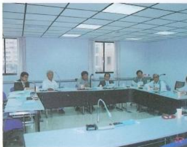
▲分組審查議案【財政】。