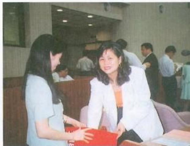
▲抽籤決定質詢順序。