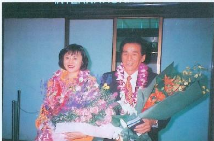
▲黃議長伉儷返抵國門。