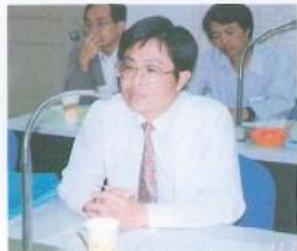
▲建設局長林琦瑞列席本專案小組。