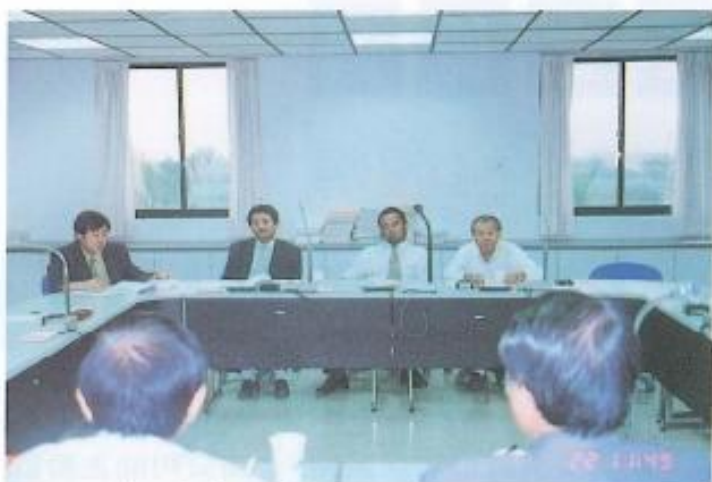
▲分組審查議案【農業】。