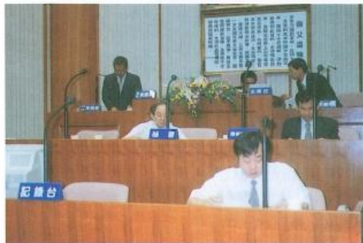
▲預備會議【討論議事日程】。