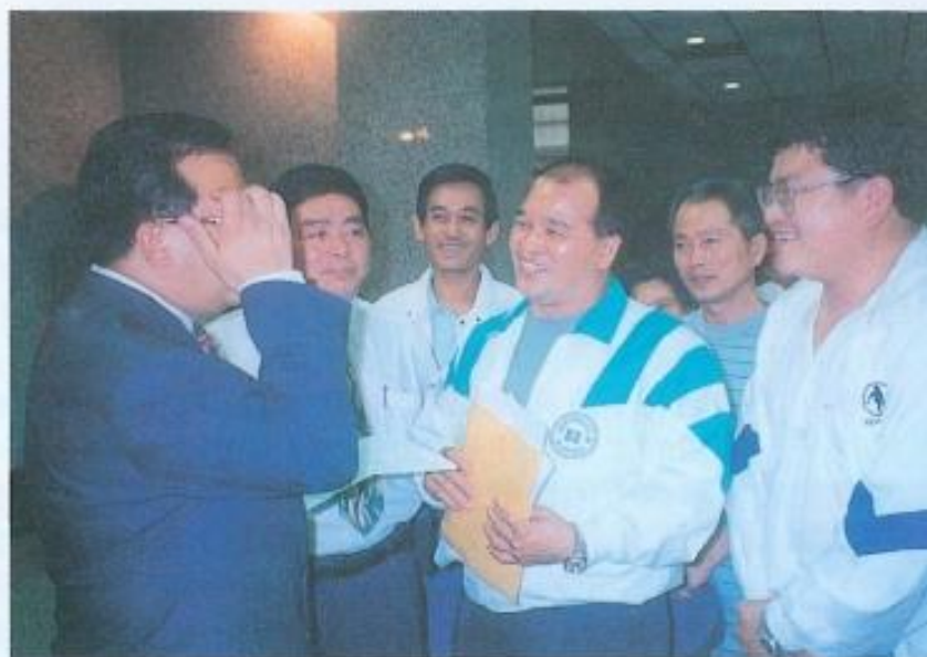
▶蘇炎城議員陪同鳳山工協市場攤販業者遞交陳情書給縣長余政憲。