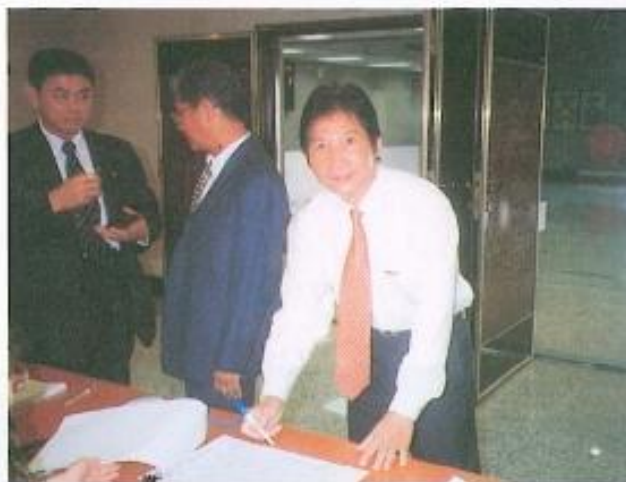
▲本會議員簽名報到。