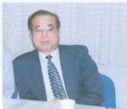
▲台開公司蔡經理列席本會議。