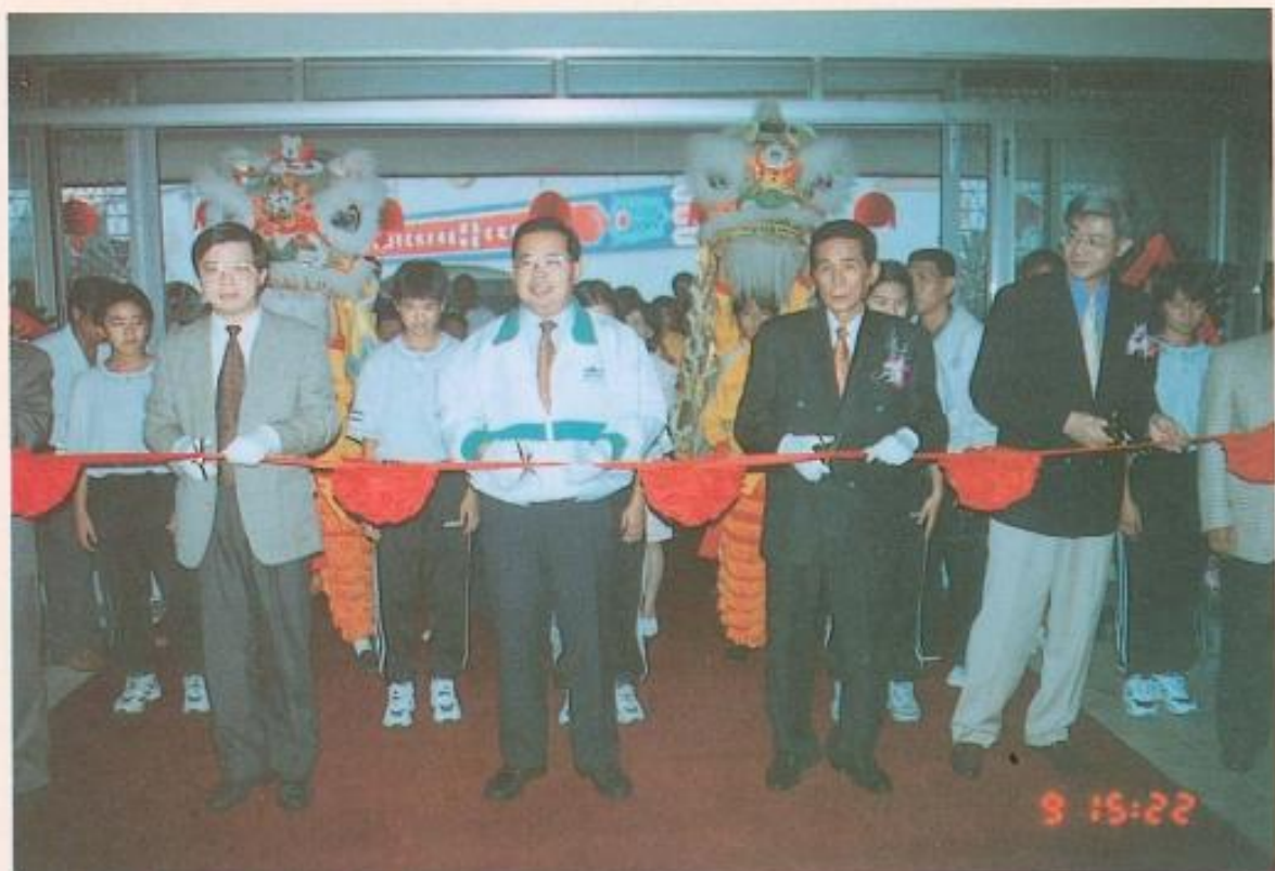
▲黃議長為體育館整建啓用剪綵。