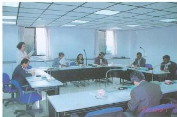
▲分組審察議案【教育】。