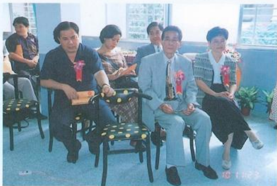
◀黃議長參加高雄縣遊民收容所啓用典禮。