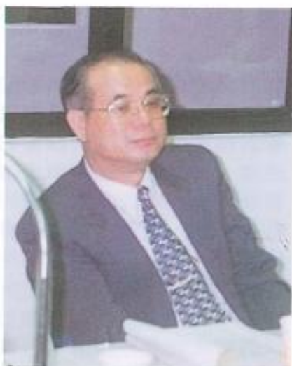
▲台開公司官僚作風對本案極不合作。