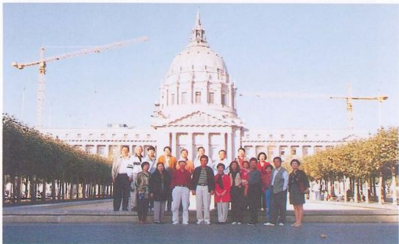
▲舊金山市政廳前黃議長與全體團員合影。