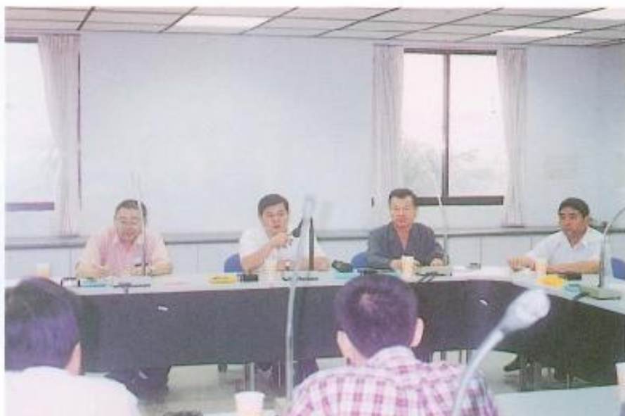
▲議員質疑：台塑、台苯、南帝的違建為何未見查報？

照的石化廠，建設局暫緩發照，且縣府也暫不受理石化廠擴廠的申請，環保局如果不尊重議會的決議，只聽從上級的指示辦事的話，乾脆下令擴廠案全部暫停，等全面勘查後，確定公共安全方面沒有問題時才准復工。