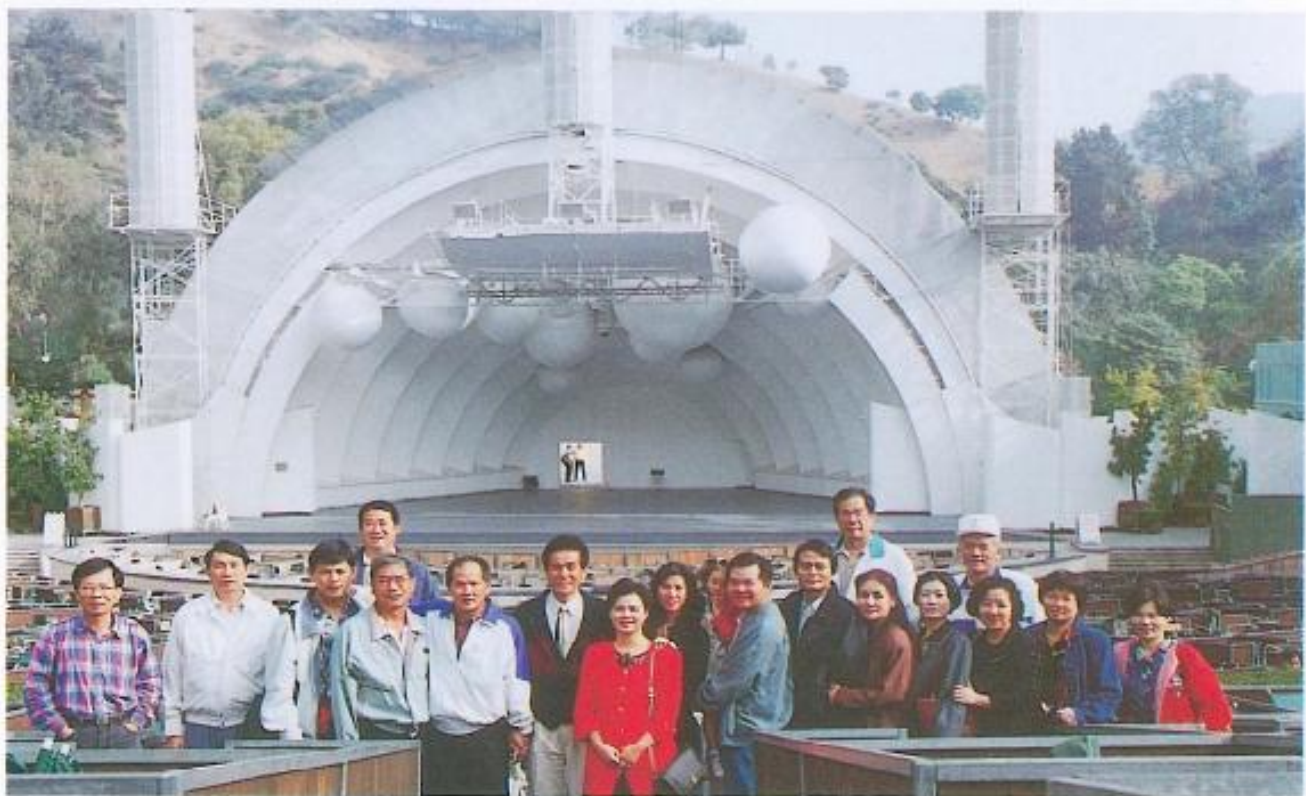
▲洛杉磯好萊塢露天劇場黃議長暨全體團員合影。