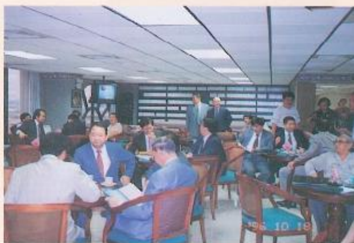
▲參訪人員於本會聯誼。