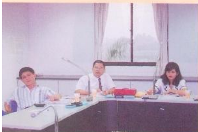
▲岡山工業區開發案。