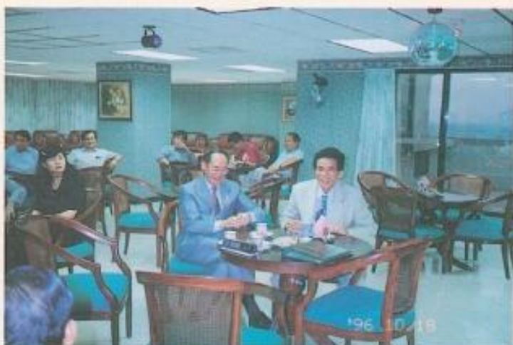
▲錢議長與黃議長相談甚歡。