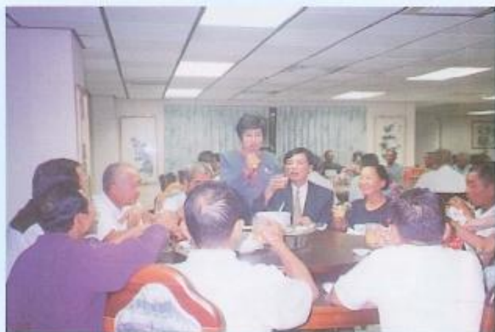
▲陳副議長夫婦設宴招待來訪貴賓。