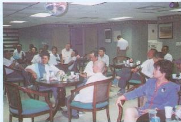
▲卡拉 OK 聯歡之三。