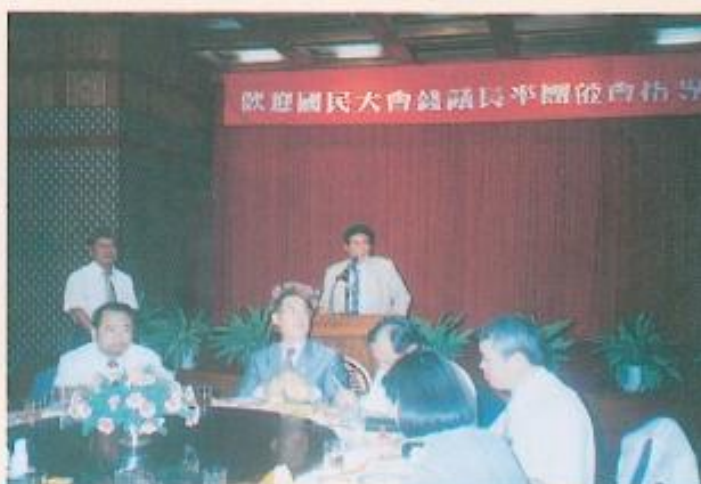
▲黃議長於圓山飯店設宴招待來訪的國大代表。