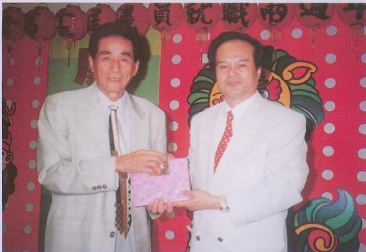
▲黃議長致贈新竹縣議會禮品，由議長黃煥古代表接受。