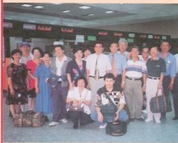
▲黃議長率團赴美西考察。