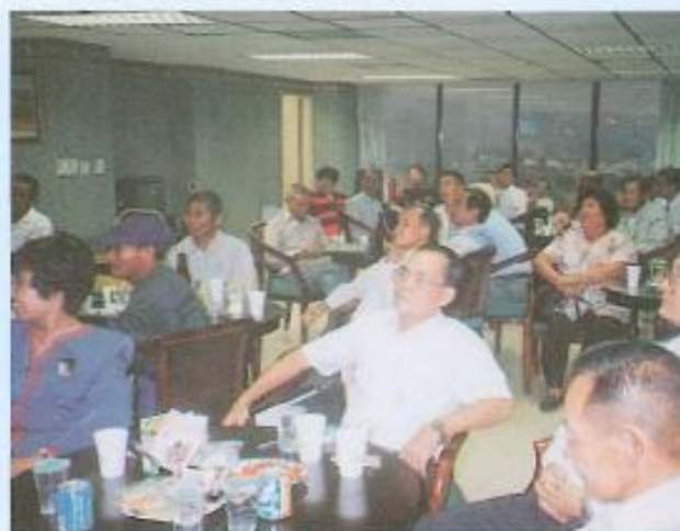
▲卡拉 OK 聯歡之一。