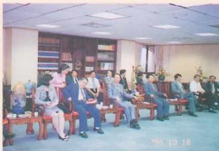
▲貴賓聆聽黃議長簡報。