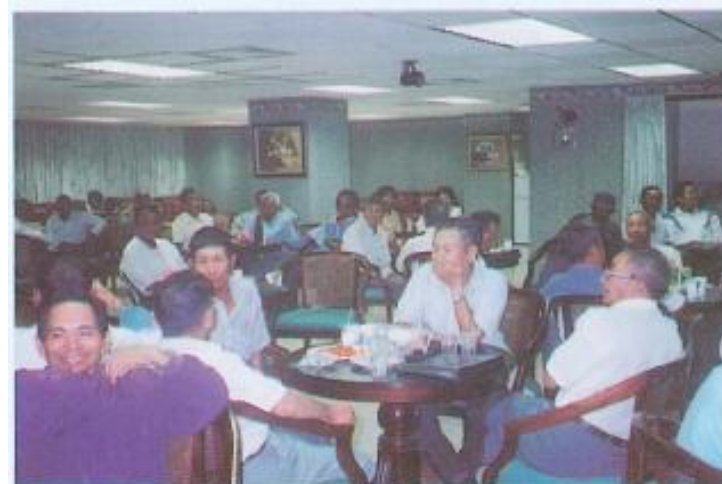
▲卡拉 OK 聯歡之二。