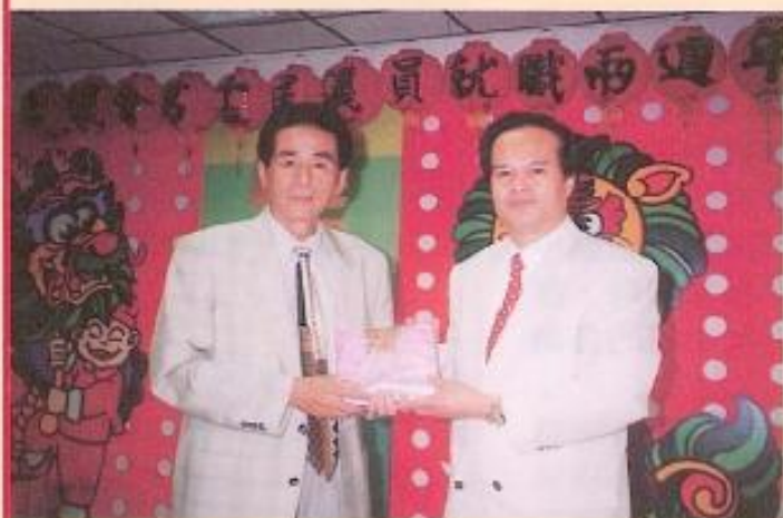
▲新竹縣議會由議長黃煥吉率團蒞會訪問。