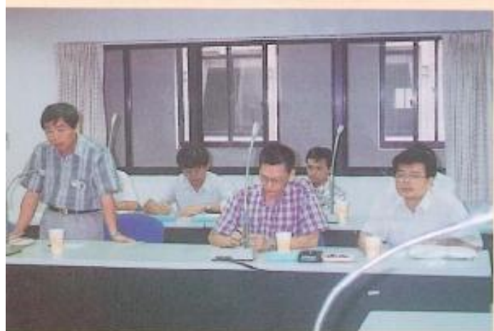
▲林園工業區環保案。