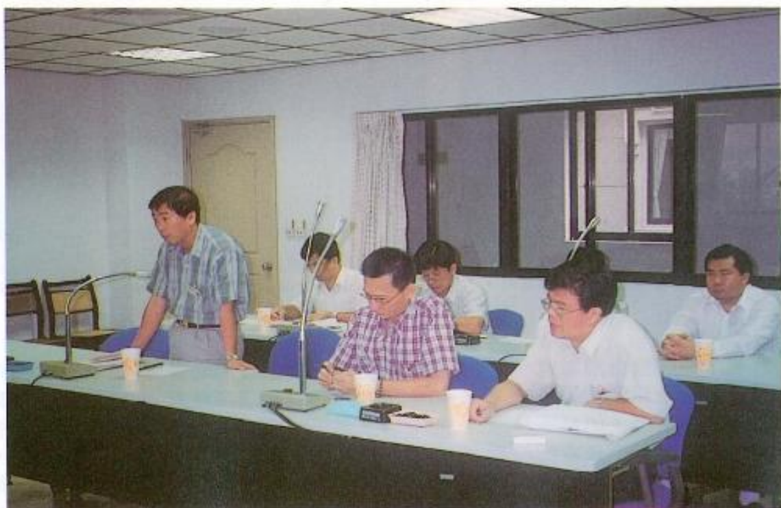
▲高雄縣政府逕行宣佈石化廠擴建案要解凍了。