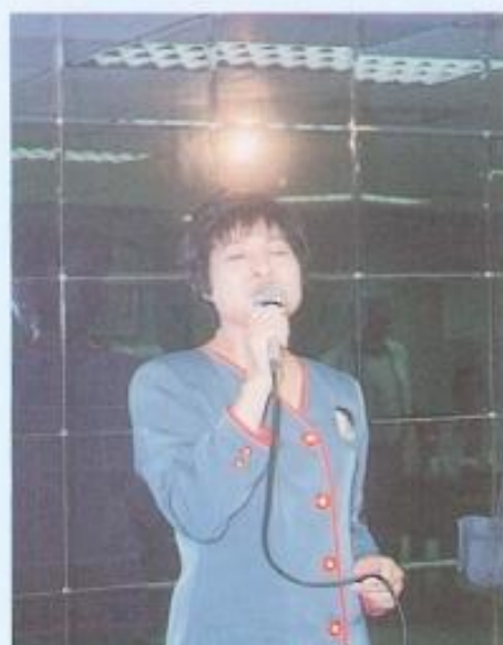
▲陳副議長夫人同樂。