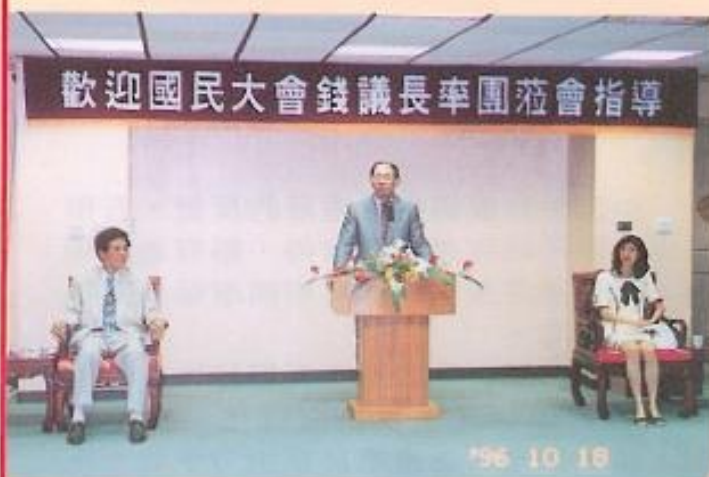
▲國民大會議長錢復率縣籍國大代表蒞會參訪。