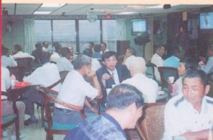
▲湖內鄉海山、海埔村之村鄰長、社區委員蒞會參訪。