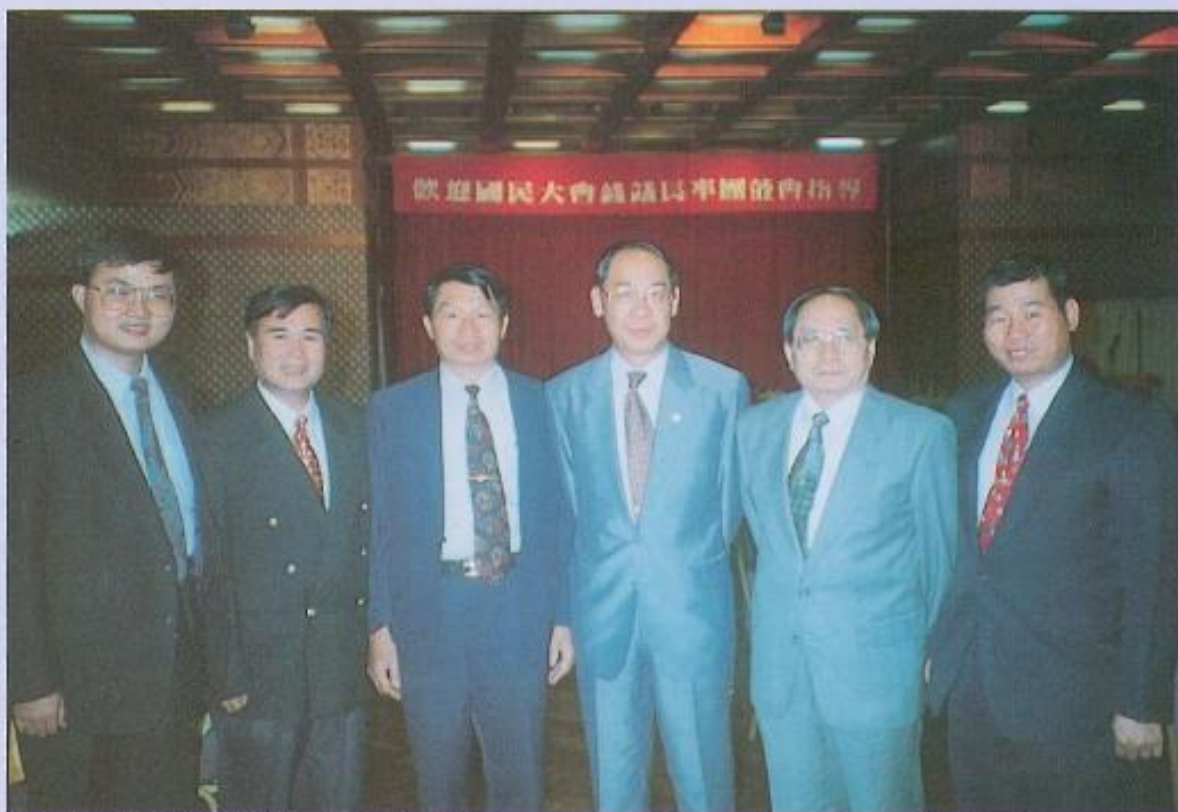
▲國民大會議長錢復與本會同仁合影。