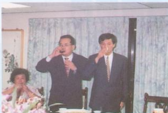
▲縣長余政憲蒞會致意。