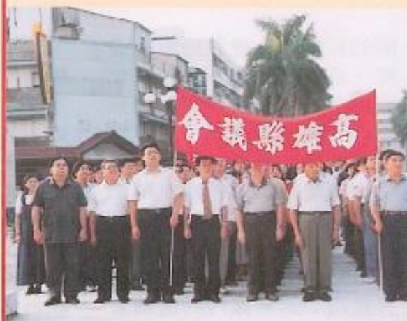
▲本會同仁至縣府參加國慶升旗典