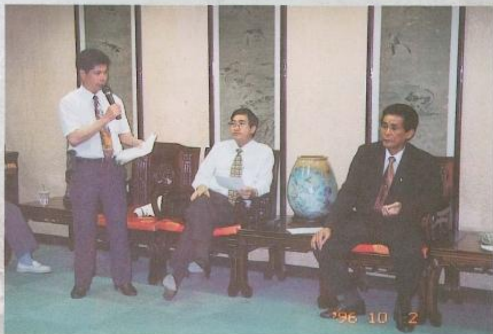
▲黃議長聆聽垃圾山附近居民的心聲。