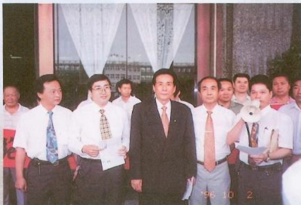
▲黃議長於百忙中接見鳳山五甲地區的陳情民眾。