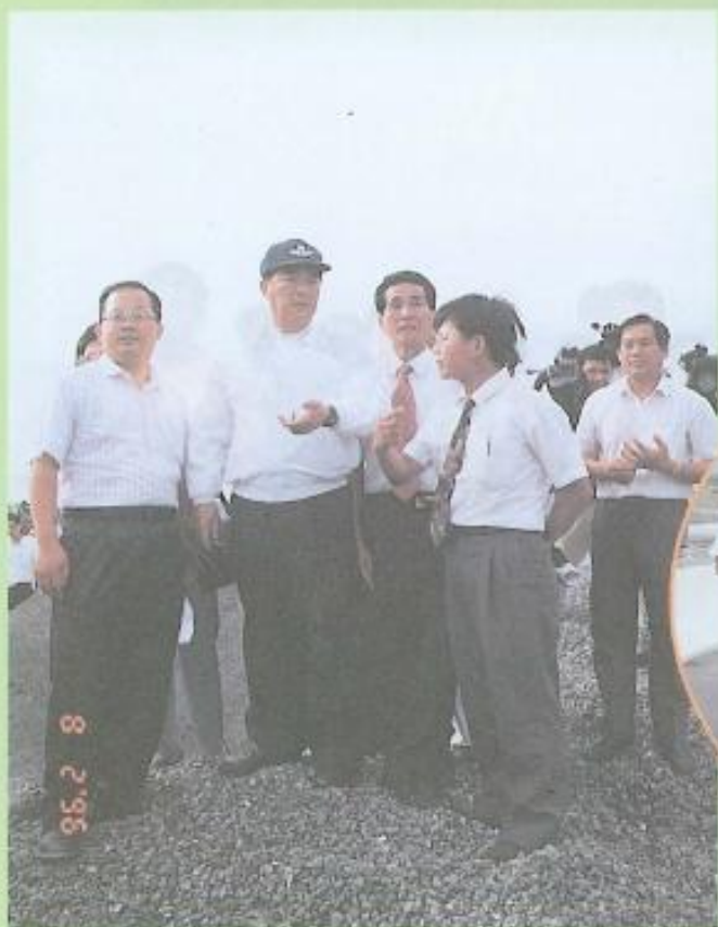
◀省長宋楚瑜關心嚴重災情 親臨本縣了解地區受災狀況

此次強烈颱風賀伯肆虐全台後，本縣旗美和岡山地區紛紛出現嚴重災情。高美大橋因老濃溪水位暴漲，橋面有極明顯的凹陷龜裂，隨時會遭洪水沖垮的危險；旗山鎮東昌里鳳山寺附近，百餘位民衆遭受水困；甲仙大橋被洪水淹沒，造成交通完全癱瘓；旗楠公路溪洲路段，積水將近一公尺，往來交通被迫中斷；岡山典寶溪護岸龜裂，包括蔬菜及香蕉等農作物也有許多被洪水淹沒沖失，災情相當嚴重。