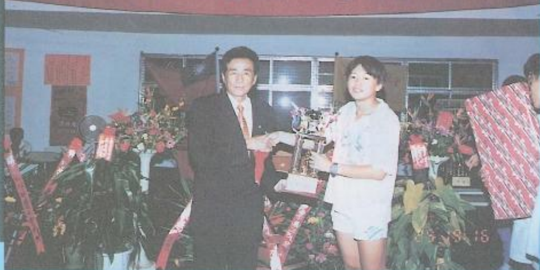
八十五年議長杯羽球賽黃議長頒發團體組優勝【雄中隊】