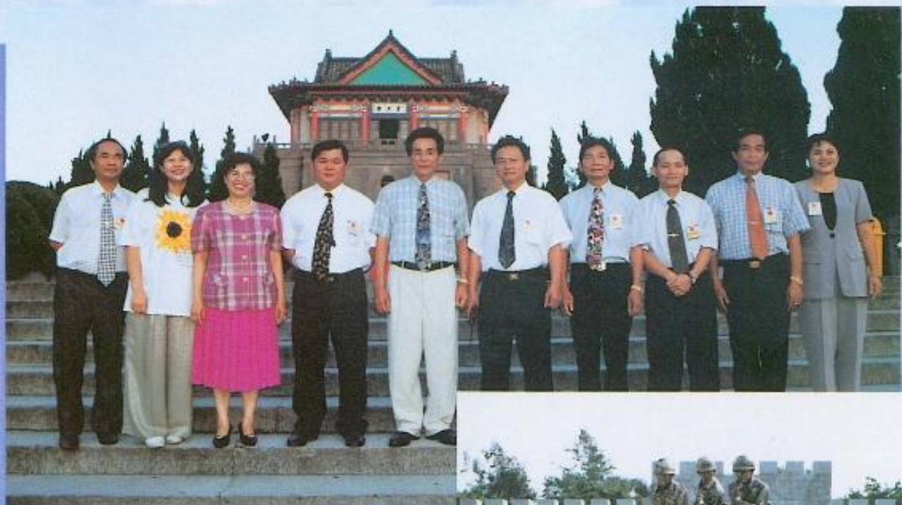
黃議長與勞軍團議員攝於金門莒光樓