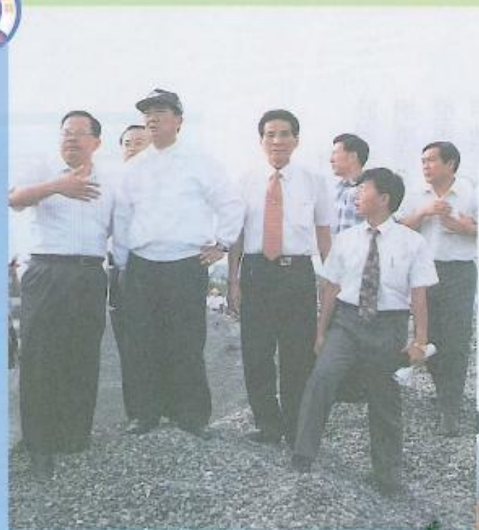
· 宋省長、黃議長及余縣長冒著風雨前往美濃探視災情。