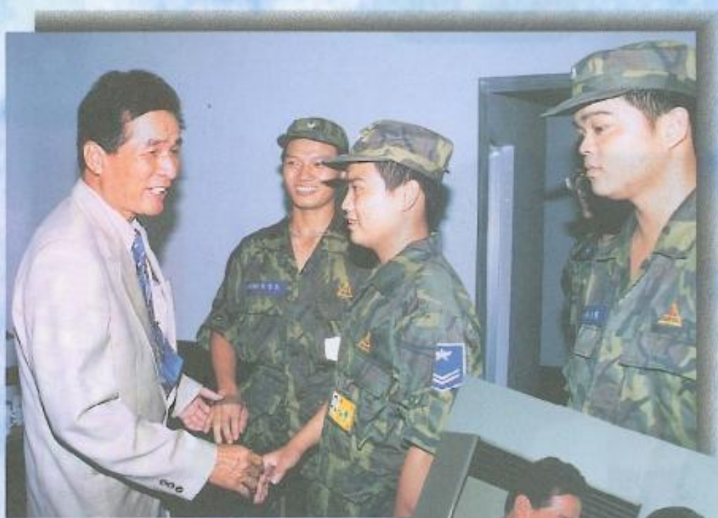
黃議長慰問本縣籍子弟在營生活情形