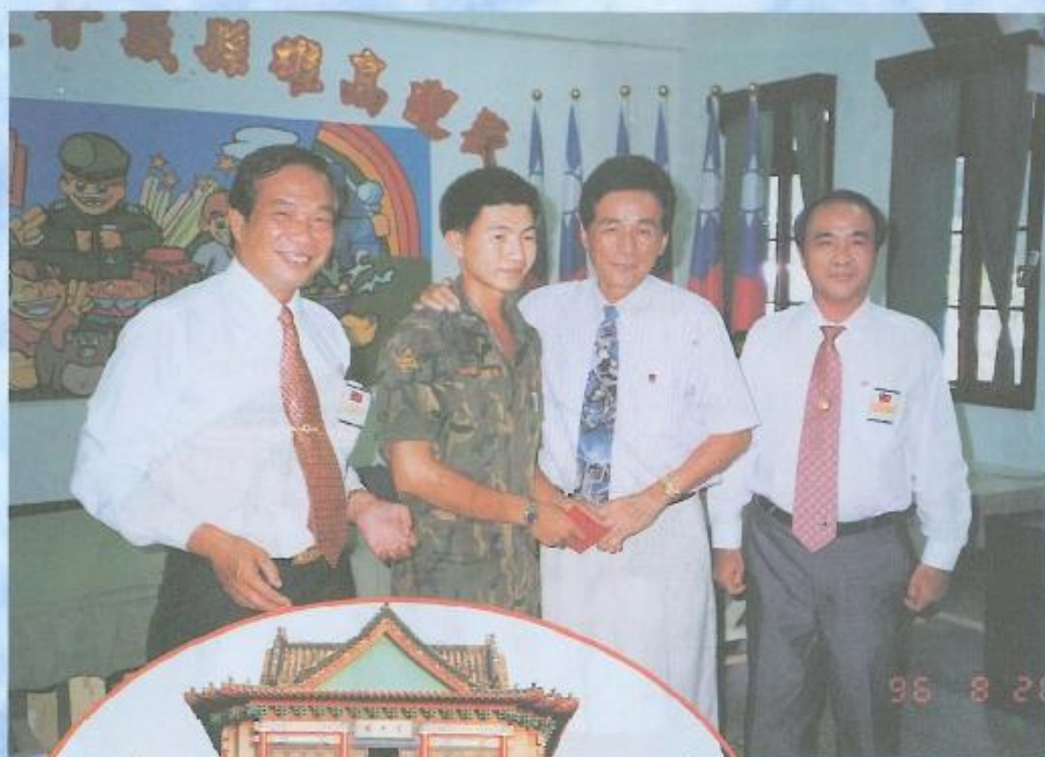
勞軍訪問團參觀金門莒光樓後合影