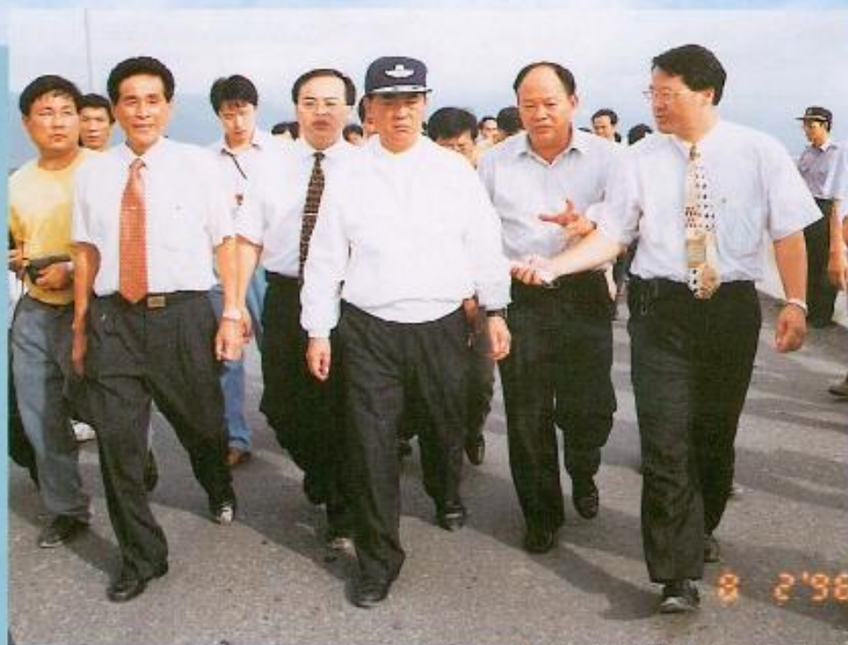
地方首長向宋省長報告賀伯颯風災情