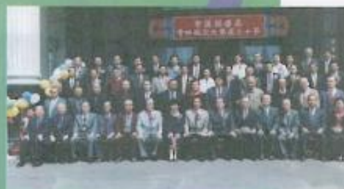
第十三屆議員就職二週年合照