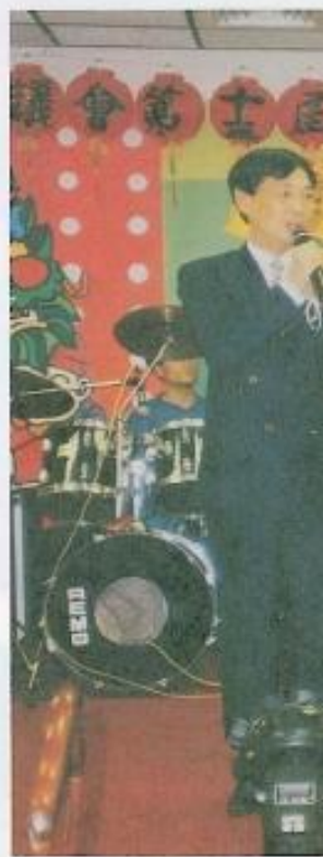
● 副議長於餐會上致詞