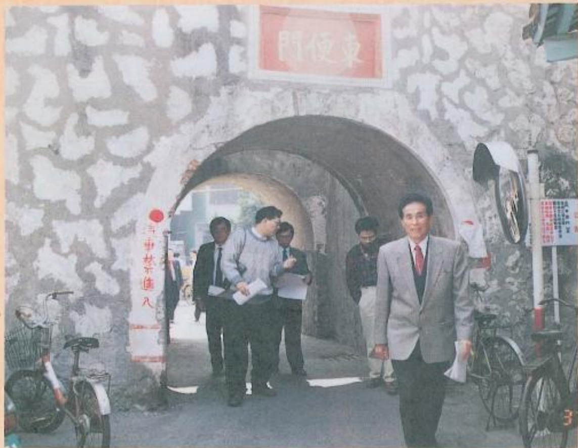
● 黃議長徒步瞭解東便門

在中國城牆建築配套上，城門、石橋與土地公廟是一種民間信仰結合防禦工事，祈求國泰民安的心靈象徵，因