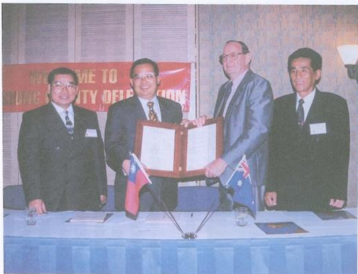
· 吳議長、黃副議長參加簽約儀式留下歷史見證。

台灣的經濟奇蹟，受到世界各國的讚許，因而此次締盟也受到澳洲各大媒體爭相報導，爲我國拓展實質外交工作又邁向前一步，寄望此次的締盟是友誼的開始、交流的開流、互惠的開始，而不是結束。把台灣經驗介紹給各國