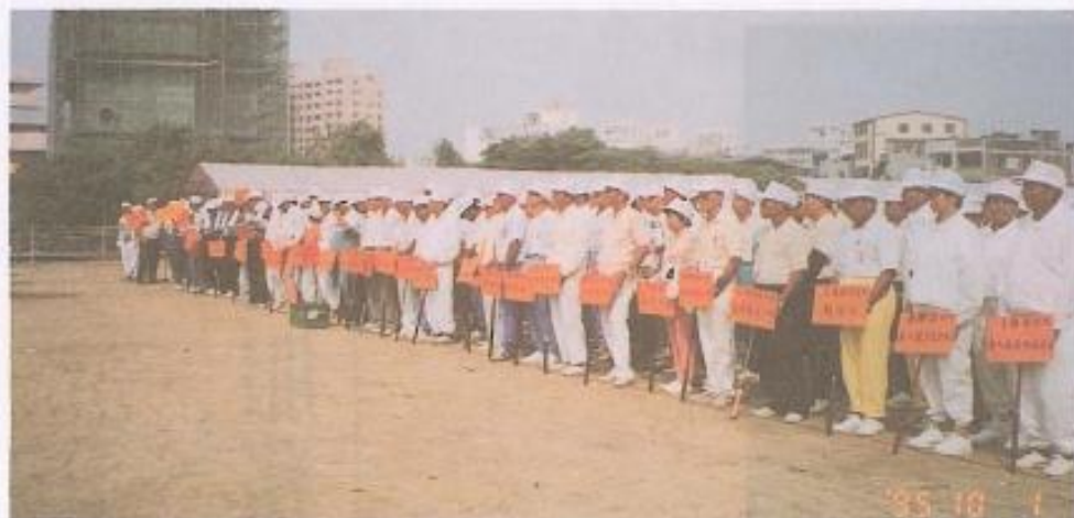
· 本屆議長杯槌球錦標賽報名參加隊伍非常踴躍。