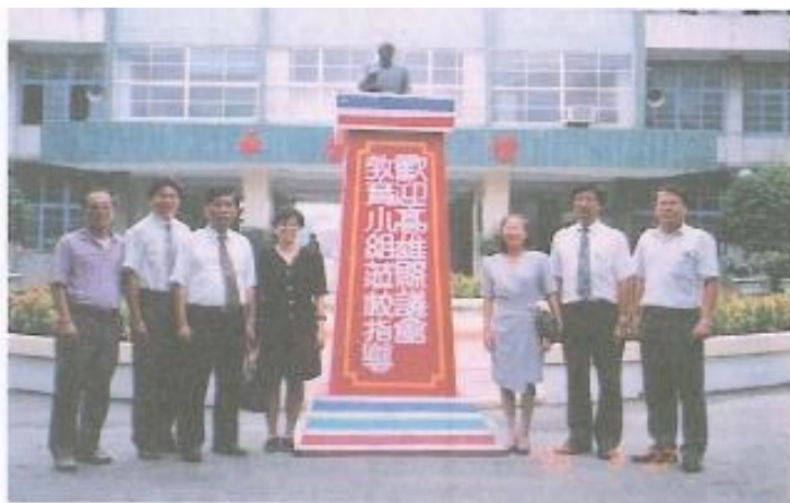
· 葉香議員訪母校路竹國中，建議縣議府補助經費整修學校教室。