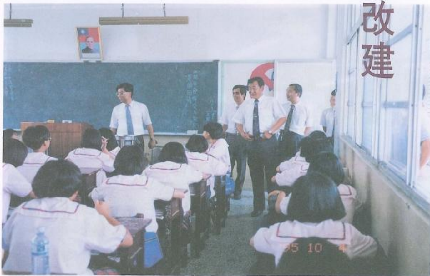
· 教育小組議員訪問大寮鄉中庄國中，了解學生上課情形。

本會教育小組議員爲了解本縣各級學校概況，他們擇期分區訪問本縣各國民中小學，九月二十六日訪問仁武鄉烏林國小，岡山鎮岡山國小，阿蓮鄉阿蓮國小，田寮鄉田寮國中、古亭國小。九月二十七日訪問彌陀國中、彌陀國小、壽齡國小、湖內國中、大社國小、路竹國中。十月三日訪問鳳山市文山國中、中山國小、鳳西國小、中正國小、大東國小、鳳西國中。十月四日訪問大寮鄉永芳國小、大寮國中、潮寮國小，林園鄉林園國中、中芸國小、港埔國小。十月五日訪問大樹鄉大樹國小、九曲國小、水寮國小，仁美鄉仁美國小、烏松國小、大華國小。十月二十三日訪問旗山鎮旗山國中、溪洲國小、旗尾國小，美濃鎮美濃國小、東門國小、龍旺國中，六龜鄉六龜國小。十月二十四日訪問六龜鄉寶來國中、寶來國小、老濃國小，甲仙