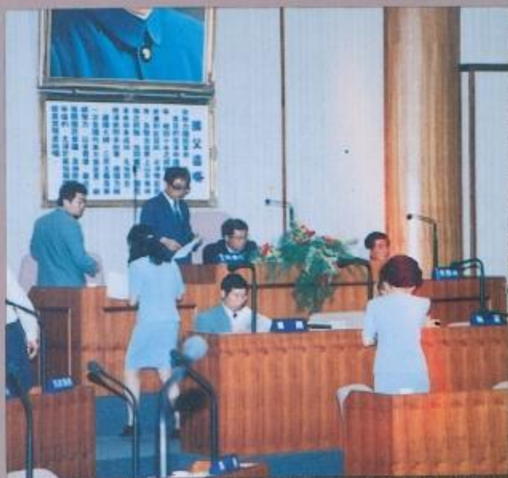
· 議會各工作同仁以最佳服務做好議會第十三屆第四次定期大會的工作。