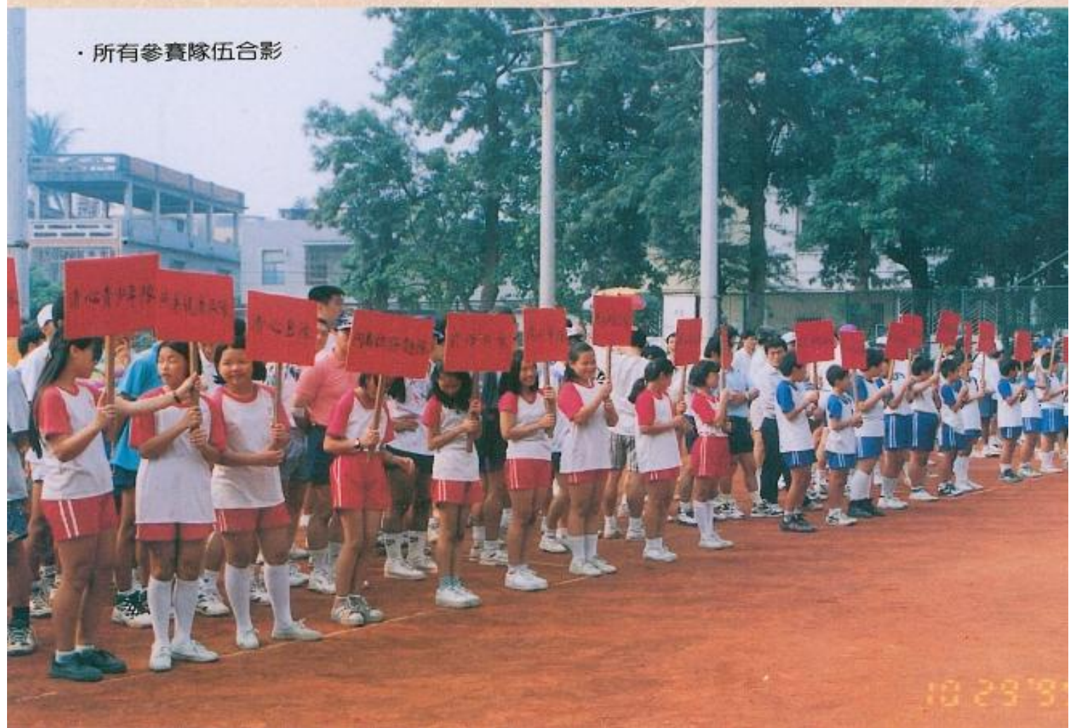
· 所有參賽隊伍合影