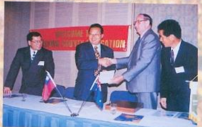
· 吳議長、黃副議長參與締結姊妹縣簽約儀式