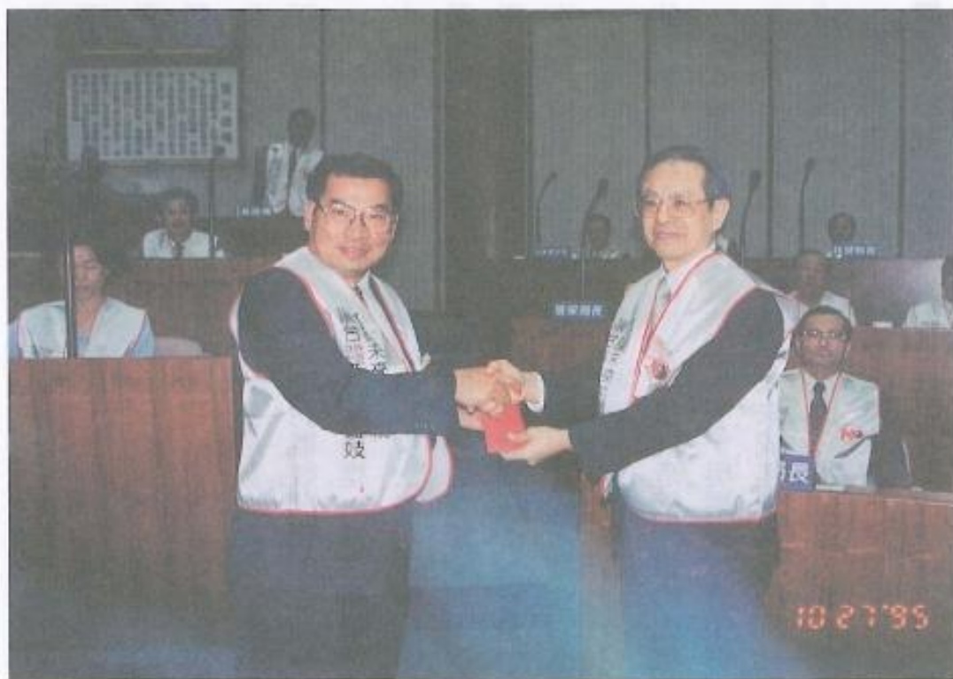
· 吳議長致贈勵馨文教基金會反雛妓運動贊助基金，由該會商董事長代表接受。

「反雛妓運動」。除監督、質詢相關單位落實「兒童及少年性交易防制條例」，並帶頭響應「不找未成年女生」之社會行動，以昭示保護下一代人權之決心，率先建立新世代的公共關係與應酬文化，還給下一代清新的人性成長空間，故本縣全體議員一致主張：