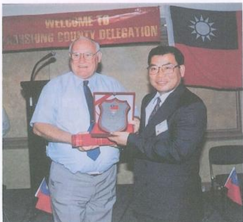
· 吳議長與凱英斯市長對於促進兩國友好關係貢獻良多。