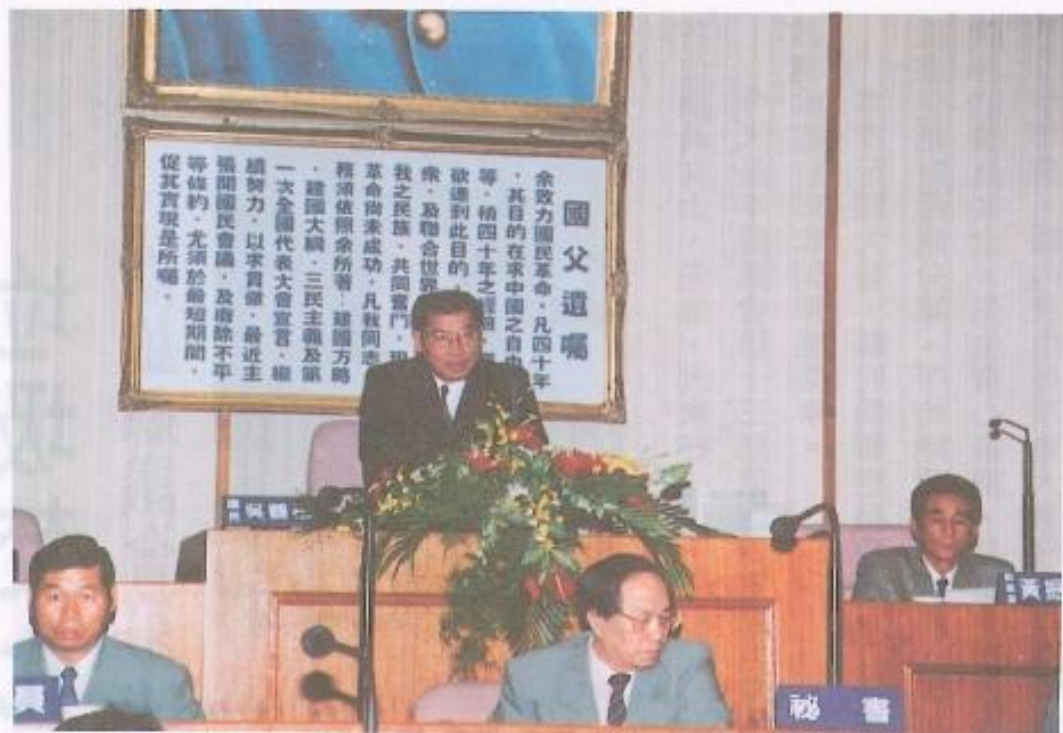
· 高縣縣議會在第十三屆議會中，審議多項攸關縣民民生提案。

，令人贊許，希望各位同仁以同樣的心情予以支持，也盼望縣立醫院借此利人利己措施，加強服務病患，以期提升就診率，促使醫療業務蒸蒸日上，為醫院的聲譽揚眉吐氣，又其他無論縣政府提案或同仁提案，仍皆與縣民權益與福祉息息相關，因此務請各位同仁踴躍參與審查工作，秉