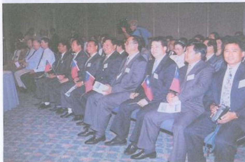
· 本會議員參與締結姊妹縣簽約儀式。

澳洲朋友認識之後表示：「此次訪問團來北昆士蘭省的目的，希望能在農業、工商業、經貿等方面多看看、多學習，考察投資環境，增加投資管道，同時也希望金·查普曼縣長有機會再蒞臨高雄縣，促進雙方的實質交流。」接著由吳議長致詞：「感謝乃歐米·威爾生議員、林瓦力克議員蒞臨及金·查普曼縣長、湯派市長等竭誠歡迎，謹代表高雄縣議會致萬分謝意，高雄縣原為農業縣，近來由於工