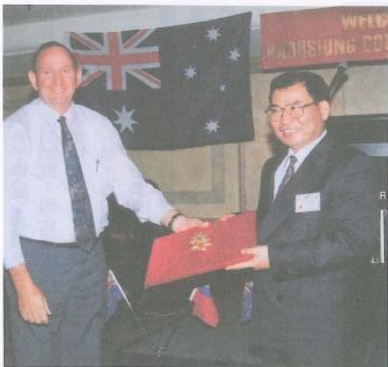
· 澳州北昆士蘭省金·查普曼縣長致贈吳議長紀念品。

長及參加締盟典禮議員的見證下，完成了簡單隆重的簽約儀式，從此澳洲北昆士蘭州凱恩斯等八都市已成爲本縣第四個姊妹縣（另外三個爲美國金縣、印尼比通市、德國安納堡縣），典禮結束後所有與會來賓合影留念，並接受當地媒體記者採訪，留下歷史的見證。晚餐於希爾頓大飯店由余縣長設宴回請之後，雙方貴賓互道珍重再見。