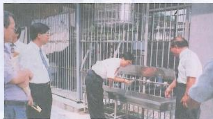
·教育小組議員對學校飲水設施是否乾淨甚表重視。