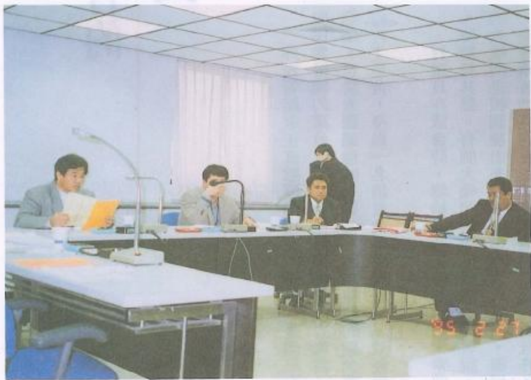
· 張正信議員對環保及弱勢團體的問題非常注重。

回報，就是看見民衆因他的努力，而把問題解決後所露出的笑容，這便是他最大的滿足。目前他最大的希望，就是持續地爲民服務下去，他還有很多理想、政策還要實施，他盼望民衆再給他更多的時間，好讓他一步一步去實踐它。