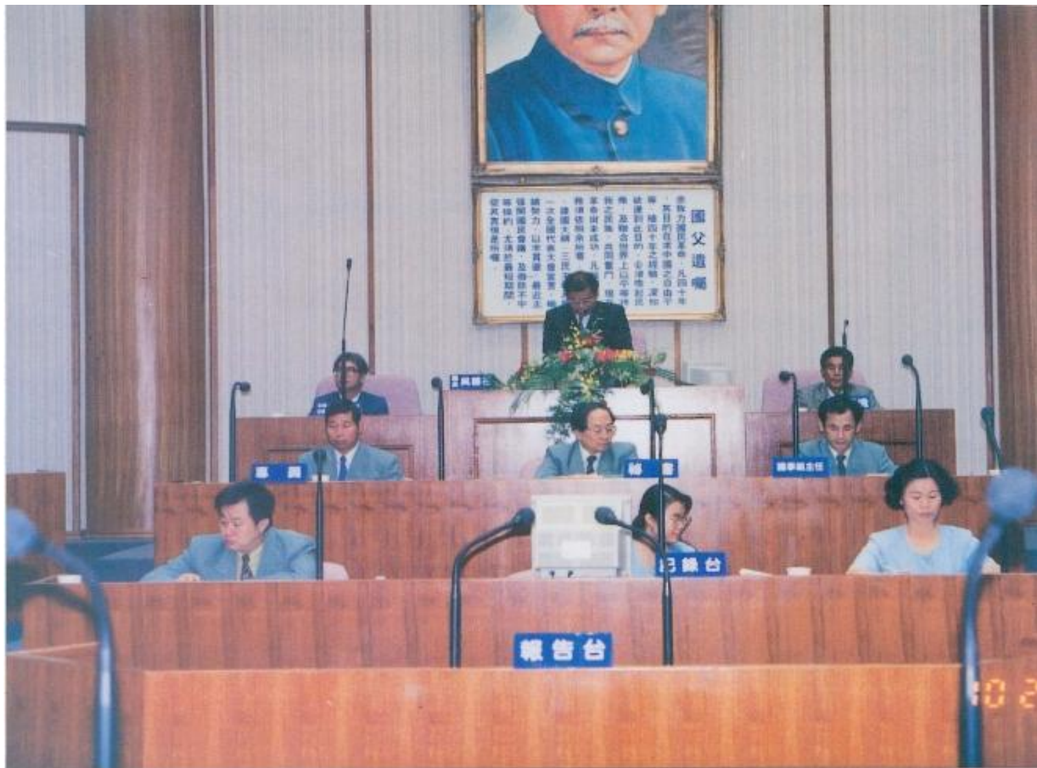
· 第十三屆第四次定期大會開幕典禮。