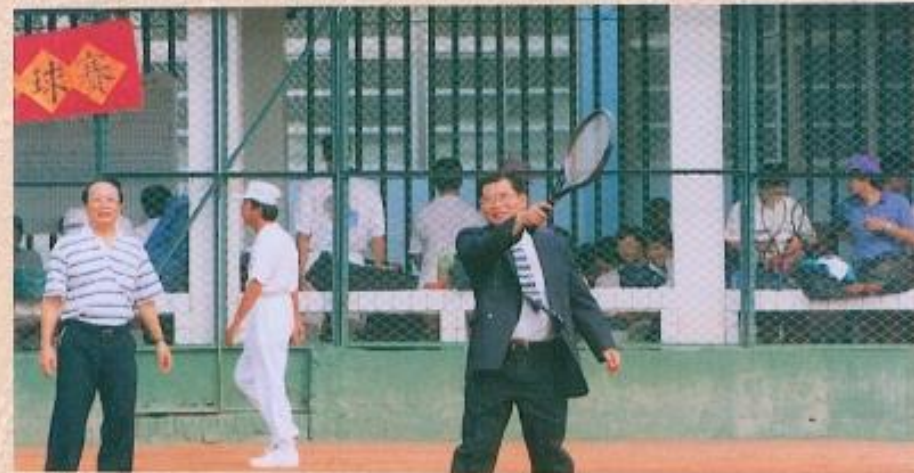
· 議長主持開球典禮