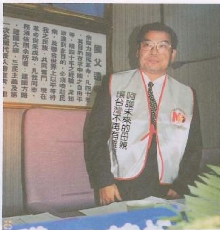
· 議長響應反雛妓運動。