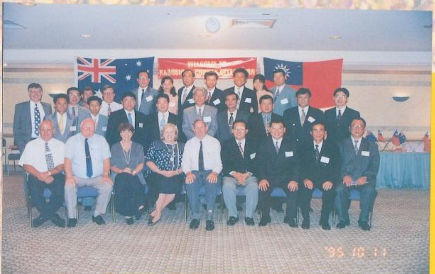
· 吳議長暨黃副議長以及訪問團議員、工作人員在歡迎會後合影留念。