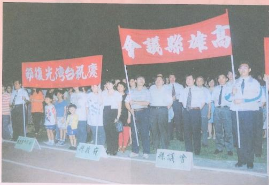
· 本會參加「飛躍五十，邁向二十一世紀」的慶祝活動。

今年是台灣光復50週年，所以各界在光復節前後熱烈展開各種慶祝活動。本會為響應這個全民歡欣的日子，特別派隊參加各項「飛躍五十，邁向二十一世紀」的活動。