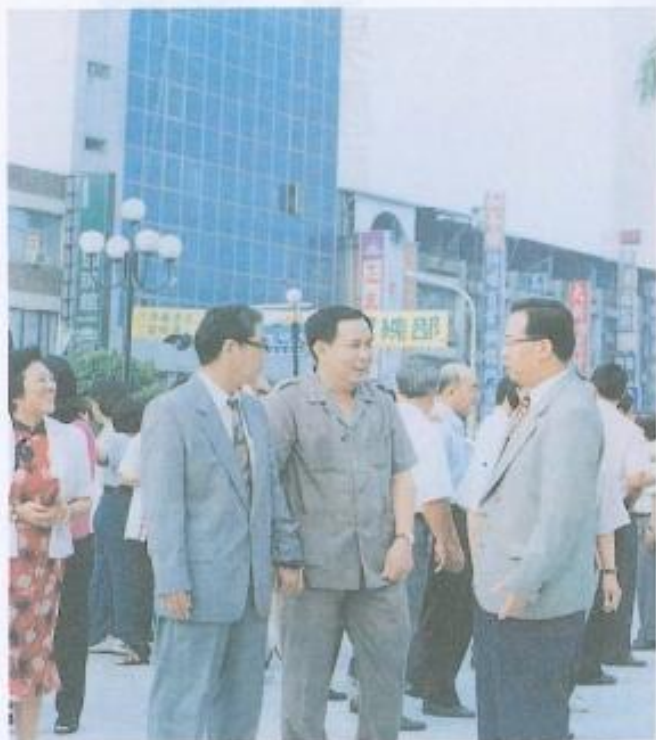
· 雙十國慶升旗典禮由縣長余政憲主持。

雙十國慶升旗典禮於上午七時舉行，縣長余政憲主持，包括縣府主秘林啓智、各單位主管、鳳山市長林龍瑞、警察局長王進旺、救國團高雄縣團委會總幹事歐高福、及各機關、學校首長、代表，共三百餘人參加。