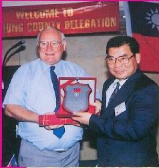
· 吳議長與凱英斯市長對於促進兩國友好關係貢獻良多。