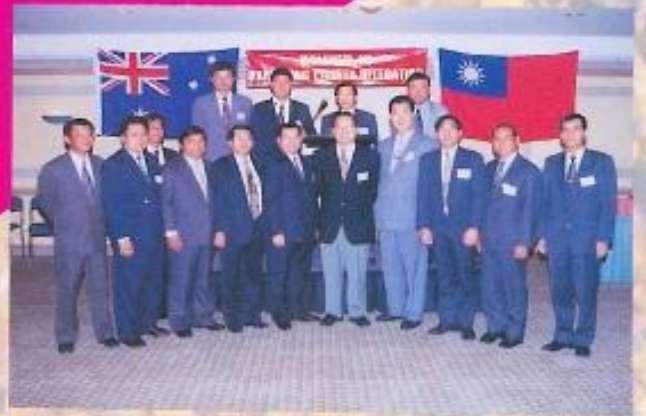
· 余縣長、吳議長及本會議員及各鄉鎮長參與本次締盟盛會合影留念。