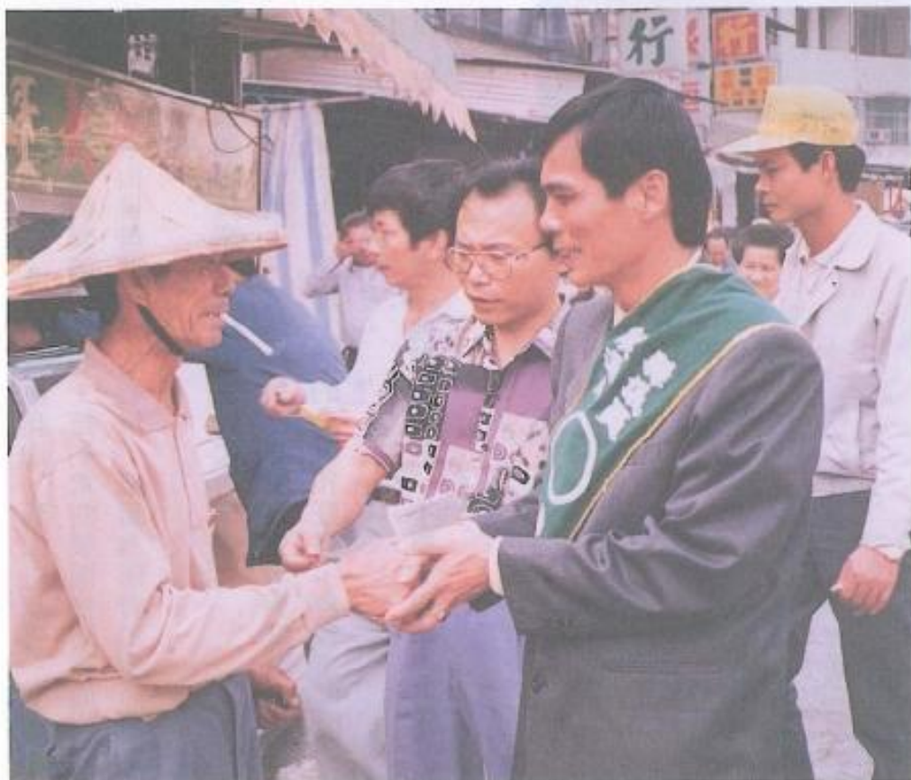
洪添丁議員沒有架子，所以朋友特別多。

洪添丁議員在為民爭權益的時候，總是事先搜集許多資料，問政時條理分明，因此縣府官員對他都非常尊敬。