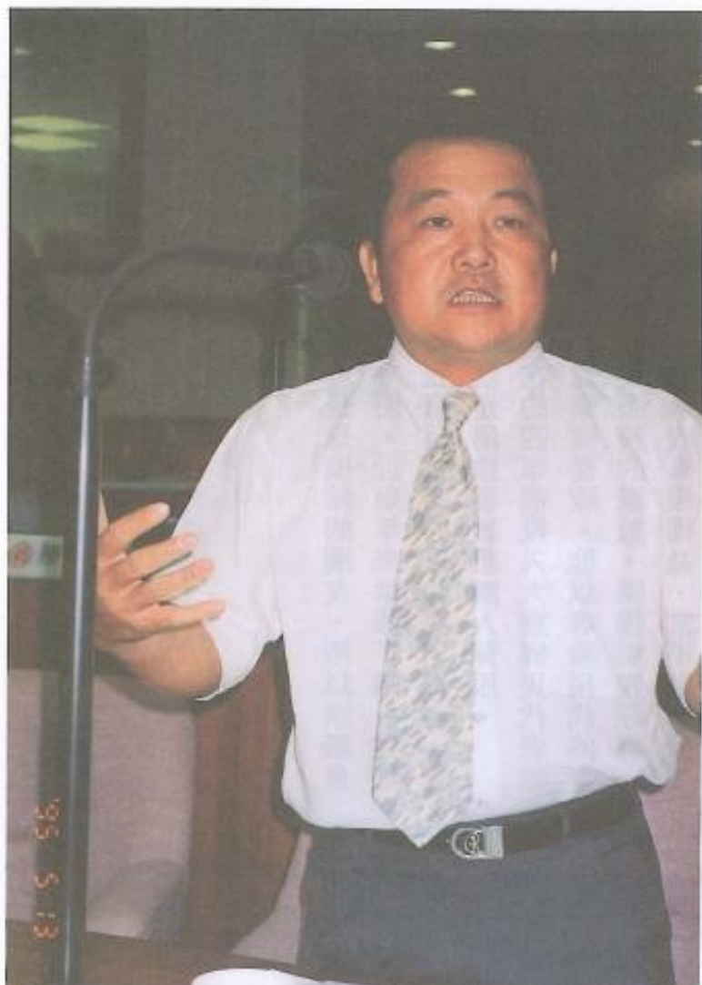
■葉進國議員最重視環保及污染問題。

除了環保問題外，葉議員對於勞工的權益、農民的福利、縣政的公共建設、民生用水的改善以及弱勢團體的福利等，議題都相當的重視。除了平常就請助理多方搜集資料外，並且常常親自到現場了解和關心。