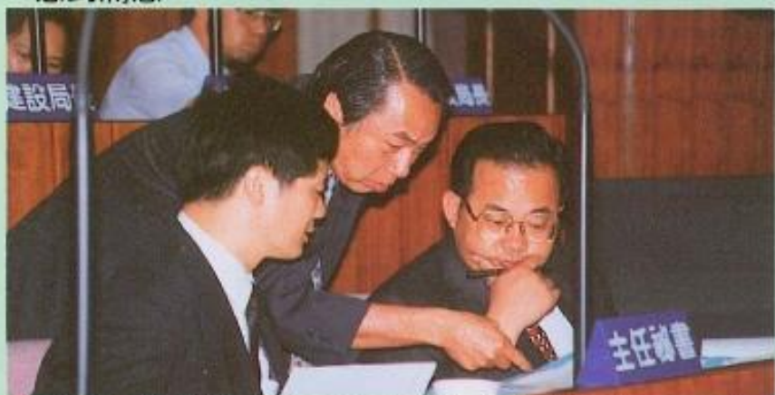
■縣政府對定期大會縣政總質詢都非常的慎重，縣長和各單位一級主管面對議員的質詢時，都小心回答，不敢馬虎。