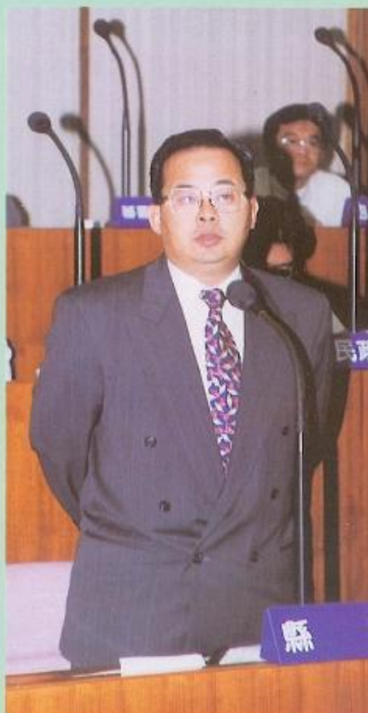
■余政憲縣長感謝議員，對八十五度總預算的支持。