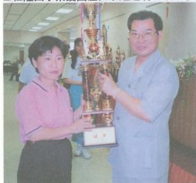
■旗山地政事務所連續三年榮獲機關團體女子組冠軍。