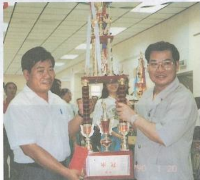
■仕隆國小榮獲團體女子組連續三年冠軍。