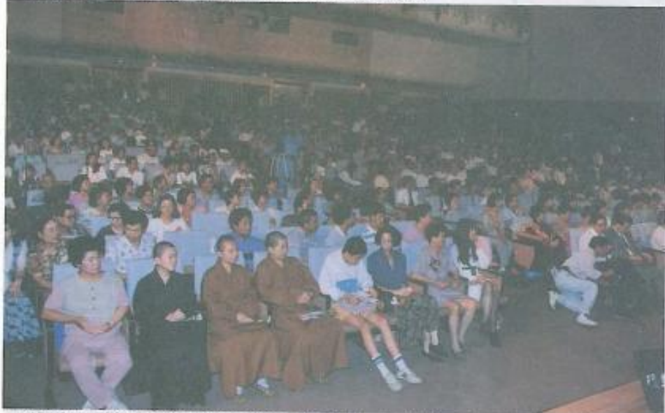
■佛光山的師父非常支持「表揚十大傑出愛心媽媽」的活動。