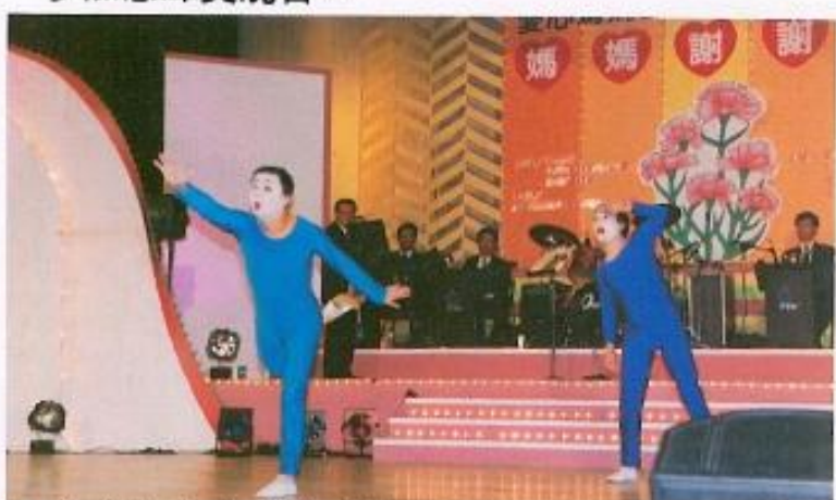
聽障朋友表演的默劇，不但好笑而且富有很深的含意。