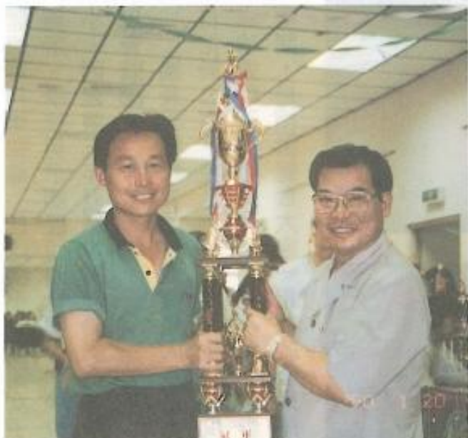
■路竹國民小學連續三年冠軍，男子團體組精神總錦標。