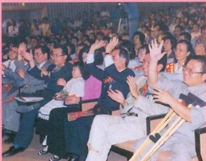
■ 參加第二屆十大傑出愛心媽媽表揚晚會的來賓非常的踴躍。