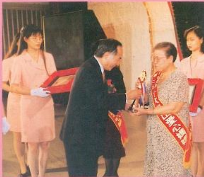
■ 立法院副院長王金平特地參加慈暉獎表揚會並且頒獎給愛心媽媽。