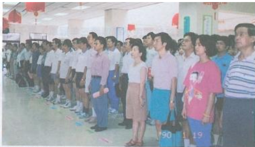
■參加比賽球隊共53隊