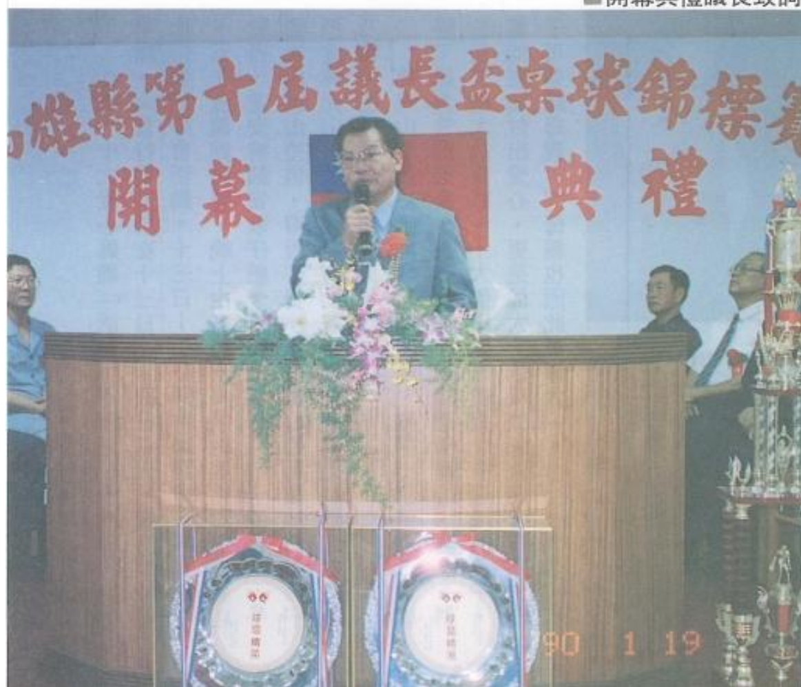
■開幕典禮議長致詞

球賽自五月一日起至二日止，連續舉辦二天。參加球隊計七十一隊，七百六十三人。包括團體賽民意機關組十隊，一百零一人；機關男子組二十三隊，二百二十九人；機關女子組十四隊，一百一十一人；學校男子組十八隊，一百七十八人；學校女子組六隊，四十八人，計七十一隊，六百六十七人。連同民意機關男子個人賽六十四人，民意機關女子個人賽三十二人，總計參加人數七百六十三人。經過二天龍爭虎鬥、精采萬分的比賽，於五月二日中午頒獎閉幕，男子團體組精神總錦標：路竹國小，女子團