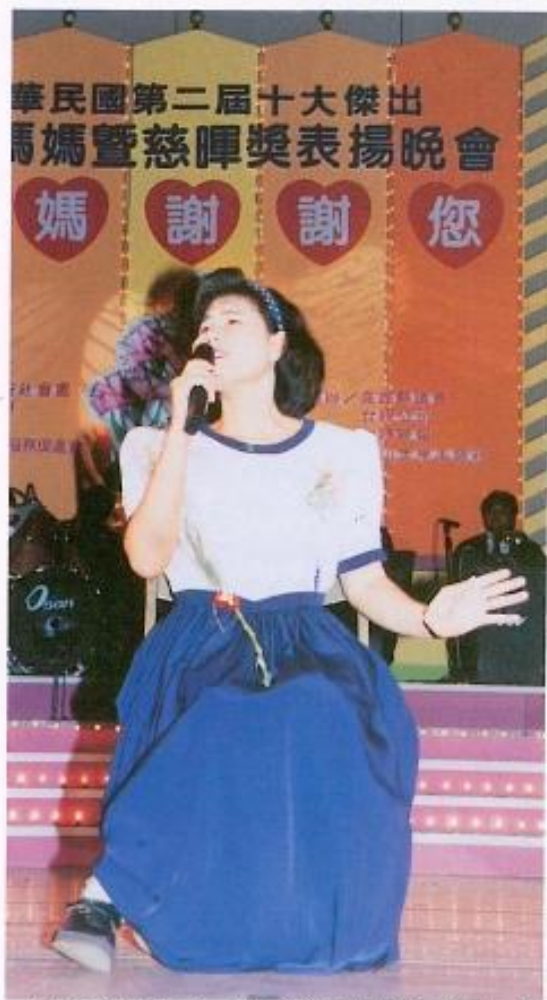
殘障朋友的才藝獲得所有參加晚會者的讚賞。