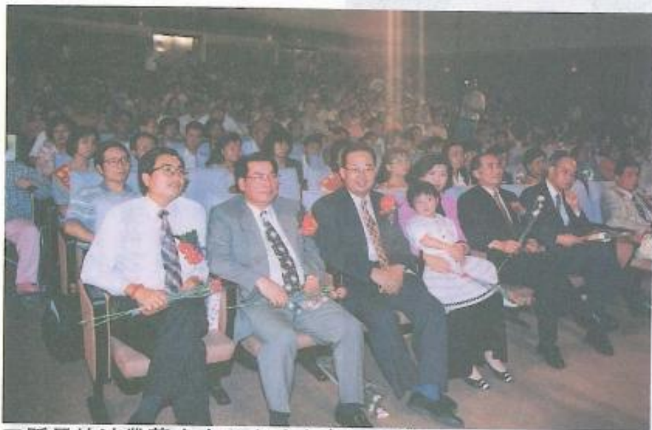
■縣長特地帶著太太和小孩來參加晚會。