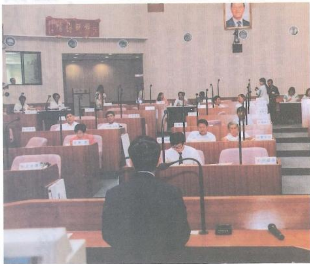
■高雄縣議員對於高雄市規劃的捷運系統沒有考慮高雄縣的需要非常不滿。

事實上高雄都會區捷運自規劃到定案，共歷時近十年。高市捷運局從籌備處成立到正式成為市府一級單位也已五年，所有路線規劃等都以高市為核心，配合南北狹長的行政區興建，一開始並未將緊鄰的高縣放在眼裡，後來因主