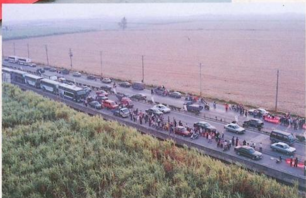
▲ 交通便捷、幅員寬廣、條件優渥的「路竹基地」。