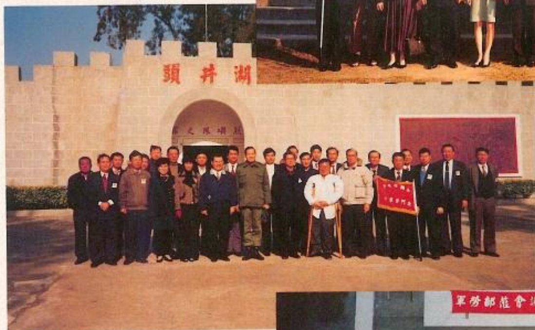
◀ 勞軍訪問團訪問烈嶼 湖井頭守軍。