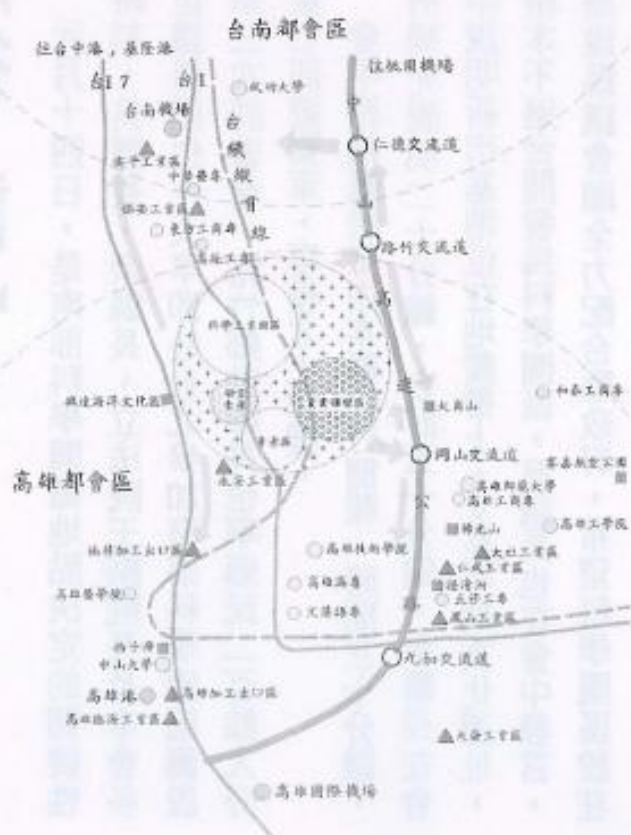
路竹科路竹科學工業園區初步發展構想圖