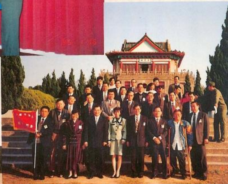
▶ 本會金門勞軍訪問團 攝影莒光樓。