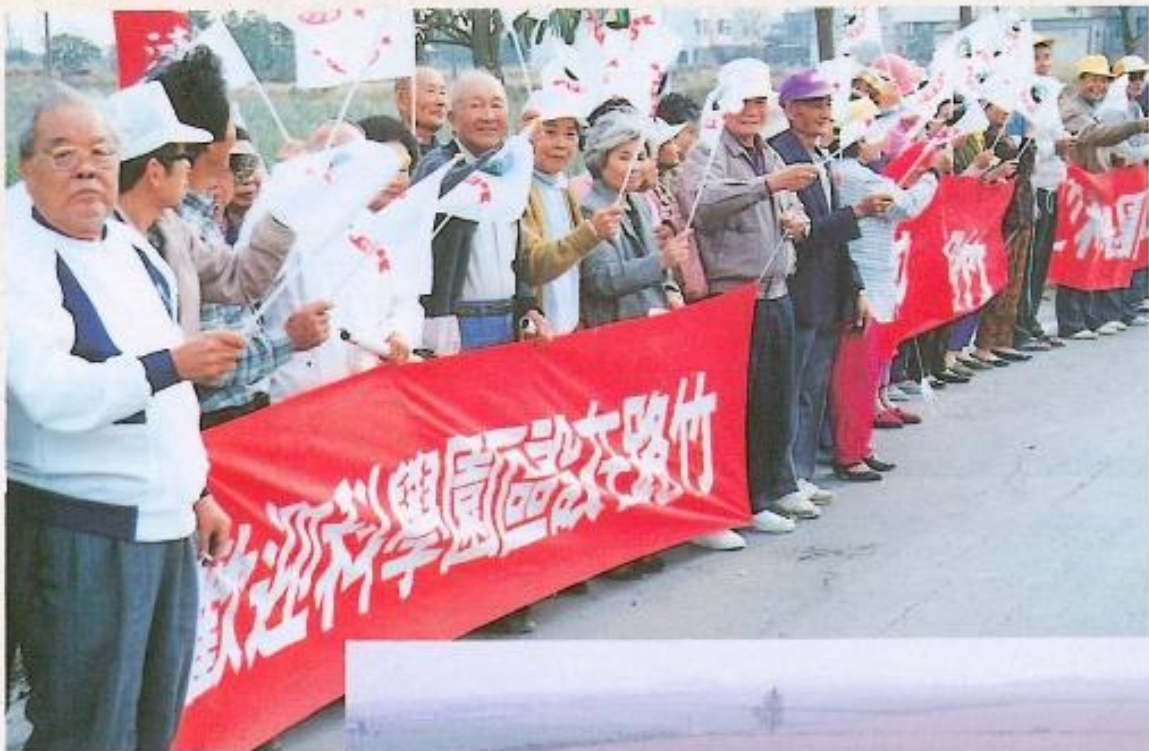
▲ 園區在路竹基地設立。 高雄縣民攜老扶幼，一同聲援南部科學