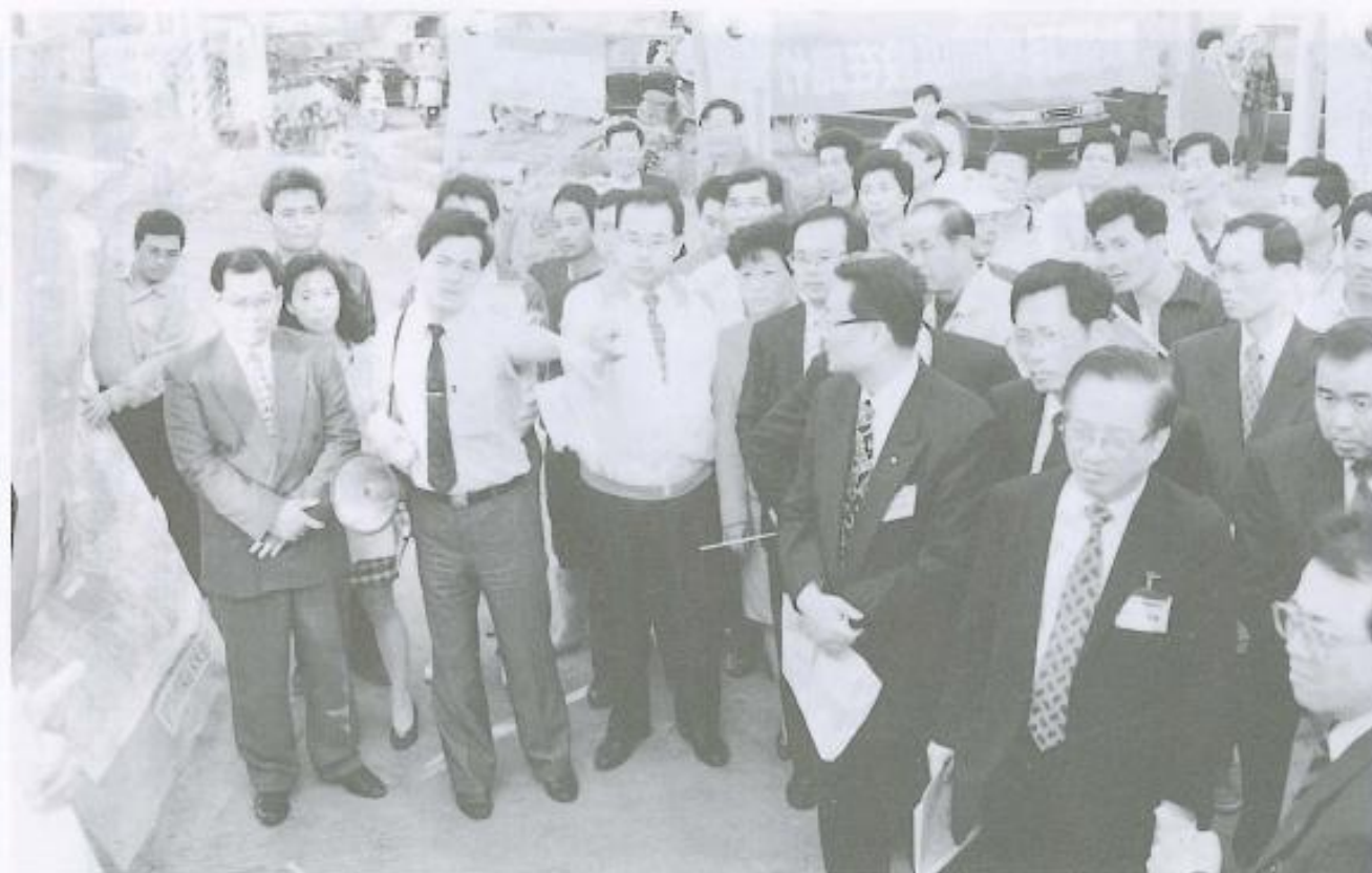
▲縣長與縣議員偕同「南科計畫」小組等學者、專家，聽取「路竹科學工業園區」發展簡報。