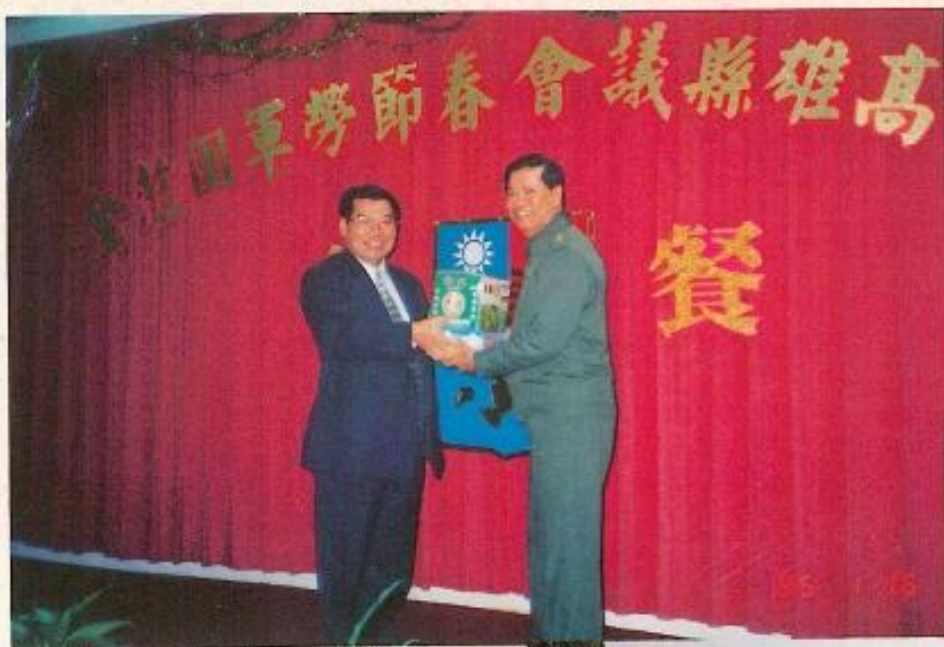
◀ 吳議長與金門顏司令官合影。