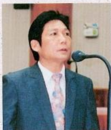
李 往 議員