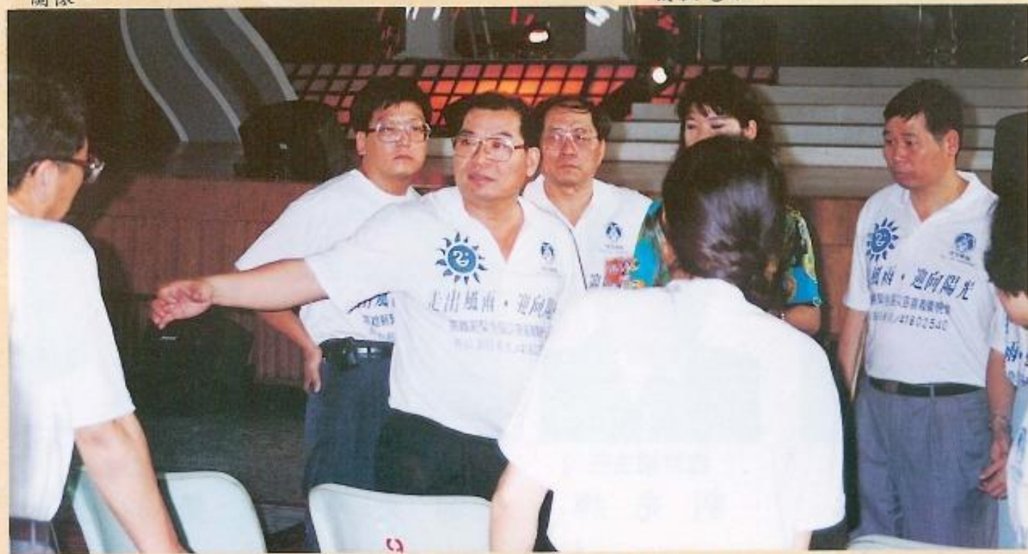
▲賑災熱線人員忙著接來自全國各地的捐款電話。