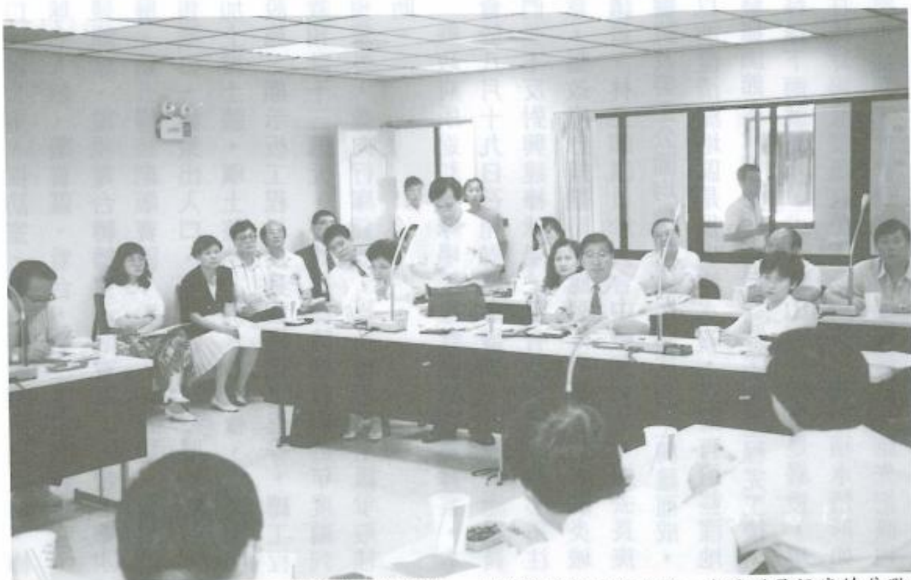
▲颱風來襲期間，剛好遇上議會臨時會開會，有關防範颱風的意見，成為議員提案的焦點。

綜觀此次臨時會，計審查民政類提案十二案、財政類提案九案、建設類提案四十九案、教育類提案八案、保安類提案八案、農業類提案五案、及臨時動議案四十七案，共計一三八案。其中縣政府提案二十五案，議員提案一一五案，及成立十組專案調查小組，可謂成果豐碩，所有議決案，議事組已於大會結束後以最速件，函請縣政府依決議事項辦理。