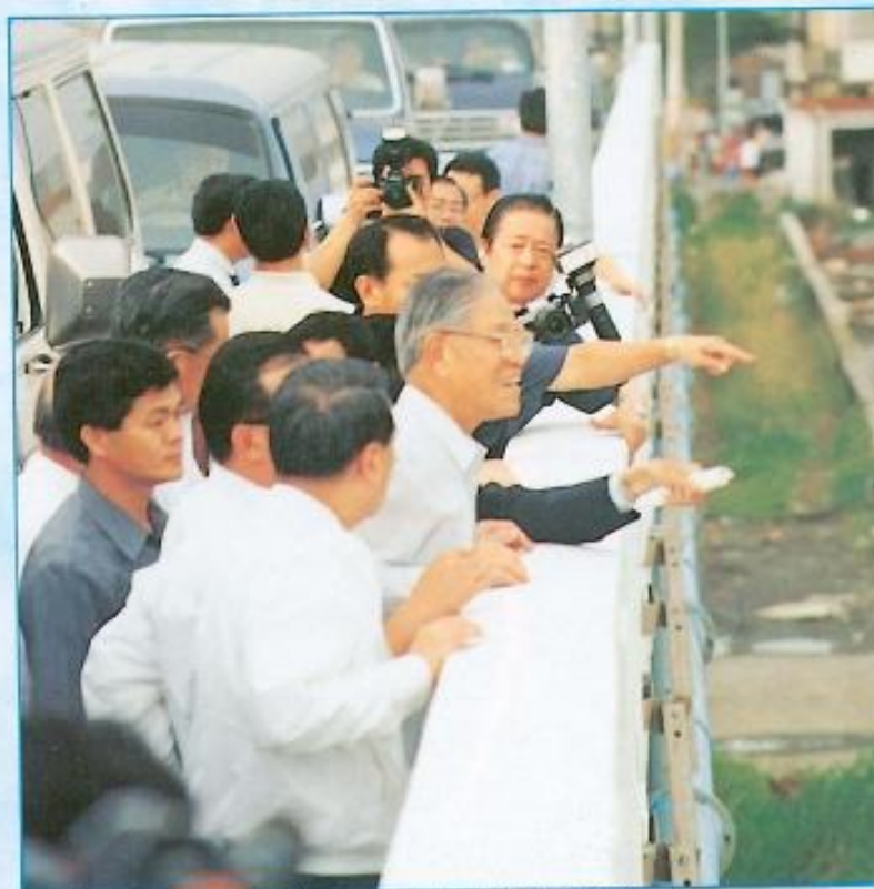
▲高雄縣水災震驚全國，李登輝總統親到災區探視。