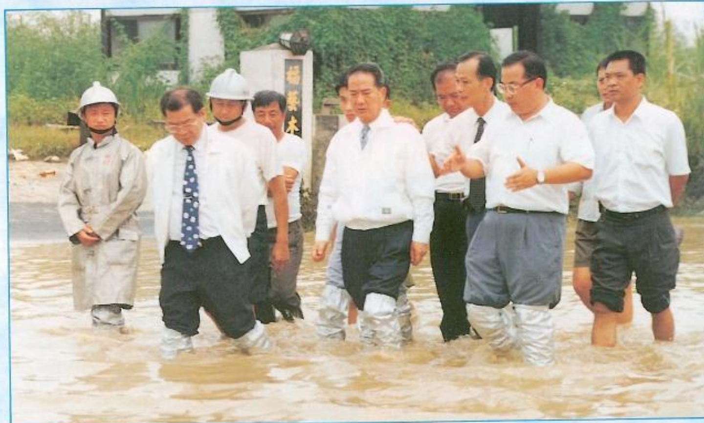
▲台灣省主席宋楚瑜五度探訪災區，關懷災民之情，溢於言表。