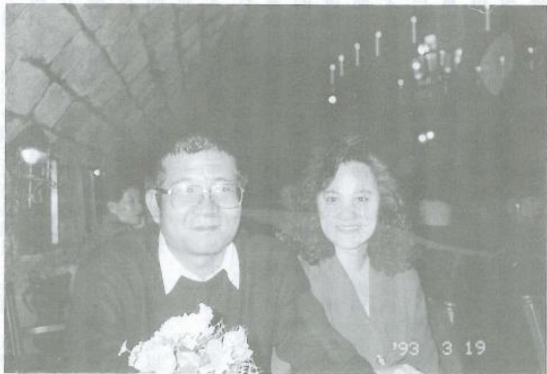
▲林崑漢議員夫妻情深。

該共同努力奮鬥，為下一代爭取一個未來美好的希望，加強環保，提供給民眾一個生活品質無憂慮的環境，是身為民意代表的職責，在縣議會中，他將與其他縣議員共同為這個目標努力打拚。