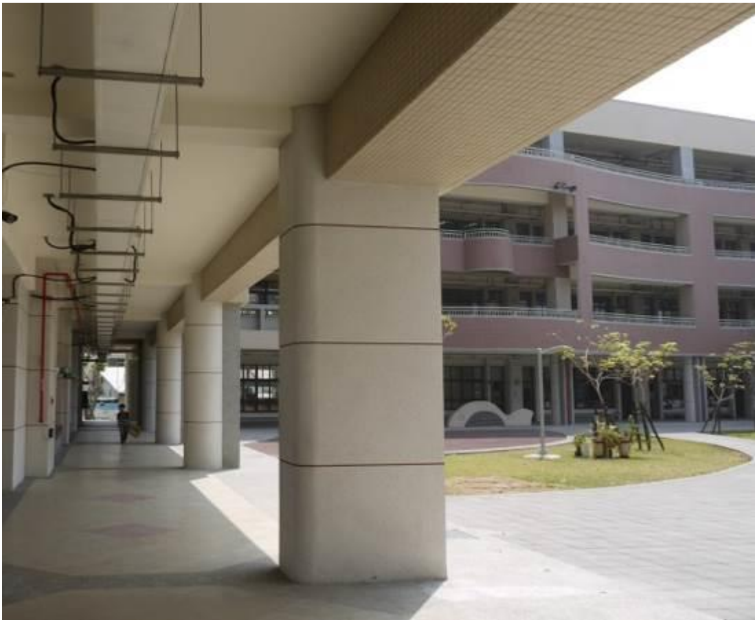
圓柱及方柱邊導圓角