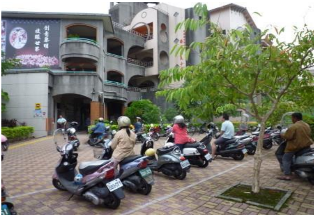
設置家長接送停等區域