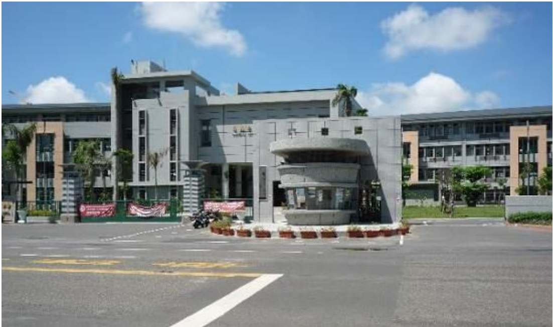
校園入口人車分道