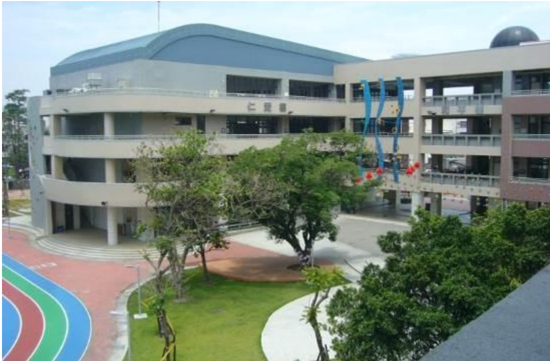
開放空間無校園死角

3、社區可及性的校園規劃。所謂的可及性並不是完全開放不設限，因為就管理的角度來探討，校園還是必須與校外環境有些區隔，近年來通學步道或是好望角的推廣在建築的思考上可以視為學校與社區的中介空間，除了建議不要設置圍牆外，建議運用綠籬或垂直綠化、植生牆等方式區隔，而透空式圍牆則是次之的做法。