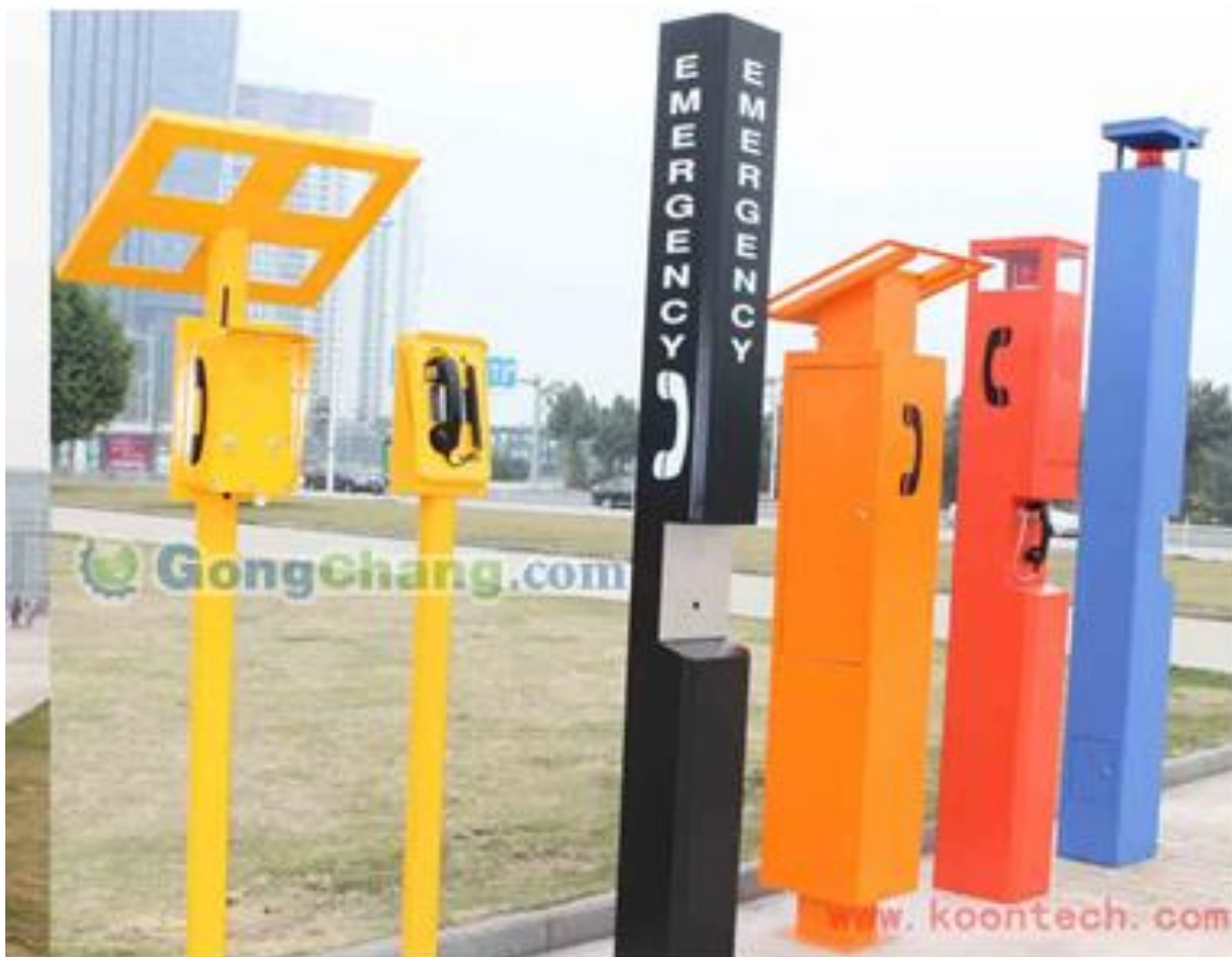
校園緊急求救通報系統