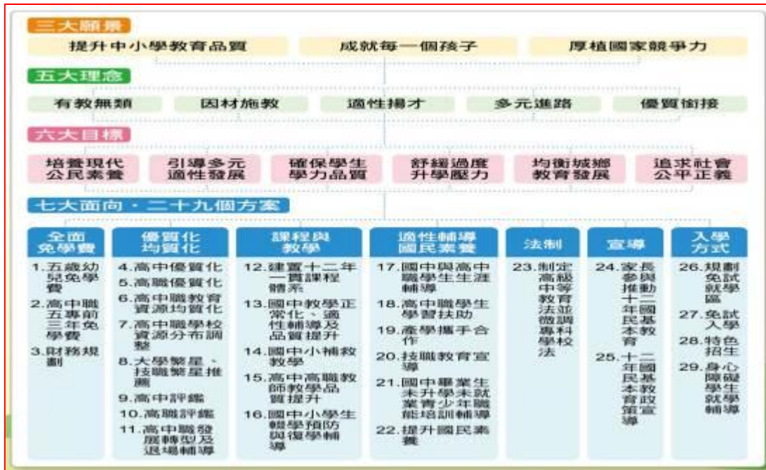
圖一 十二年國民基本教育的願景、理念、目標、方案關係圖

103 年實際實施時，計畫有部份修正，如「免學費」改為「一定條件免學費」（高職全面免納學費，高中依一定條件免學費）。十二年國民教育分兩階段，前九年為國民教育，依「國民教育法」及「強迫入學條例」規定辦理，對象為 6 至 15 歲學齡之國民，主要內涵為：普及、義務、強迫入學、免學費、以政府辦理為原則、劃分學區免試入學、單一類型學校及施以普通教育等。後三年為高級中等教育，推動制定「高級中等教育法」，對象為 15 歲以上之國民，主要內涵為：普及、自願非強迫入學、一定條件免學費、公私立學校並行、免試為主、學校類型多元及普通與職業教育兼顧。