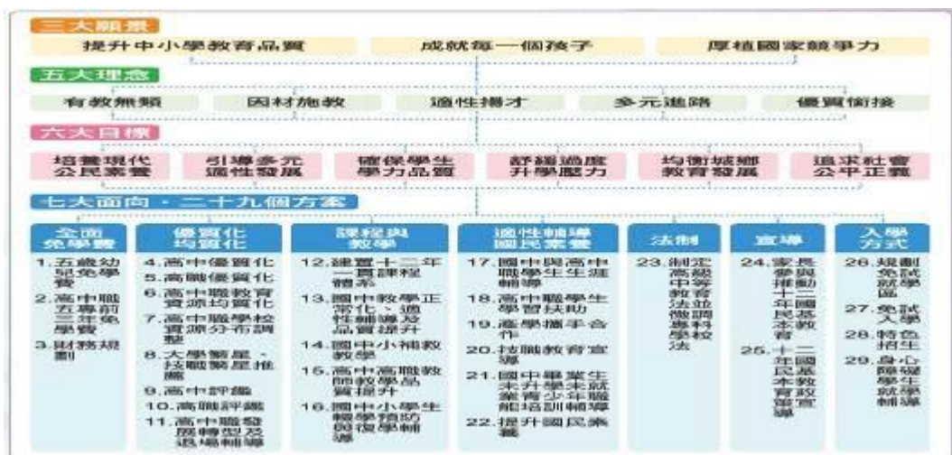
圖2 十二年國民基本教育系統架構

十二年國民基本教育系統架構共包含：三大願景、五大理念、六大目標、七大面向、二十九個方案(教育部，2013)，如圖2所示。