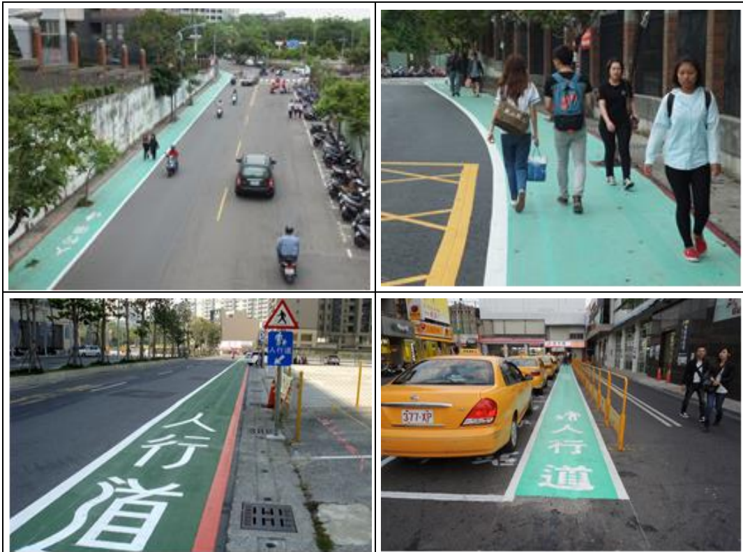
標線型彩色人行道標線設置成果

為維護行人用路安全，針對鼓山輪渡站、正修科技大學、鳳山國中及高雄巨蛋旁等人潮眾多且無法設置實體人行道地點，進行標線型彩色人行道標線改善工程，有效區隔行人及車流行駛空間，增進高齡者步行安全。