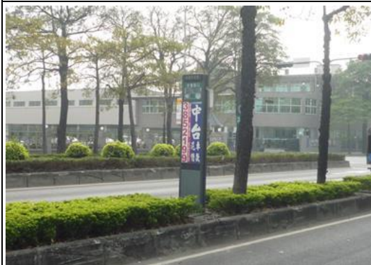
水管路口南下改善前