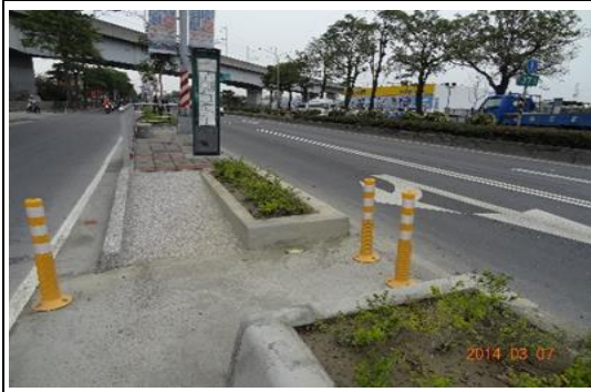
候車亭斜坡道寬度擴大為 90cm