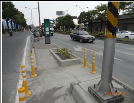
中華社區北上改善後