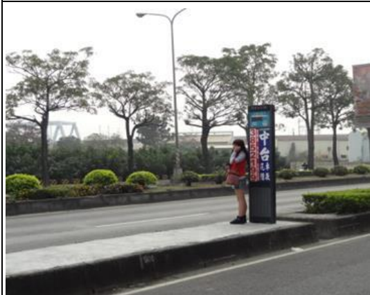
中華社區南下改善前