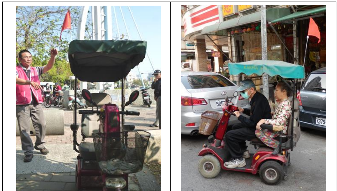
電動代步車宣導小旗

鑑於本市常有行動不便的民眾使用電動代步車，且使用者多為高齡者，因代步車車速慢、車輛高度低、夜間警示功能不足等特性，其他用路人稍不小心常造成追撞意外，具有潛在交通危險。為了維護使用電動代步車高齡者行的安全，特別貼心製作 300 組具有夜間警示功能的小旗，並請社會局長青中心協助發送免費安裝在電動代步車上，小旗顏色醒目且具有夜間 LED 閃爍警示功能，可提升高齡者用路安全，廣受高齡者歡迎。