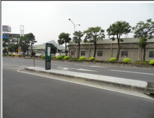
中華社區北上改善前