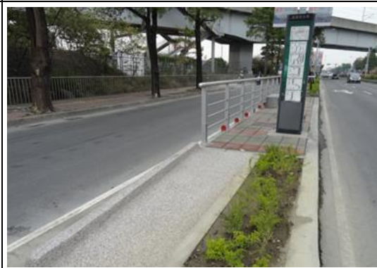
水管路口南下改善後