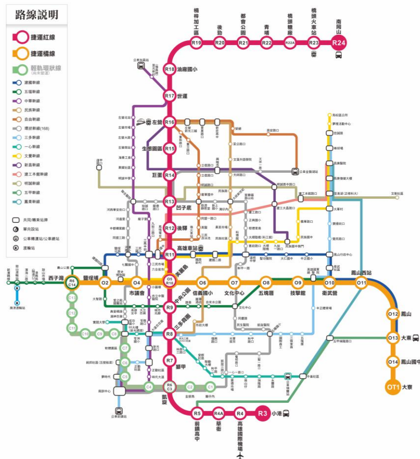
本市幹線公車路網圖

本局截至103年底，已完成市區公車整體規劃，包含15條主幹線、41條次幹線、70條社區巡迴公車；同時為提高捷運接駁公車載客率，於15條主幹線公車路線全面加密班次及增加轉乘站位、逐步改善候車空間及提供詳細轉乘資訊等，如：15條幹線公車行駛至轉乘站位時，於車上LED站名顯示器中顯示「下一站○○站，本站可轉乘○○幹線」之幹線轉乘資訊，俾車上乘客參考利用，期藉由刷電子票證優惠及便捷路網服務，鼓勵高齡者踴躍搭乘公共運輸工具。