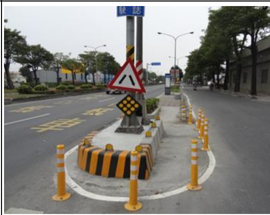
中華社區南下改善後