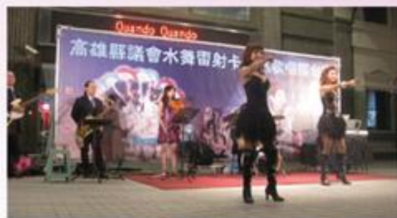
▲ 主持小汀、小乖賣力演唱情形，「安可」聲不斷。