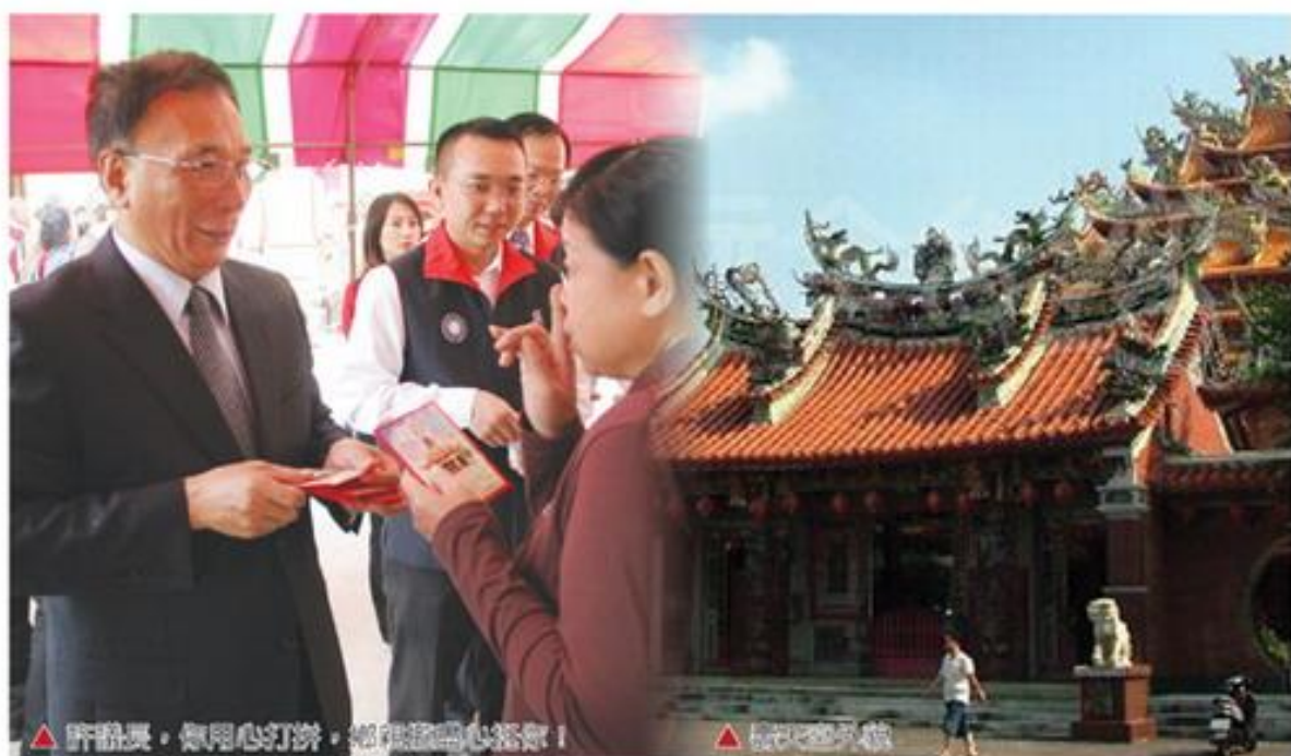
▲許議長，傾用心打拚，鄉親盡心恭敬！