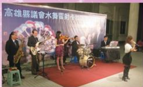
▲ 雅士樂團的演奏，是一場高水準的音樂饗宴，二個小時一口氣演奏11首中西歌曲。

Quizas、Quien sera、Tequila等；中文部分包括：你是我的花朵、夜上海、我不知我愛你、春花望露、偷偷摸摸、望春風、阮不知啦等，支支動聽。