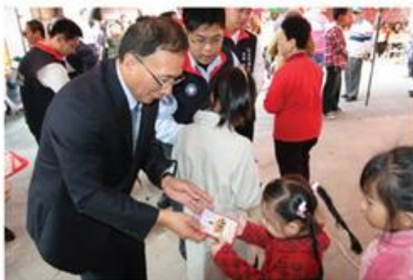
小朋友高興的由許議長手中接過紅包▶