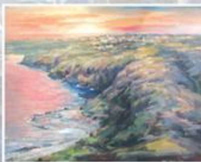
▲畫展展出作品之一

喜愛繪畫的學員很感謝本會提供優質的展覽會場和熱忱的服務，讓鄉親們能在舒適環境欣賞繪畫。