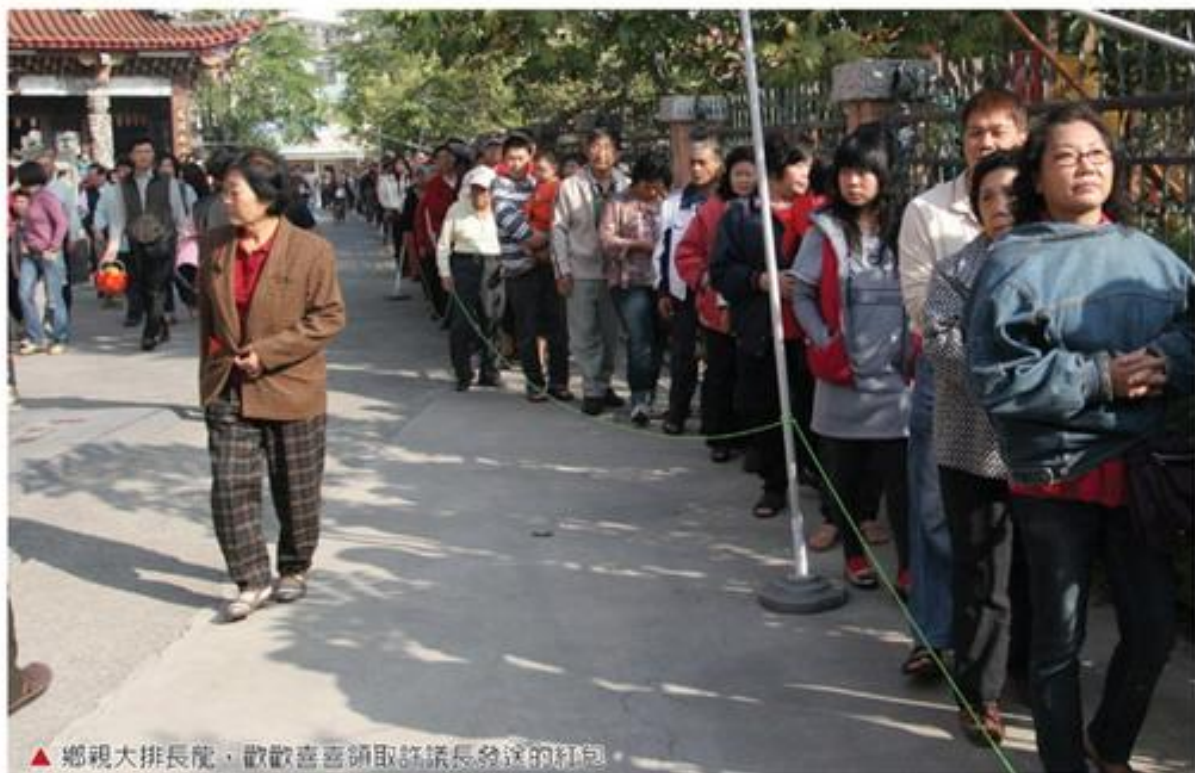
▲鄉親大排長龍，歡歡喜喜領取許議長發送的紅包。