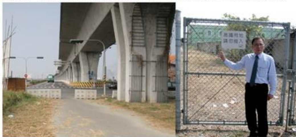
▲ 阿蓮鄉北方已開通，南方未開闢。

高鐵通車以來，沿途下方道路已成為居民及南來北往遊客，另一項替代選擇道路，唯目前高鐵下方道路，僅高雄縣阿蓮鄉以北可以通行，阿蓮鄉以南部分，除仁武地區一小段之外，目前尚無法通行，議長許福森以及多位議員認為，高鐵沿線下方道路無法銜接利用，已經嚴重影響到民眾行的權益。