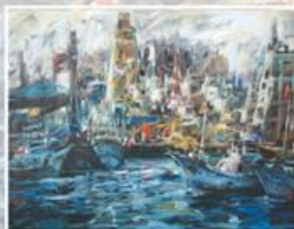
▲畫展展出作品之二