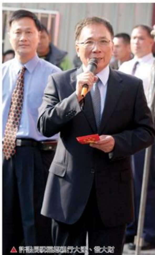
▲許議長親臨現場進行大型、發大財

所有排隊的人群，十分有秩序的走到許議長面前，領到紅包後喜孜孜的詳細看著紅包上寫著「財源廣進事業大展」的祝詞，感到滿心歡喜，有的小朋友還問父母祝詞的意思，全家樂陶陶。由於民眾參加領紅包活動十分踴躍，人群不斷，近下午一時全部發送完成。