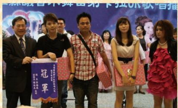
▲ 陳秘書長(左一)頒獎7月24日社青組週冠軍及入圍者