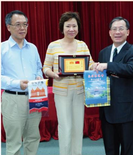
▲ 本會陳秘書長〈右〉致贈本會會旗及匾額給省諮議會李秘書長〈中〉留念。