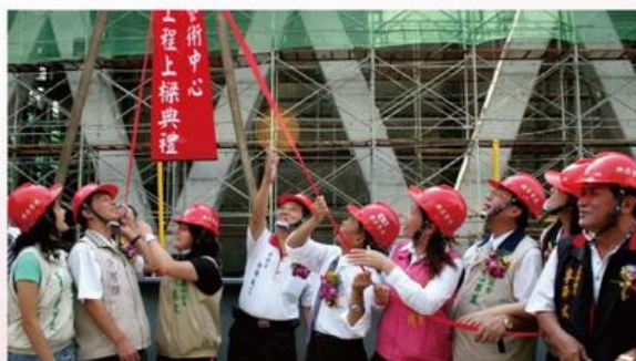
▲ 大東文化藝術中心新建工程舉行上樑典禮，本會多位議員參加。

，希望縣府預先培養更多藝術人口，透過學校教育培育學生藝術才能，每年皆舉辦藝術成果發表會。