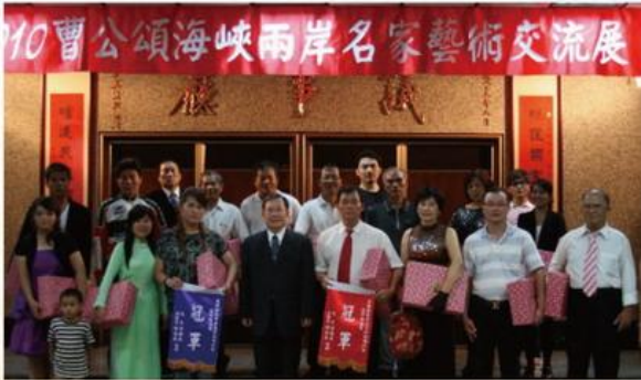
▲ 本會陳秘書長〈前排著西裝者〉與7月10日週冠軍及入圍者合影。