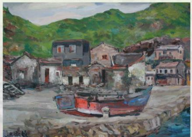
▲長庚美術社參展作品之一

許德耀醫師更強調，進入繪畫領域後，讓他發現藝術生活化，充滿了實踐的泉源，他更到世界各地的美術館參觀，特別發現日本的美術館，總是有眾多小朋友排隊參觀，日本的文化從小紮根，超越我們30年、50年，尤其，日本前首相小泉說：「政治人物若有人文藝術涵養，視野會更寬廣！」顯示藝術在生命呈現的重要性。