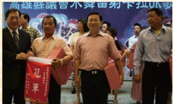
▲ 陳秘書長(左一)頒獎7月24日長青組週冠軍及入圍者