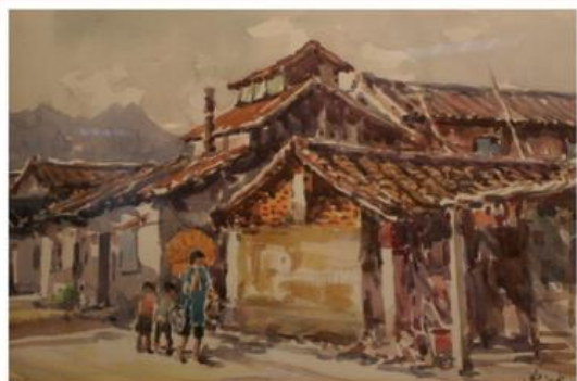
▲此次展出的畫作，都是難得一見的好作品。