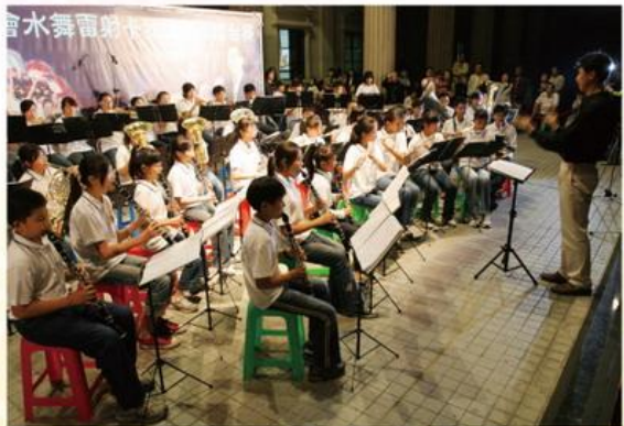
▲ 忠孝國小樂團應邀於4月24日周末藝文廣場表演，佳評如潮。

演出的曲目包括：「勇氣百分百」、「假日狂想曲」、「星期六交響曲」、「ABBA GOLD(阿巴樂團金曲)」、「ACCLAMATION(喝采)」、「蘇沙進行曲」、「聖誕慶典」、「未來ㄟ」等精彩演奏曲。