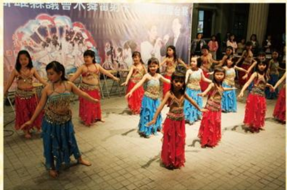
▲ 忠孝國小舞蹈團表演，舞技熟練，掌聲不斷。