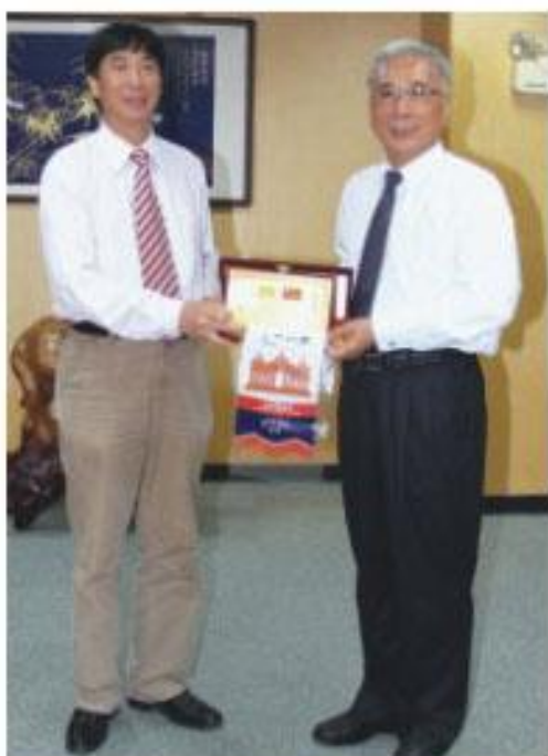
福建省福州市人大常委會訪問團來訪，議長許福森(右)代表贈紀念品予該會副主任陳樹雄

福州市人大常委會赴台交流訪問團11月24日由該會副主任(職務等同副議長)陳樹雄帶領該市人大常委主要負責人及幹部拜會高雄縣議會。