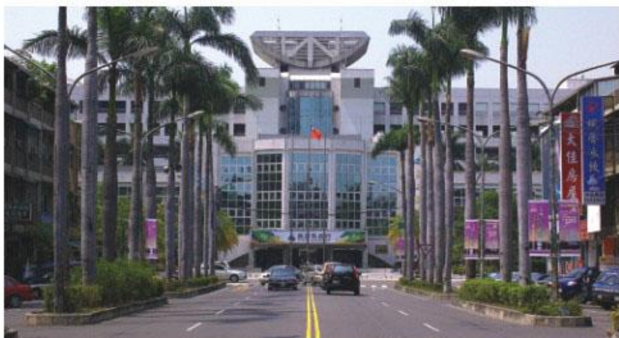
縣市合併，「縣」政府就將走入歷史

另外，在警政治安方面，縣市合併之後，也可大幅提升員警服務人口數比例，合理解決大高雄地區警力不足問題。高縣目前人口一百二十四萬二千八百六十四人，員警編制三千一百零四人，人口數與員警比例為四百比一，高雄市人口數有一百五十二萬零九百二十六人，員警編制數五千三百六十七人，人口數與員警比例為二百八十三比一。