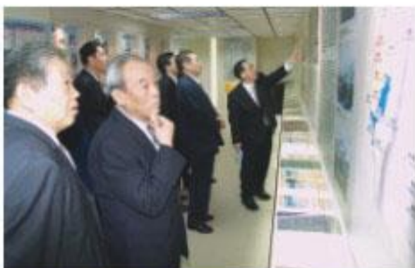
大陸宋慶齡基金會訪問團拜訪本會參觀會史館

梁余泉也盛情邀請許議長出訪位於北京的宋慶齡基金會及其故居等，參觀當地著名的歷史文物。該團於11月16日到達台灣，參訪台北、台中、彰化、嘉義、台南、高雄等地，預於25日返回北京。