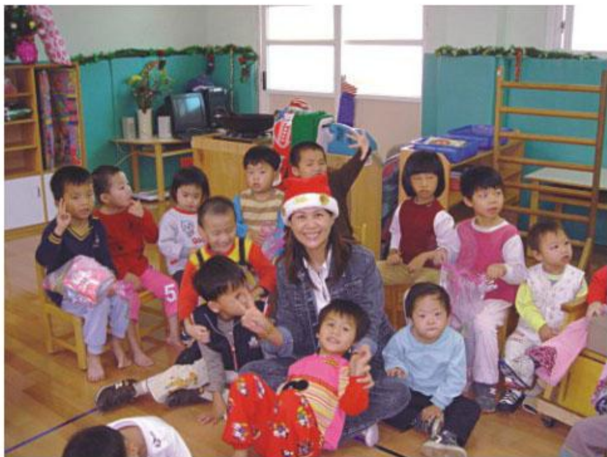
副議長陸淑美經常從事參與弱勢關懷以及婦女、兒童權益保護的公益活動

淑美經常從事參與弱勢關懷以及婦女、兒童權益保護的公益活動，更深深感受到兒童絕非父母親的資產，他們是獨立個體，擁有基本人權，捍衛兒童人權與保護兒童不受凌虐，是社會上每個人責無旁貸的責任，最近社會上發生四歲女童遭虐致死案件，讓社會震驚不已，很多可以挽救小生命的環節都在陰錯陽差中錯失，如果大人們再多一點關心、關懷，在細微處多一點觀察，也許悲劇可以挽回，遺憾就不會發生。