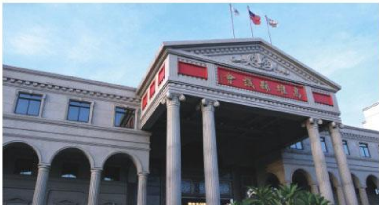
縣市合併，「縣」議會就將走入歷史

縣市合併之後，新高雄市人口數有二百七十七萬零五十人，依照直轄市員額編制標準，警察局員額可以提升到一萬一千七百三十九人，人口數與員警比例可提升為二百三十五比一，比縣、市目前比例來看，都有大幅提升的狀況，可以合理解決大高雄地區警力不足的問題，減輕員警工作壓力，發揮更大打擊治安的效能。