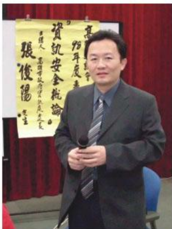
高雄市政府資訊處長張俊陽主講資訊安全概論

洩漏外，其次就是網站程式遭到破解，在使用軟體、搜尋資料時被點擊或是離職員工資料被竊改等途徑，會遭到資訊安全的威脅。