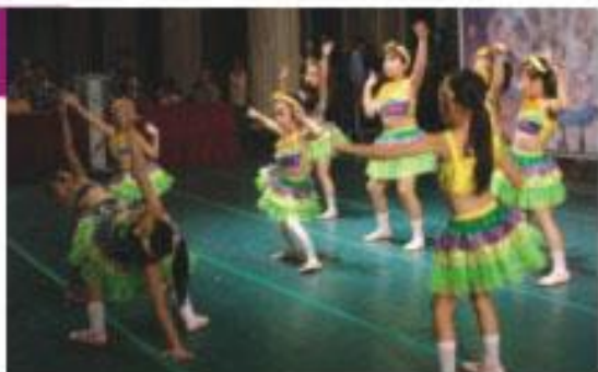
「翠雲音樂舞蹈班」演出7首勁歌熱舞