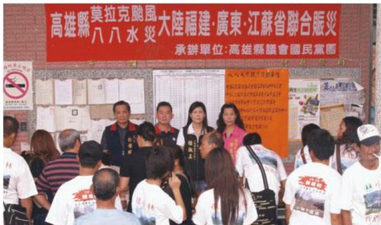
副議長陸淑美偕國民黨團議員深入災區發放賑災款

陸副議長親自在現場參與作業時，也不時關懷鄉親重建與生活狀況，許多受助者在談及罹難親人時，仍不禁哽咽悲痛。陸副議長說，很多家屬是一家三口或五口的唯一繼承人，當從受助者口中說出「謝謝」兩字時，她的心卻是難過得揪在一起，她衷心企盼家屬能逐漸走出這樣巨大的傷痛，重建未來的家園。