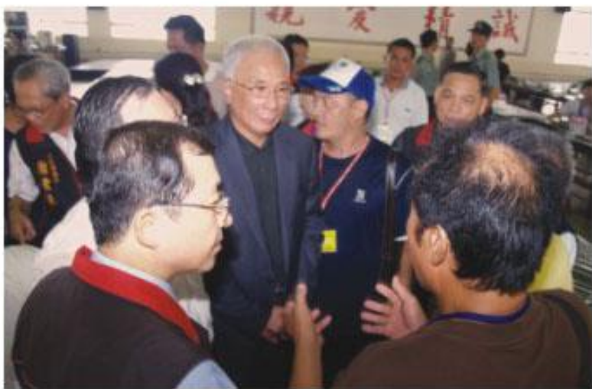
議長許福森聽取災區鄉親針對未來就業問題的詢問與建言

福森多次下鄉探訪八八水災受災民眾，也深刻了解受災民眾期望的不僅是現金救助而已，最重要的還是能夠踏上家園重建的道路，早日恢復正常生活，政府在面對失業數據攀升以及災害重建的雙重考驗下，必須儘速提振經濟環境，最重要的還是要回歸到擴大公共建設投資，和改善投資環境的基本面來著手，包括提供改善經濟的配套政策，採獎勵誘因方式來提升企業投資意願，大幅改善投資環境，力爭台商回流投資，重新提振台灣經濟。