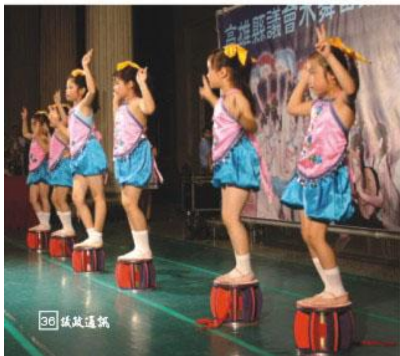
「翠雲音樂舞蹈班」演出「鼓堂」

本會行政組表示，藝文廣場是所有鄉親的園地，歡迎鄉親闖家蒞臨，現場有咖啡、麥茶、餅乾糖果等免費享用。有意參賽一展歌喉的業餘歌唱愛好者，歡迎向本會網站 ( http://www.kccc.gov.tw ) 查詢或洽本會行政組 (電話：7470171轉2068)。