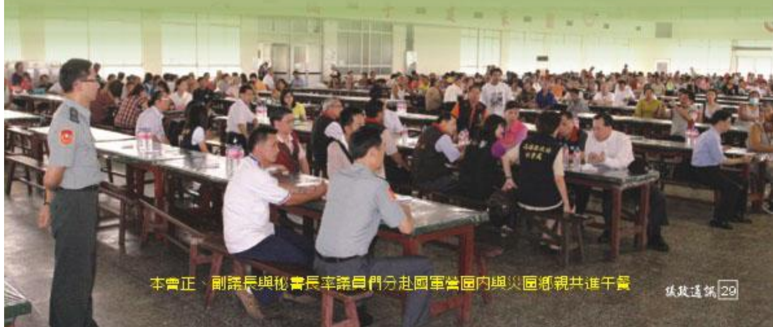
本會正、副議長與秘書長率議員們分赴國軍營區內與災區鄉親共進午餐

服務電話：670-1236 E-mail:ks1654@ms.a.ks.cc.gov.tw