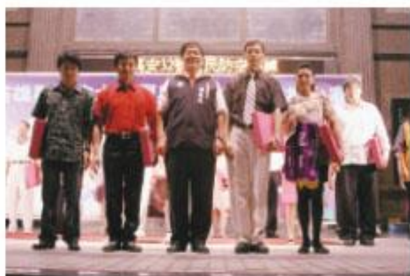
社青組優勝者由劉德林議員(左三)頒發

本會行政組表示，藝文廣場是所有鄉親的園地，歡迎鄉親攜眷帶伴闔府蒞臨，現場有咖啡、麥茶、餅乾糖果免費享用。有意參賽一展歌喉的業餘歌唱愛好者，歡迎向縣議會網站 ( http://www.kccc.gov.tw ) 查詢或洽議會行政組 (電話：7470171轉2066)。