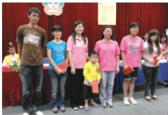
副議長陸淑美(前左三)頒發婦聯會獎助學金

這次南部地區因為八八水災慘遭重創，家庭變故與貧困而繳不出學費情形相當多，尤其是本縣偏遠鄉鎮受災普遍嚴重，為免清寒家庭雪上加霜，陸副議長邀集多家友好企業