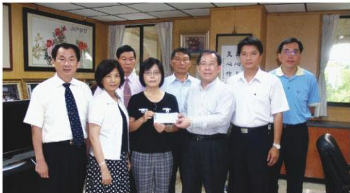
全體議員暨職員工懷抱人溺己溺的關愛，集合眾人之愛捐出一日所得

陳秘書長表示，此次莫拉克颱風及八八水災中，本縣山區鄉鎮受創最為慘重，每位承受苦難的鄉親，都是我們的手足骨肉，無論是進行中的搶救任務，或是未來重建家園工作，都是無比艱辛與漫長，本會也將會持續投注資源與關懷，減輕鄉親的傷痛，逐步讓鄉親生活恢復正軌。