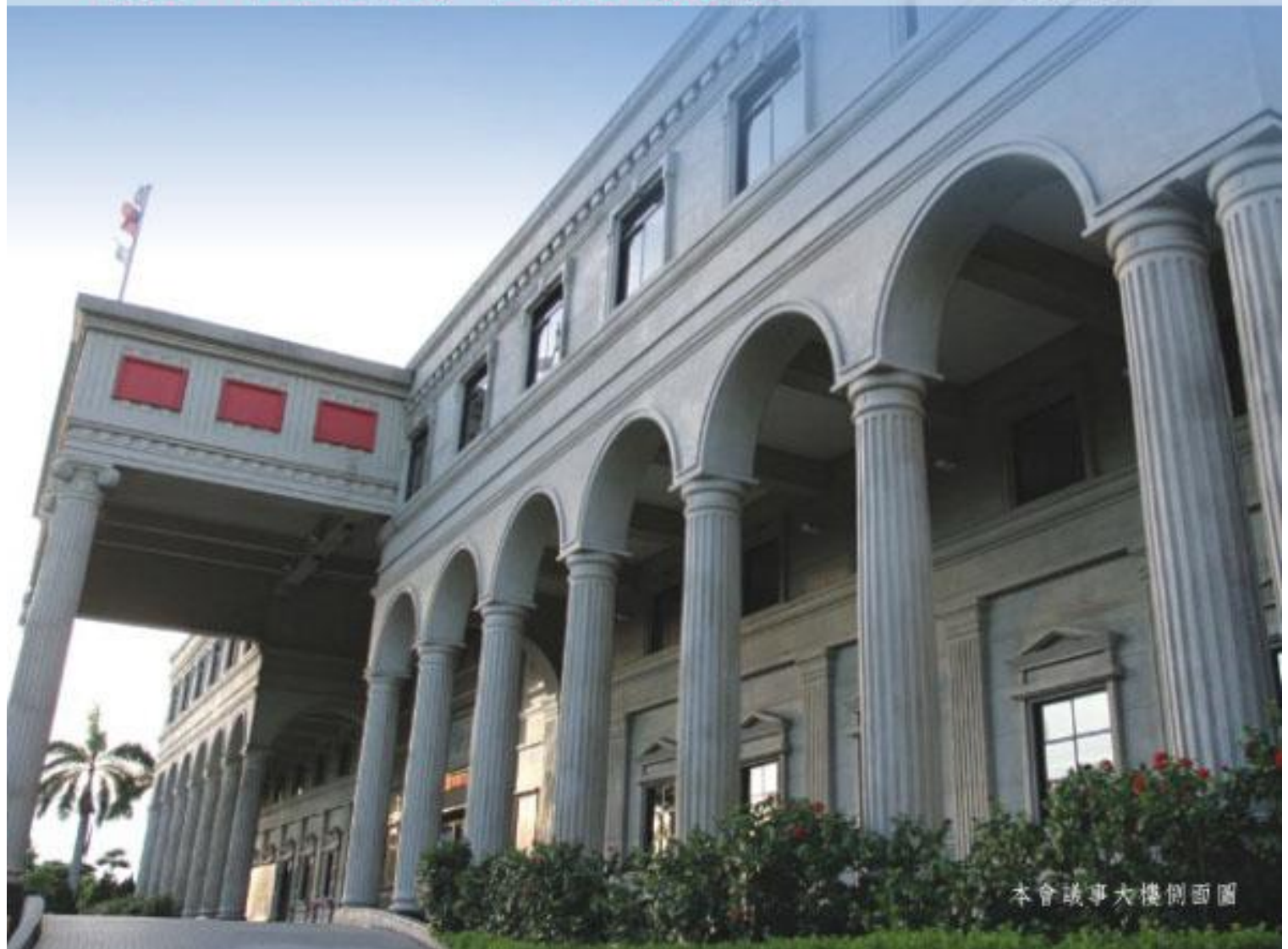
本會議事大樓側面圖