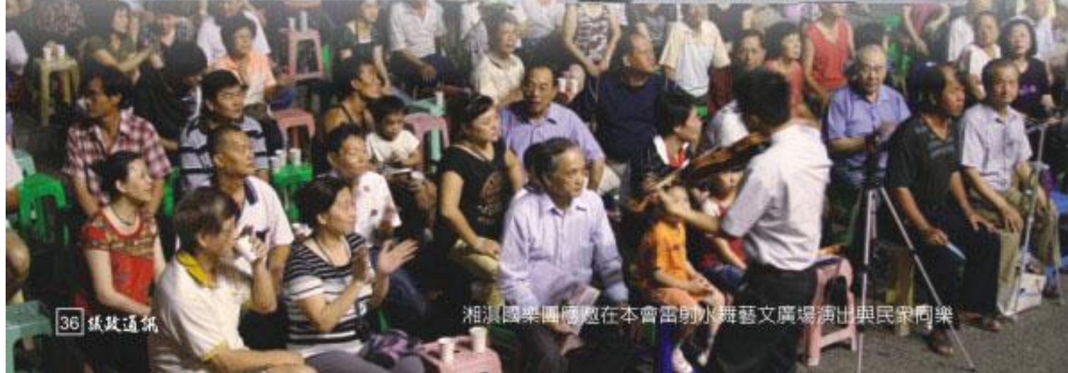
湘淇國樂團應邀在本會雷射水舞藝文廣場演出與民眾同樂