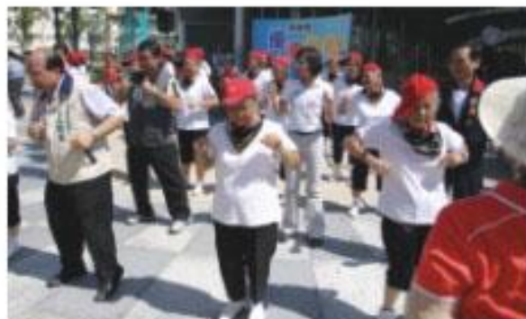
本會議員與阿公、阿嬤們以扭扭舞熱力開場

「優惠記名卡」七月正式上線，開卡典禮在高雄捷運橘線013大東站前廣場熱鬧登場，一群年過半百的阿公、阿嬤打扮十分俏