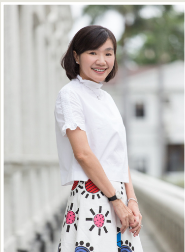
NO.7 高市議壇第七期 / 議員講堂