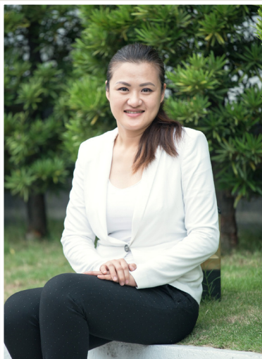
NO.7 高市議壇第七期 / 議員講堂