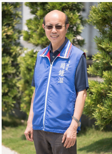
NO.7 高市議壇第七期 / 議員講堂