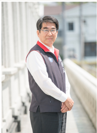
NO.7 高市議壇第七期 / 議員講堂