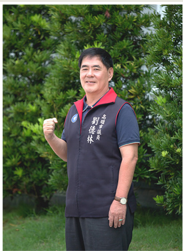
NO.7 高市議壇第七期 / 議員講堂

註：一環是都會延伸環線（黃線），二連結是鳳山本館連結線（藍線）和民族高鐵連結線（青線）。