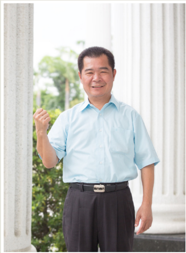
NO.7 高市議壇第七期 / 議員講堂