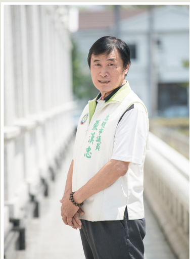
NO.7 高市議壇第七期 / 議員講堂