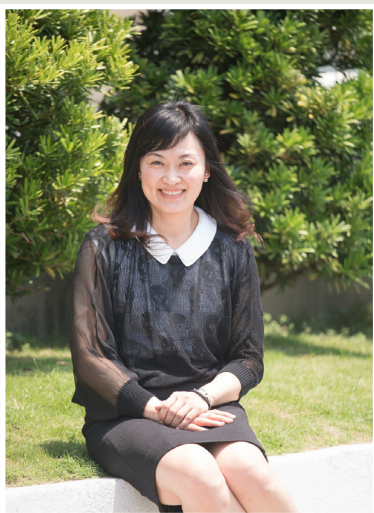
NO.7 高市議壇第七期 / 議員講堂

至於熱門商品，曾議員也建議先預告數天，給民眾有審視物品的時間，然後再訂標購的日期，如此，有興趣的民眾也有充裕的時間評估商品價值，以減少標售爭議。