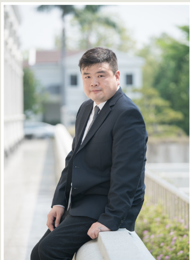
NO.7 高市議壇第七期 / 議員講堂