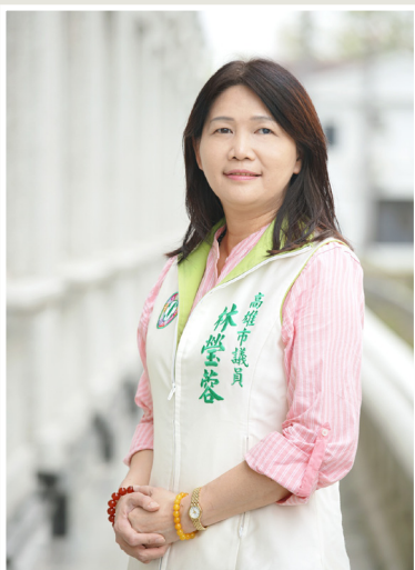
NO.7 高市議壇第七期 / 議員講堂