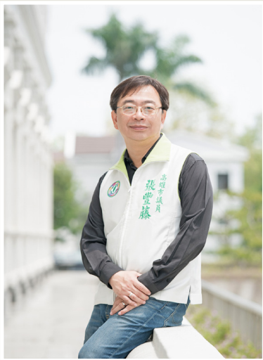
NO.7 高市議壇第七期 / 議員講堂