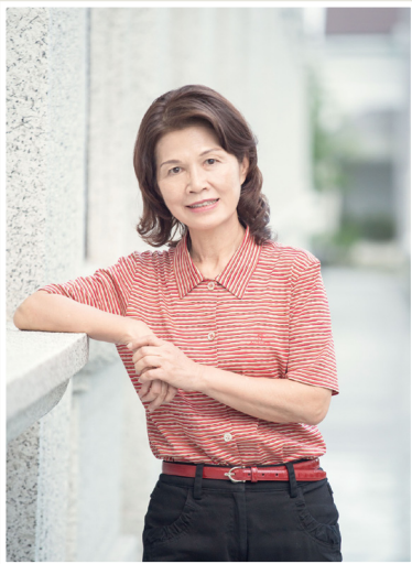
NO.7 高市議壇第七期 / 議員講堂