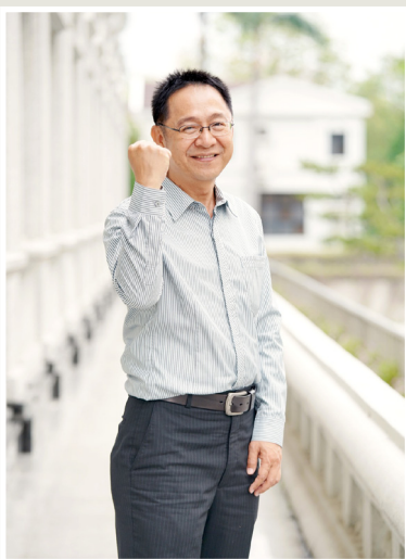
NO.7 高市議壇第七期 / 議員講堂

高雄市的計程車彈性共乘服務原先僅有大湖、大樹、大寮及永安線，目前燕巢線也已試辦上路，民眾只要在搭車前一日17時前事先向中華大車隊預約即可。燕巢線試辦的3個月內，民眾還可持一卡通搭乘僅需付費10元，若持敬老、博愛卡則能享免費優惠。陳議員樂見該服務在燕巢區實施，也建議市府多多舉辦優惠活動以推廣服務，期待社區學童及高齡者能有效運用便利的計程車服務。