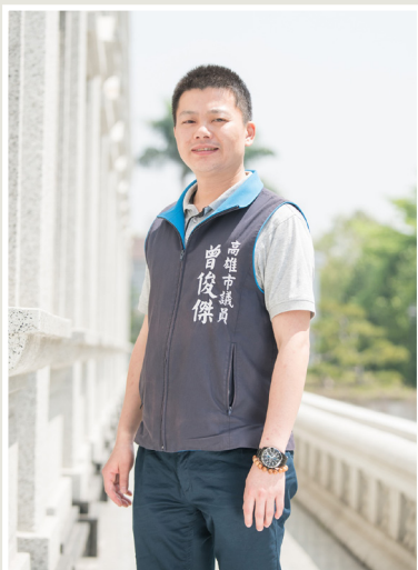
NO.7 高市議壇第七期 / 議員講堂