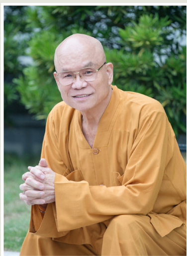
NO.7 高市議壇第七期 / 議員講堂

根據媒體報導校園中流行的是「K菸」，K菸不像搖頭丸或安非他命那麼興奮，但吸久了就像香菸一樣還是會上癮，由於其成本便宜，售價低廉就連學生也負擔得起，因此K他命才會這麼氾濫。曾議員認為市府防制毒品不僅是警察局、教育局的責任，更應聯合衛生局等其他單位，針對已經吸毒的學生進行輔導與治療，另外也應往上追出藥頭，把這些提供毒品的集團，幕後黑手找出來、取締。他也提到要有長期作戰的心理準備，否則在青少年養成濫用藥物的習慣，成年後恐將會製造更多危害社會的事端，讓國家社會付出慘痛代價。