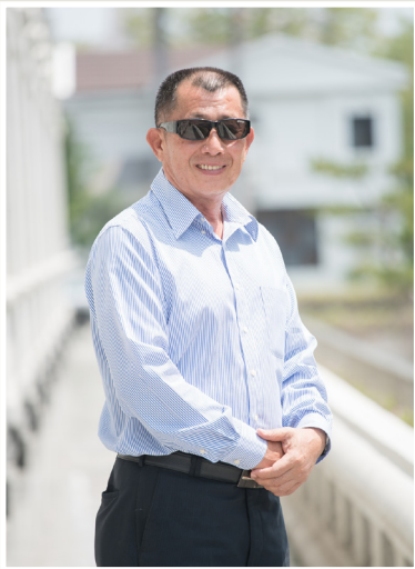
NO.7 高市議壇第七期 / 議員講堂