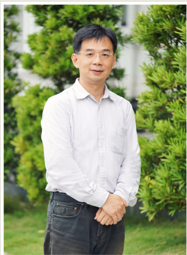
NO.7 高市議壇第七期 / 議員講堂

中央大力推動長照計畫，地方政府也加緊腳步盤點現有服務資源、可供活化利用的場地設施等。黃議員也關心市府在人力資源運用上的做法，應結合包括外籍配偶、年輕人、二度就業婦女等在地人力資源，加上當地學校相關科系產學合作，讓他們在地就業，在地服務需要幫助的長者。她理解長照計畫希望能全面照顧不同健康狀態的長者多元且連續性的服務，然而公部門力量有限，期盼更多的民間資源投入，大家一同打造更舒適的高齡社會。