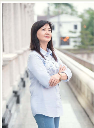
NO.7 高市議壇第七期 / 議員講堂

張議員指出，長庚醫院周邊還有澄清湖、棒球場、正修科技大學、圓山飯店，是相當重要的觀光區域，尤其棒球場的交通運輸一直被市民詬病，也是職業球團無法安心認養的主因。如果未來能有輕軌接駁，對愛好棒球運動的市民來說絕對是一項大利多，看球不用再擔心停車問題，一定能大大提升球賽票房，連帶刺激球員賣力演出，提升高雄的運動風氣和觀光效益。