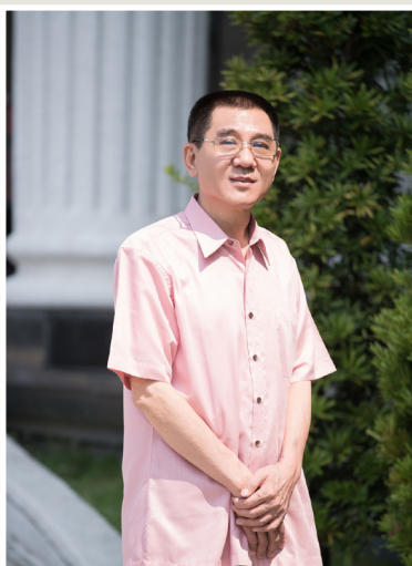
NO.7 高市議壇第七期 / 議員講堂