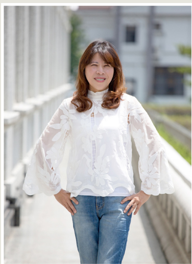
NO.7 高市議壇第七期 / 議員講堂

雖然農作物受天災影響產量，但農村人口高齡化，勞動力明顯不足，人力需求問題也是刻不容緩。張議員希望市府能協助農民將自耕式農園發展成體驗式休閒農園，讓民眾前來體驗農村文化，他也呼籲農二代返鄉，藉由青年朋友的新思維為傳統農村注入改變的力量，開創新的經營模式，重新塑造農村形象，走出「型農」的一片天。