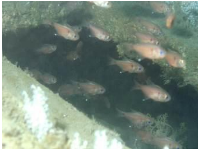
船艙內有眾多魚群棲息具有生態保育效果