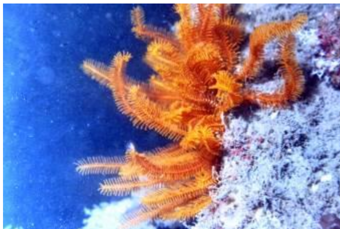
生長在船礁上的美麗海葵