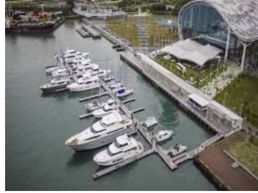
遊艇俱樂部碼頭空照圖