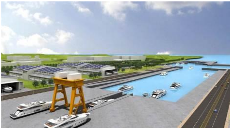
南星遊艇產業園區下水測試區模擬圖

既有的遊艇製造優勢群落，高雄市政府選定屬於小港區行政範圍的南星計畫區發展遊艇產業園區，園區規劃有行政服務區、遊艇製造區、下水測試區、關聯產業製造區及公共設施區等 5 大專區，希望藉由園區的設置來整合遊艇產業中的製造、五金零件及物流等中下游產業，形成產業聚落，發展完整遊艇產業鏈，提昇遊艇產業競爭力，目前國際 70 呎以上遊艇市場需求逐日成長，遊艇產業園區的設置將有利於業者朝更大型化及更高附加價值的豪華遊艇發展，並突出台灣遊艇產業優異製造技術並作出市場區隔，台灣遊艇產業若想要在國際市場中維持競爭力與保持現有優勢，設置遊艇產業園區是必然的選擇。遊艇產業園區設置後預估將可產生 4,000 人以上就業機會，估計創造新台幣 100 億元產值，目前遊艇產業園區設置雖遭遇環評審查尚未通過之困境，不過目前高雄市政府已針對環境影響課題，允諾採最高環保規範作為遊艇廠商進駐設廠條件外，並重新規劃調整園區規模，將兼顧產業與地方環保訴求辦理開發，期待各界能以理性看待園區設置，讓遊艇產業園區設置順利通過，早日打造高雄成為亞洲頂級遊艇製造中心，避免在競爭激烈之國際遊艇市場失去先機。