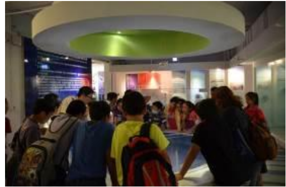
高雄市漁業文化館參觀照片