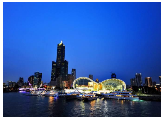
高雄展覽館後方遊艇碼頭夜景

台灣發展遊艇產業 40 多年，歷經 1980 年末美國課徵奢侈稅，遊艇購買量劇減、1990 年代初台幣對美元瞬間大幅升值，以及後來工資、土地價格上漲，營運成本劇增，利潤驟減，多家遊艇廠甚至無法維持正常營運而關門大吉，2008 年又遭逢金融風暴，台灣遊艇產業勇敢面對一連串的危機，並在各界努力下，調整經營策略、積極產業整合與力求轉型，遊艇產業朝向高附加價值、大型化、客製化頂級遊艇外銷發展，各界一路走來的堅持與努力，台灣交出了名列全球第六大遊艇製造國之耀眼