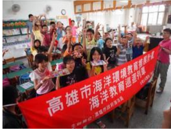
海洋環境教育推展計畫－海洋教育巡迴列車活動照片

臺灣四面環海，是一個海島國家，但我們對海洋的了解有多少？現今，臺灣四周的海洋生物多樣性正日漸消失中，我們要如何來挽救呢？為培養本市學童保護海洋環境的理念，進而達到向下扎根的理想目標，辦理相關海洋環境教育活動，期能有效提升海洋子民關愛海洋的意識，藉此開闊他們的視野、豐厚他們的生命，成為他們開啟探索世界的一把鑰匙，並培養他們對於生命、自然環境的尊重，加深他們資源保育觀念。