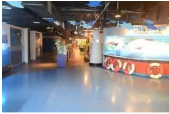
拖網、沿近海漁業區