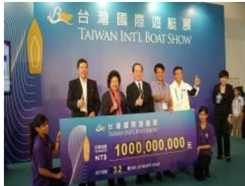
成交新台幣 10 億元訂單