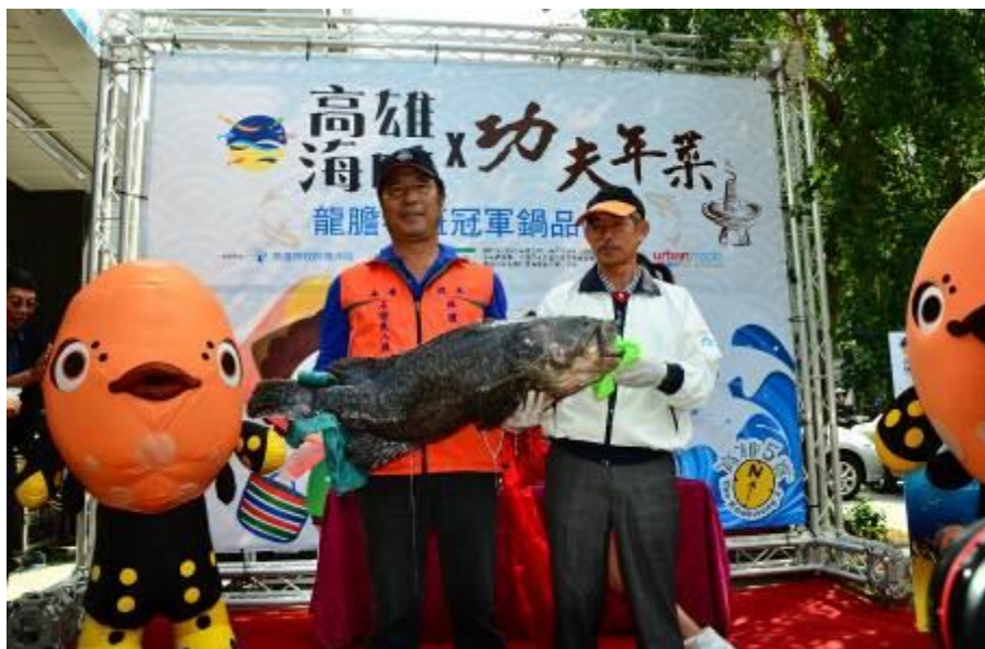
農曆春節推出高雄海味系列—龍膽石斑魚涮涮鍋