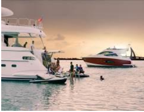
遊艇休閒活動照片