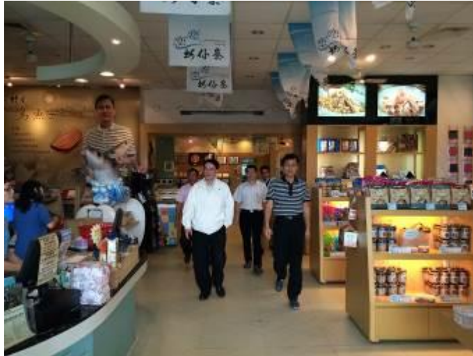
農委會前副主委胡興華蒞臨指導，對蚵仔寮漁港轉型讚譽有加。