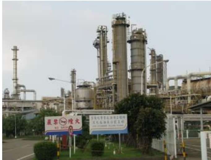
高雄煉油總廠即將於104年12月停工