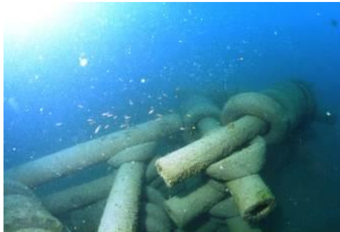
可投放在柴山外海之水泥電線桿製作之人工魚礁， 當成保育礁體。