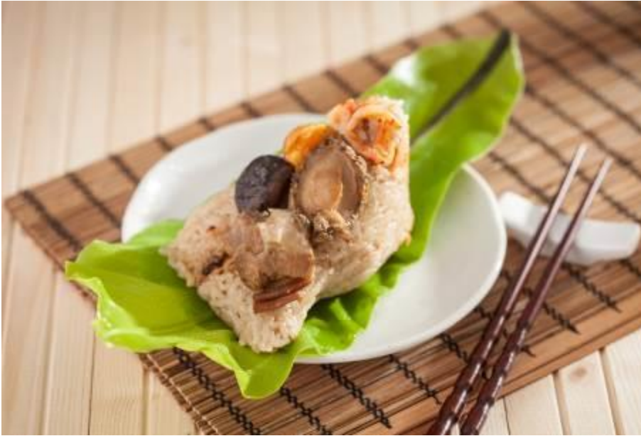
端午節推出高雄海味系列－海鮮八寶粽