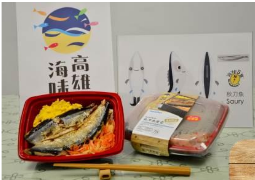
全家便利商店即可享用高雄當季最新鮮鮭魚與秋刀魚