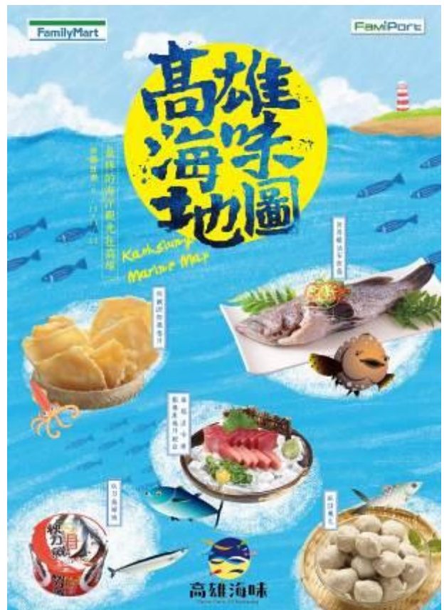
全家便利商店的 FamiPort 推出 「高雄海味商品預購」

高雄市政府海洋局未來仍持續規劃優質漁產品推廣之計畫，推動所轄漁業加工場及漁業相關公司利用在地盛產符合衛生安全之魚貨原料，全面提升加工技術及包裝設計層次，開發各式具高雄特色的精緻漁產品，讓消費者可多元並安心選購。並積極媒合漁業相關業者與國內知名超市、超商或量販業者等相關通路進行合作聯盟，設立「高雄海味」專區，開拓國內定點通路，並配合產季或節慶舉辦漁產品推廣活動行銷宣傳。藉由推出的「高雄海味」品牌行銷，搭配各式活動，以趣味、新潮及活潑之方式，吸引更多年輕族群食用新鮮美味的海產，並增加高雄漁產行銷通路之多樣化。在漁產養殖、加工及推廣不同面項的持續研發與發展下，期許高雄市的每一項漁產品之品質朝更精緻與多元化的方向發展，藉此將高雄海味的各式漁產品全面推廣出去，而透過強勢行銷通路幫助高雄漁業，亦能讓更多國人享用到高雄在地的新鮮海產。