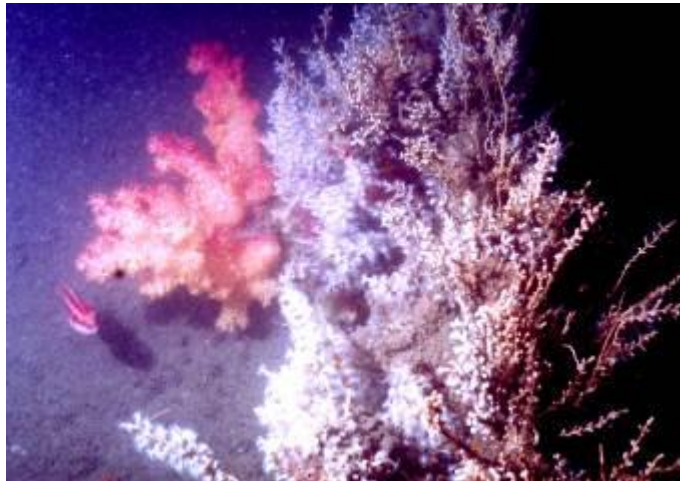
船礁上所長出之海雞頭軟珊瑚及蘘枝蟲， 可吸引觀光客到此潛水