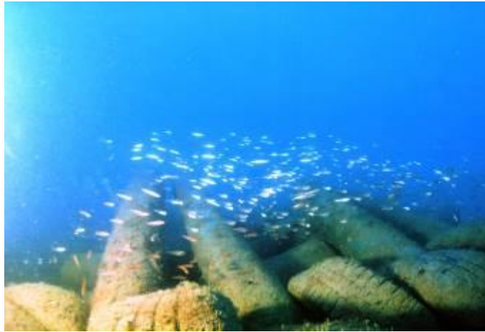
水泥電線桿製作之人工魚礁， 投放兩個月後即有大批仔稚魚到此棲息