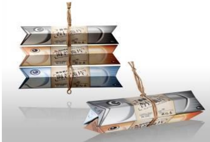
魚型脆片禮盒獲 2012 德國紅點及 IF 設計獎中國之星包裝金獎