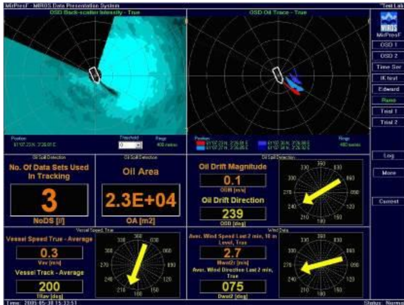
圖 3 MIROS 雷達即時監控油污系統 OSD 資訊