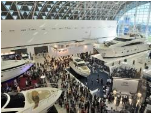
遊艇展展出期間人潮踴躍

國、義大利、新加坡、香港、中國大陸與印尼等 11 個國家、地區，計 168 家廠商參展，吸引超過 2,000 名國外買主來台觀展，參展廠商滿意度調查超過 95%，4 天展期，參觀人數突破 7 萬人次，成功售出 32 艘遊艇，成交金額達新台幣 10 億元，此外，預估帶動交通、食宿、娛樂及觀光等周邊效益約新台幣 2 億元，高雄首次舉辦的「2014 台灣國際遊艇展」，獲得各界好評，充分展現台灣遊艇產業實力，提昇國際曝光度。為持續行銷我國遊艇產業，將於 2016 年 3 月 10 至 13 日舉辦第 2 屆台灣國際遊艇展，屆時高雄展覽館室內及戶外水上泊位區將展示精品遊艇、相關機械、動力設備及零配件、船舶檢驗與設計、運輸服務、水上運動、休閒及觀光等，預計將有 200 家以上遊艇產業相關廠商參展，展示攤位將超過 900 個，展覽規模將超越 2014 台灣國際遊艇展。