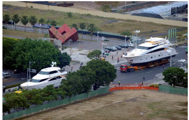
2014 年台灣遊艇展陸上行舟