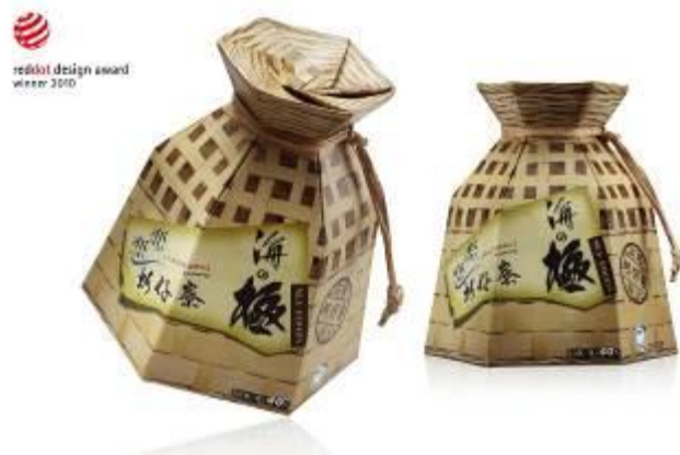
榮獲 2010 紅點設計獎—六角魚簍禮盒