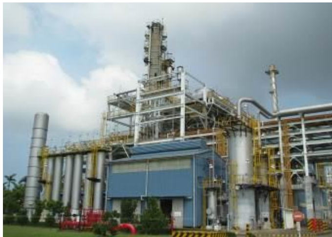
高雄煉油總廠五輕廠即將於 104 年 12 月停工

高雄港以及柴山外海則是一片少有之岩礁海岸，當地海洋生態景觀不錯，可就近投放多重帶狀人工魚礁，如電桿魚礁、廢船礁、海藻礁等形成多孔隙結構以利海生物成長、復育，吸引魚貝類至此棲息、產卵及仔稚魚躲避敵害，等這些小魚長成中魚或大魚後，自然會逸出至鄰近海域，並限制禁止任何捕撈行為，將其當成海洋生態保育區。在此地亦可開放市民潛水觀光，只准拿相機，不可拿魚槍，嚴禁各種捕撈行為，如此 3~5 年下來，此處亦會形成珊瑚礁生態群落，對高雄市海洋首都形象、海洋生態美景、市民海洋知識及親海愛海等休憩活動皆有很大助益。