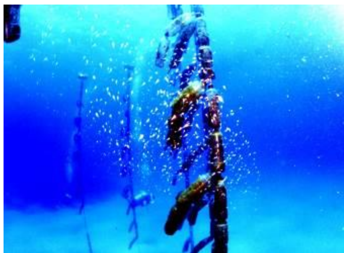
保特瓶礁可吸引大量仔稚魚到此棲息